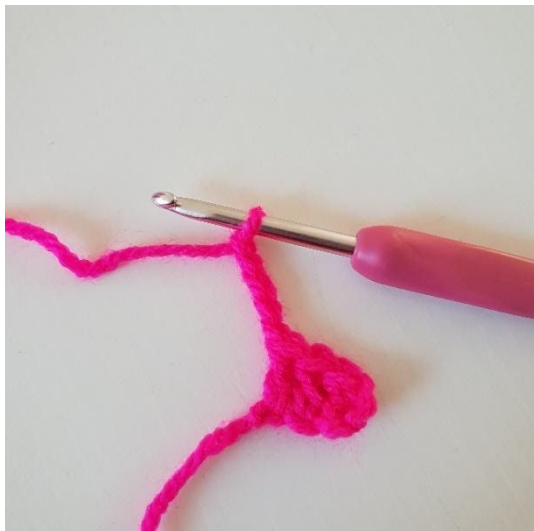
1. Gör 5 luftmaskor