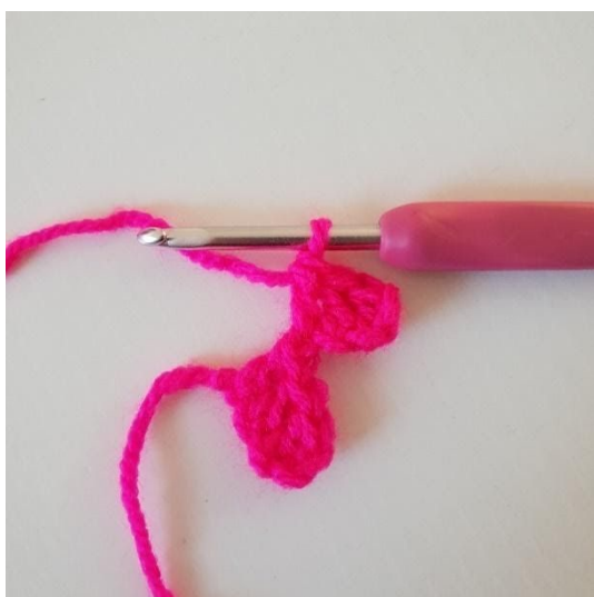
3. Virka stolpar i de nästa 2 lm. Nu har du en till pixel.