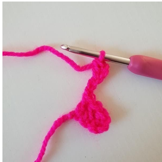
2. Virka 1 stolpe i tredje lm från nålen