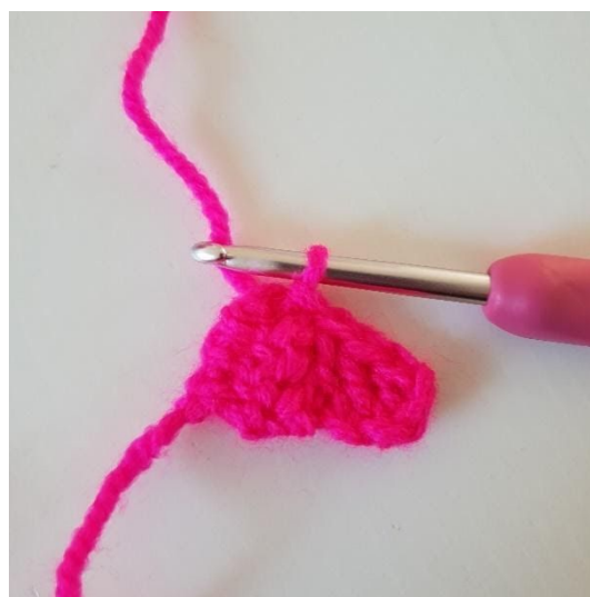
4. Nu ska pixeln virkas ihop med den första pixeln, gör det genom att vända på pixeln och göra en sm i vänstra sidan på den första pixeln. På bilden ser du dom ihopvirkade.