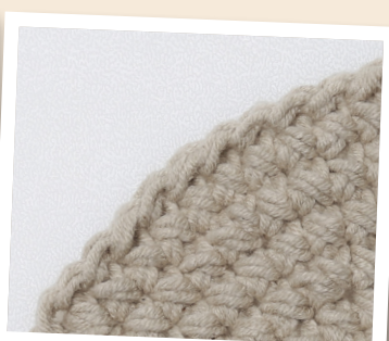
Fast maskans rätsida.