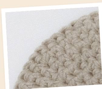
Fast maskans avigsida.

Vår ryggsäck är virkad från en fast botten och där är det fastmaskans baksida som blir vår framsida.