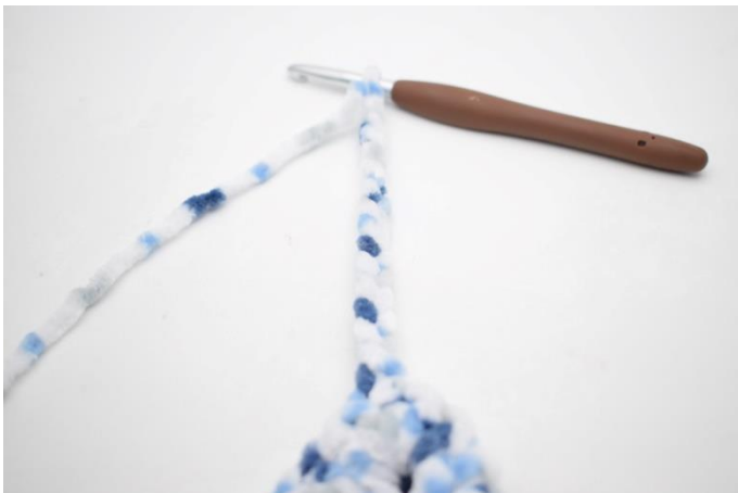
36. Virka 15 lm. Virka 3 fm i 2:e lm från nålen. Virka 3 fm i varje m av de återstående 12 lm.