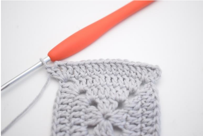
17. Virka "1 st i de nästa 11 m, 2 st, 2 lm och 2 st i nästa lm-båge".