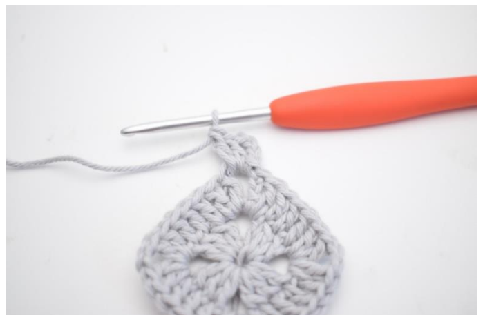
11. Virka 4 lm. Virka 2 st i lm-bågen.