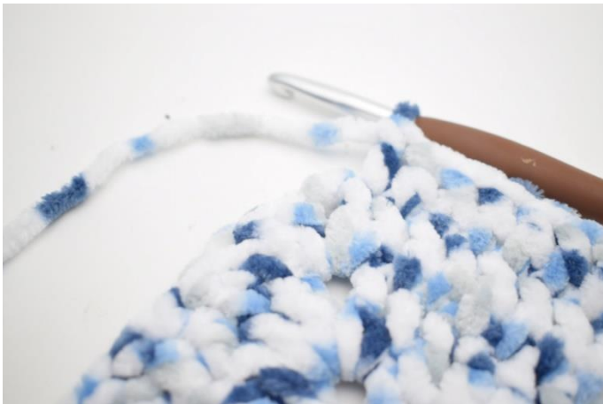
23. Virka "1 st i de nästa 27 m.