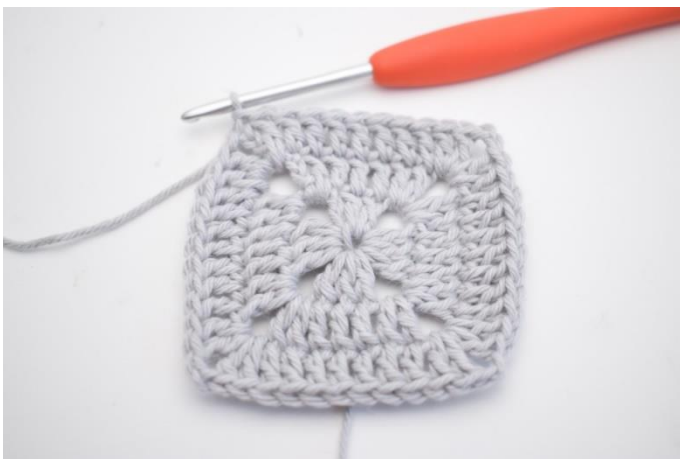
14. Virka 1 st i de nästa 7 m och 1 st i lm-bågen från varvets början. Avsluta med 1 sm i 3:e lm.