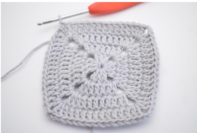
19. Virka 1 st i de nästa 11 m och 1 st i lm-bågen från varvets början. Avsluta med 1 sm i 3:e lm.