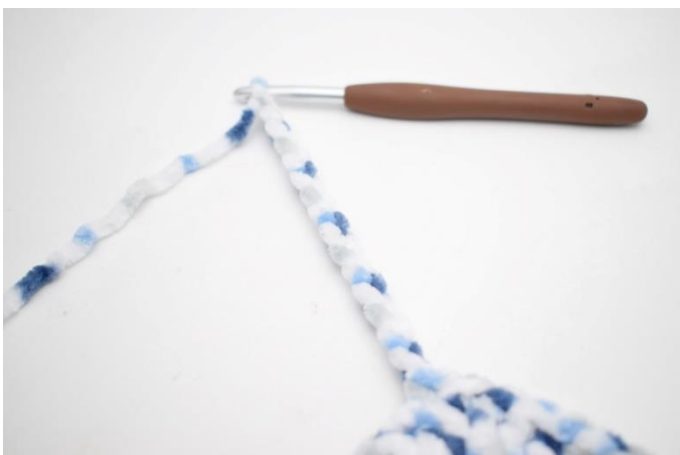
30. Virka 15 lm. Virka 1 st i 3:e lm från nålen. Virka 1 st i de återstående 12 lm.