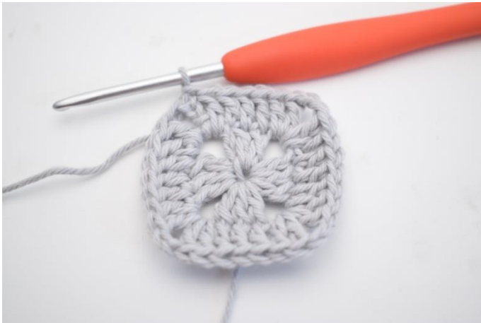
9. Virka 1 st i de nästa 3 m och 1 st i lm-bågen från varvets början. Avsluta med 1 sm i 3:e lm.