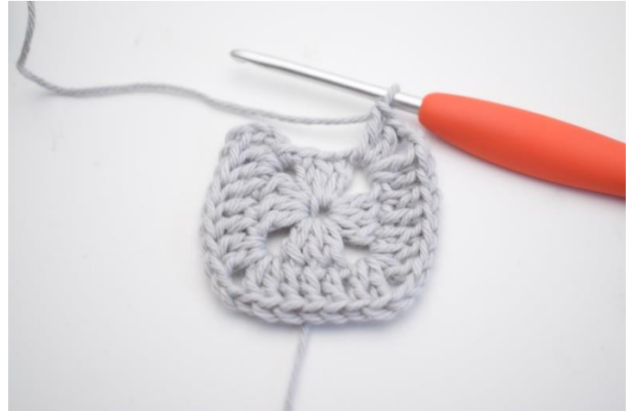
8. Upprepa "-" 3 gånger.