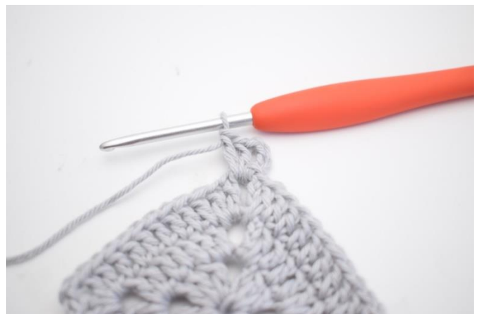
16. Virka 4 lm. Virka 2 st i lm-bågen.