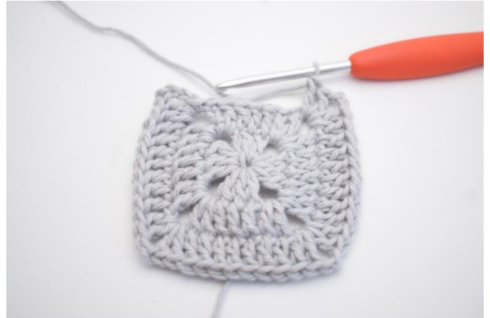
13. Upprepa "-" 3 gånger.