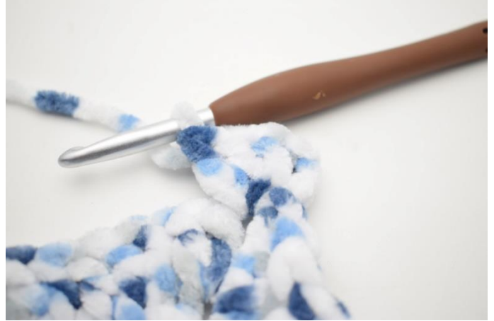
22. Virka 3 st i lm-bågen.