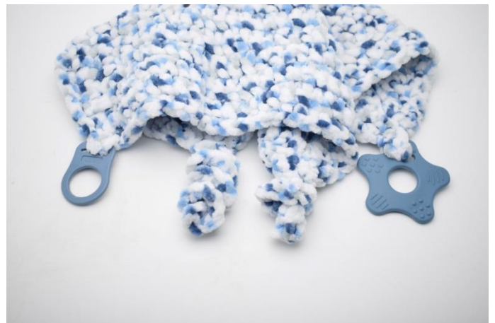
8. Din Nuzzle-snuttefilt är nu klar och barnet kan gosa, leka och nanna med den 😊