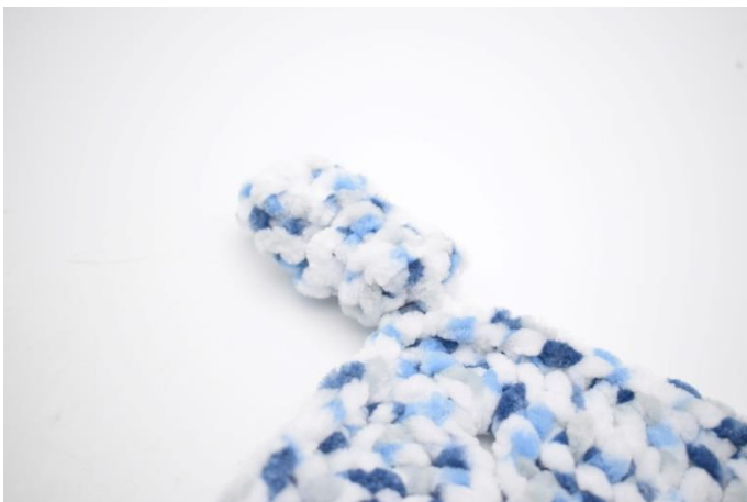
7. Sista hörn är som det ska vara.