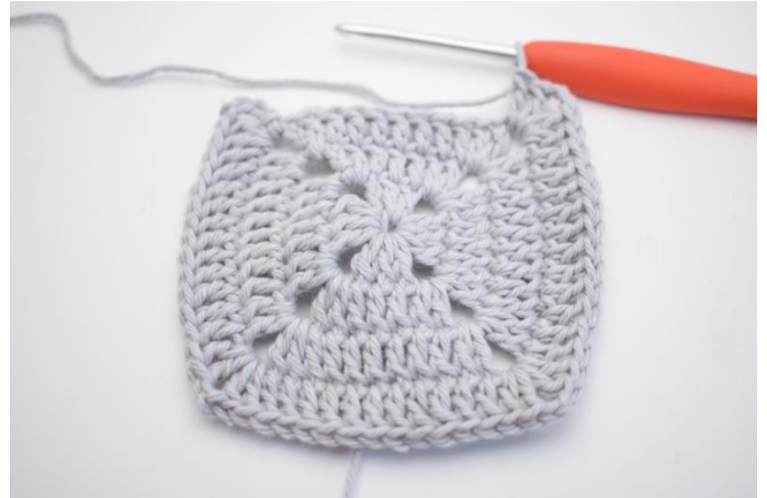
18. Upprepa "-" 3 gånger.