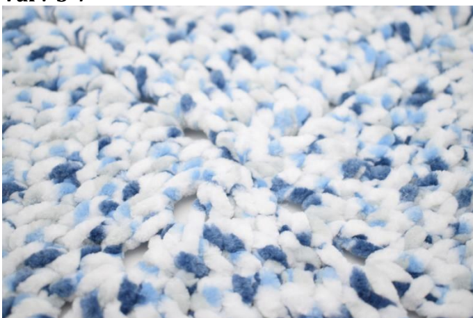
20. Upprepa varven på detta viset tills du har 7 varv totalt.