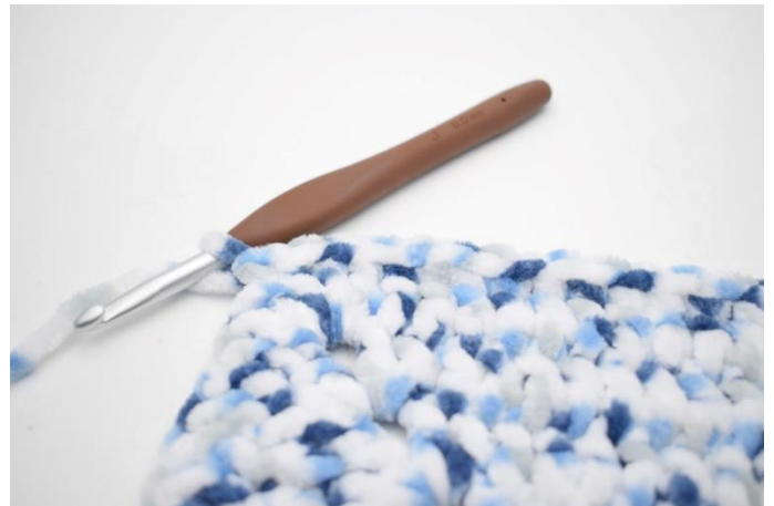
29. Virka 1 fm i de nästa 32 m.