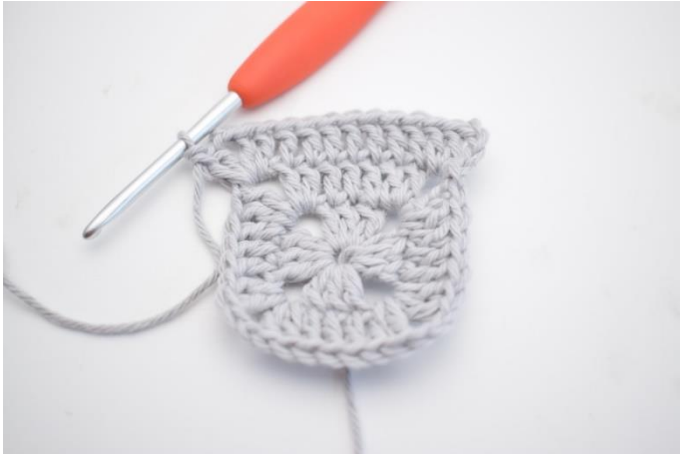
12. Virka "1 st i de nästa 7 m, 2 st, 2 lm och 2 st i nästa lm-båge".