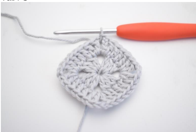
10. Virka 1 sm i lm-bågen.