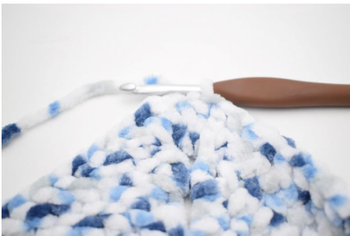
25. Upprepa "-" 3 gånger. Virka 1 st i de nästa 27 m och 1 st i lm-bågen från varvets början. Avsluta med 1 sm i 3:e lm.