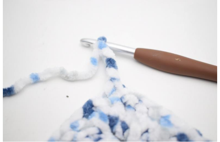
27. Virka 4 lm och Virka 1 fm i 2:e lm från nålen. Virka 1 fm i återstående 2 lm.