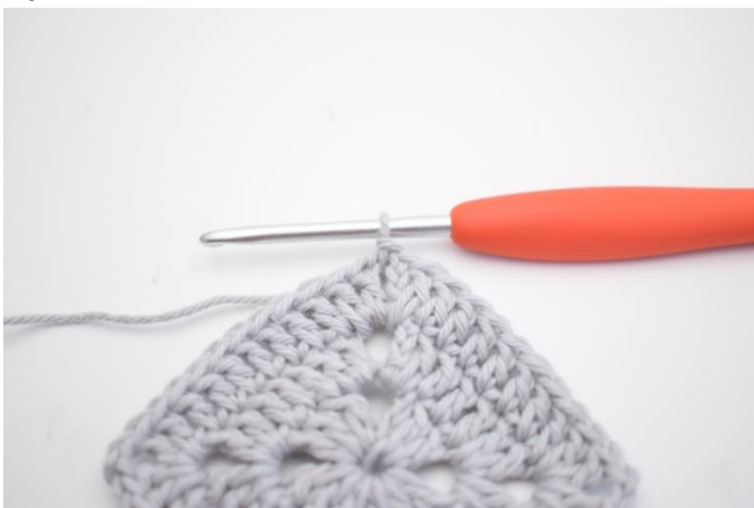
15. Virka 1 sm i lm-bågen.