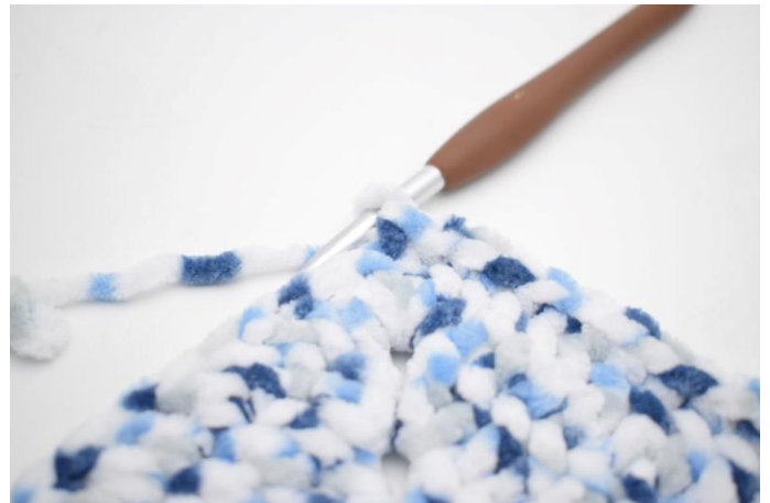
35. Virka 1 fm i de nästa 32 m.