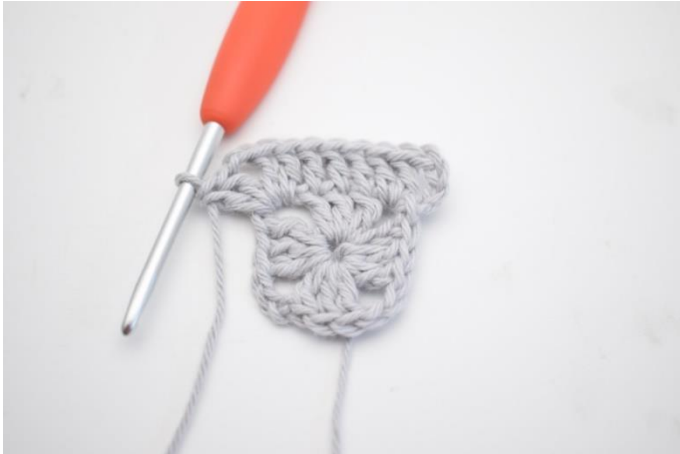
7. Virka "1 st i de nästa 3 m, 2 st, 2 lm och 2 st i nästa lm-båge".