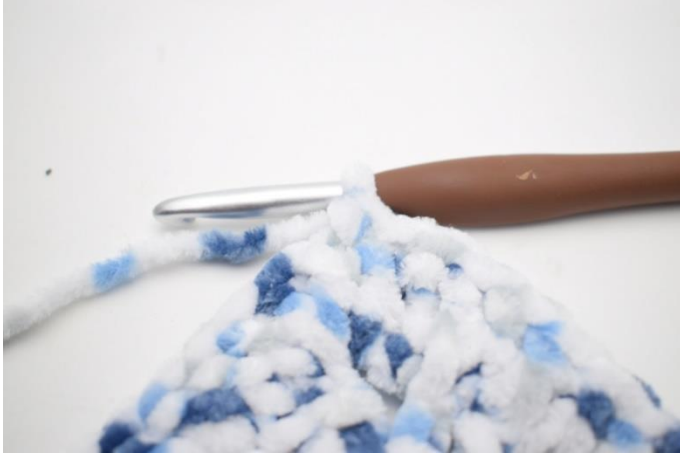
26. Virka 1 lm. Virka 1 fm i första m.