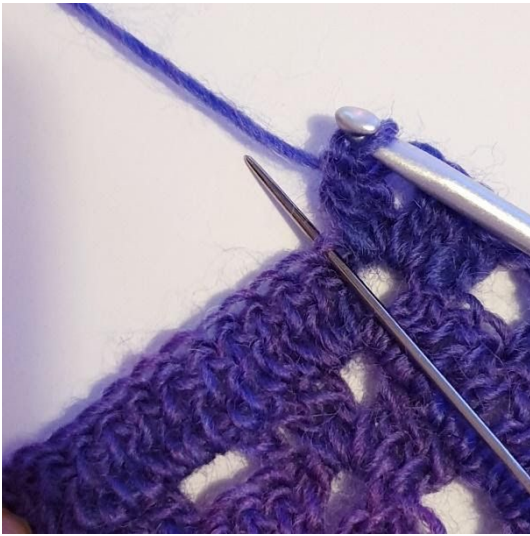
[2 st, 2 lm, 2 st] i toppen, 1 st i nästa m