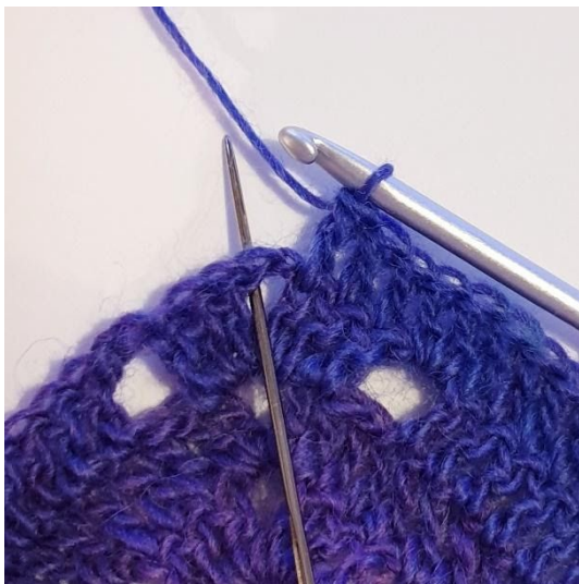
1 st i de nästa 3 st