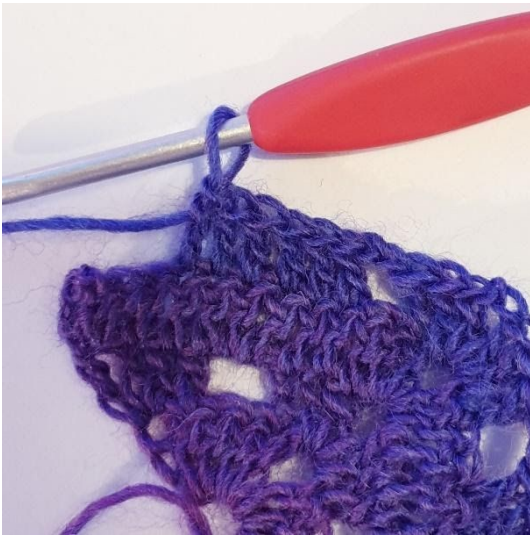
1 st i de nästa 6 m