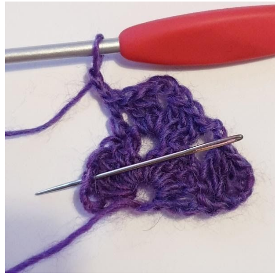
2 lm, hoppa över 2 m.