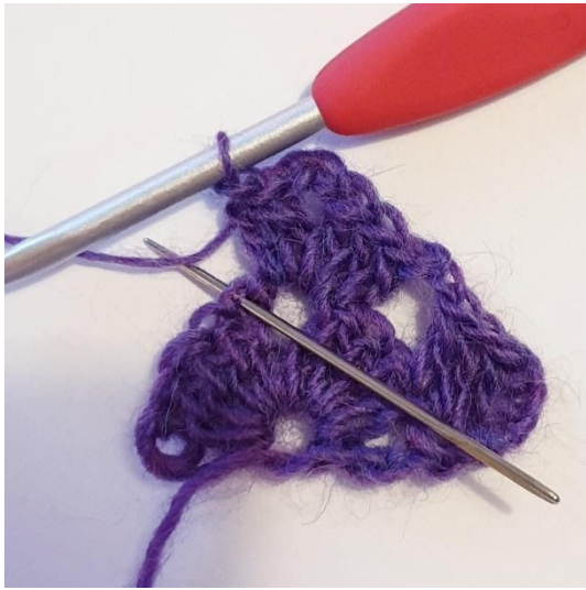
1 st i nästa m