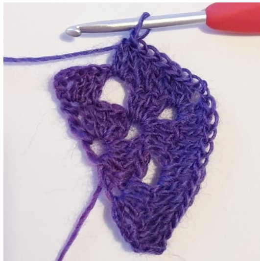
2 st i lm-hålet