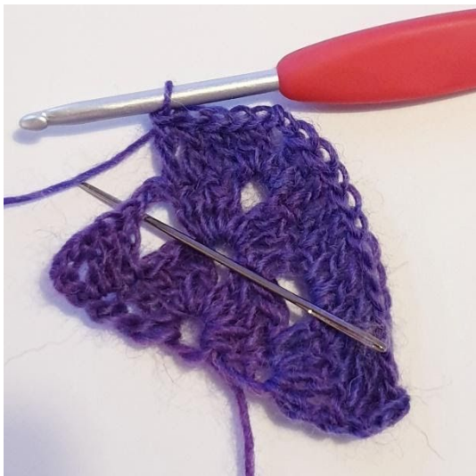
1 st i de nästa 3 m