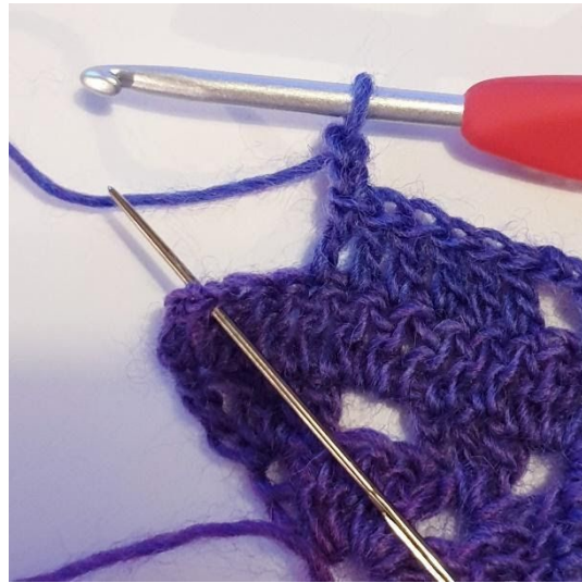
2 lm, hoppa över 2 m