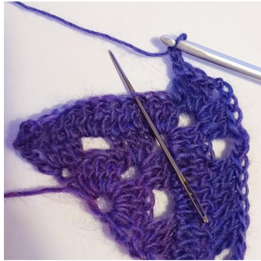
2 lm, hoppa över 2 m