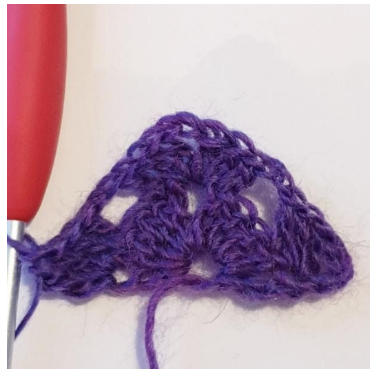
[2 st, 1 dst] i vändluftmaskan