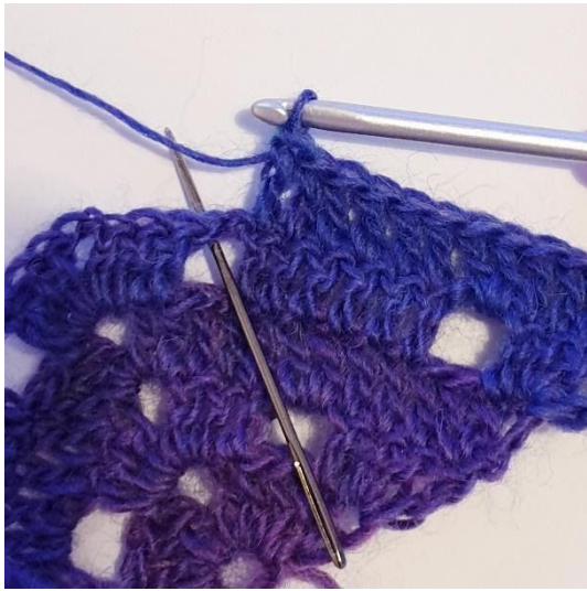
1 st i de nästa 6 m