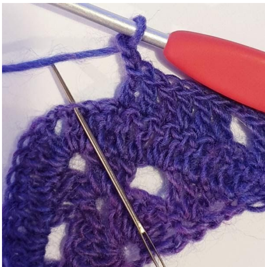
2 lm, hoppa över 2 m