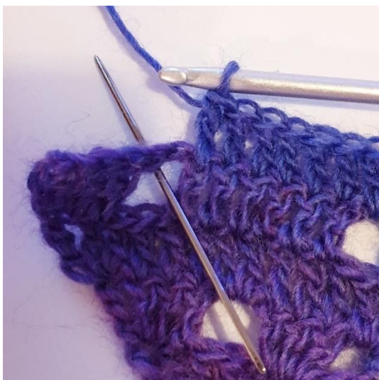
1 st i de nästa 6 m