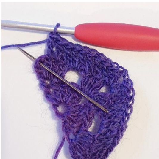
1 st i de nästa 3 m, [2 st, 1 dst] i vlm.