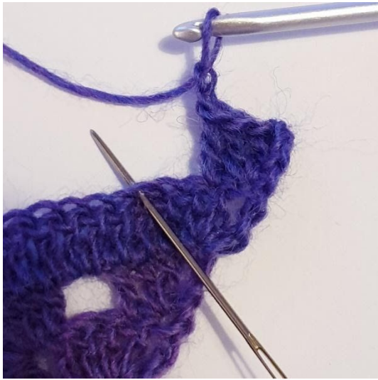
1 st, 2 lm, hoppa över 2 m