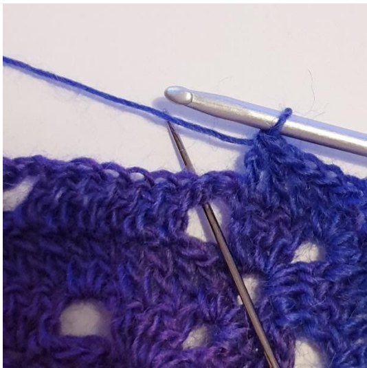
1 st i de nästa 3 m