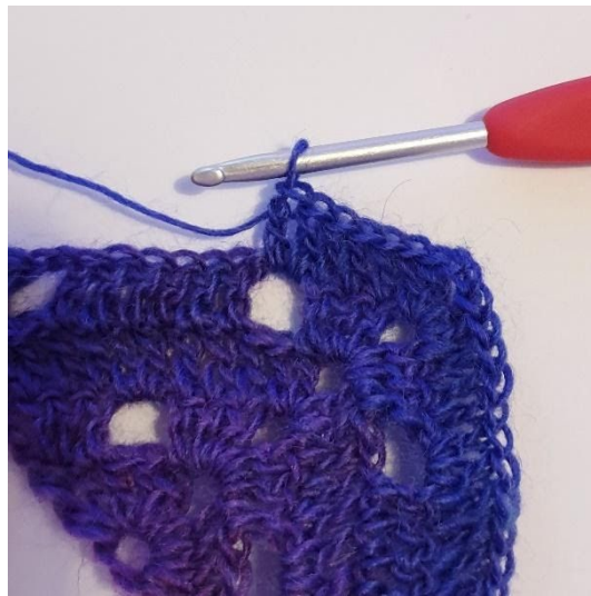
2 st i 1m-hålet