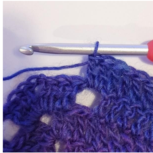
2 st i lm-hålet