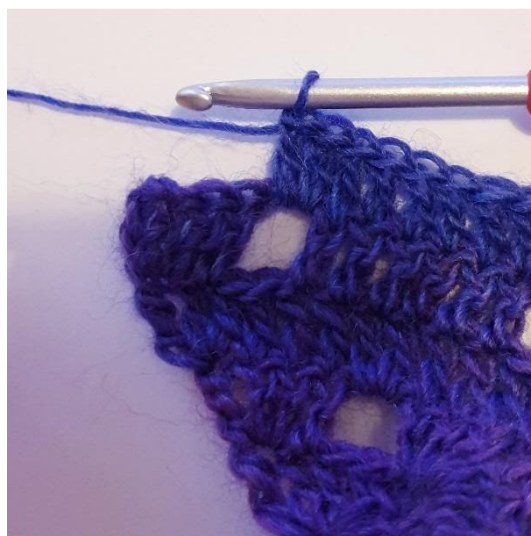
2 st i 1m-hålet