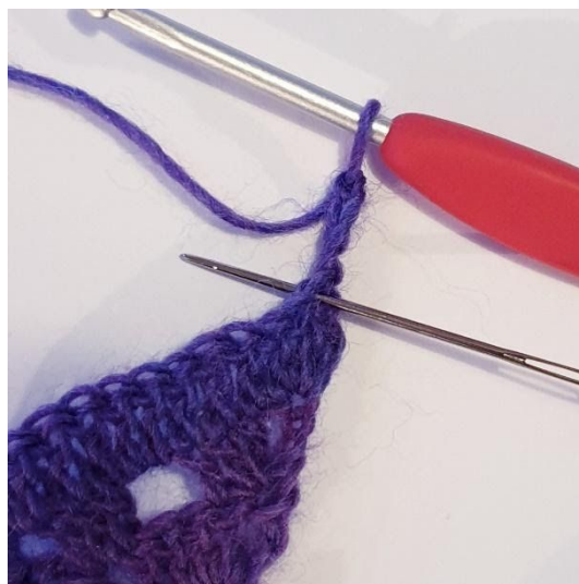
Varv 4: 2 st i första m