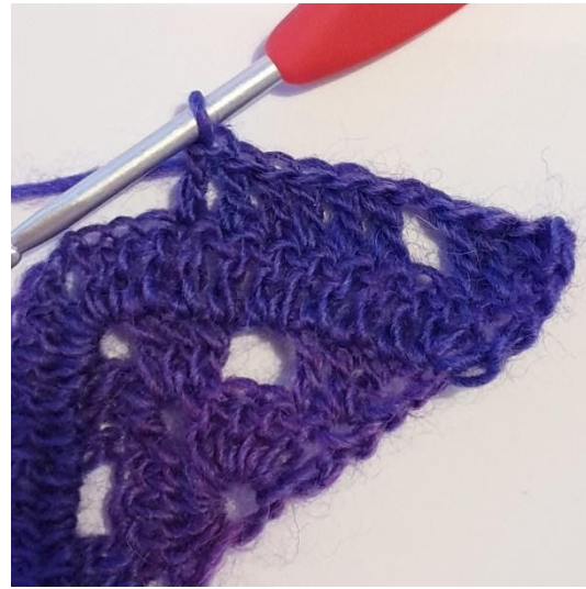
1 st i de nästa 6 m