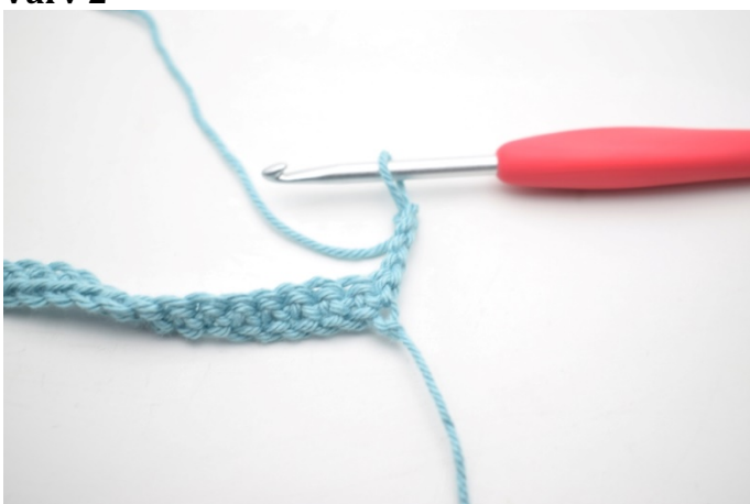
5. Vänd med 4 lm.