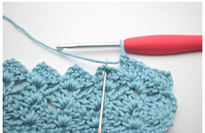
41. "Virka 1 fm i nästa lm-båge.