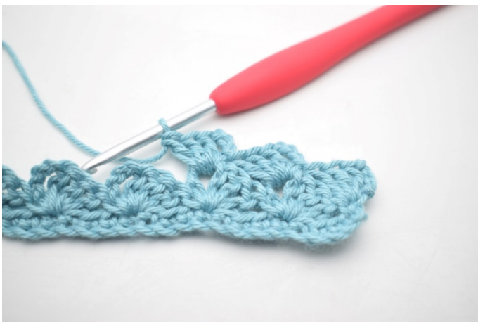
21. Sådär .