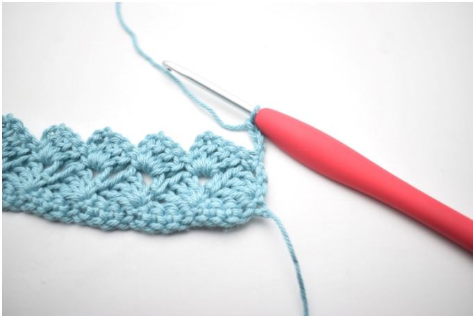
25. Virkas som varv 3. Vänd med 4 lm.