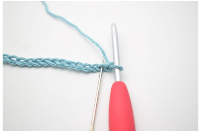
2. Virka 1 fm i 2:e lm från nålen.