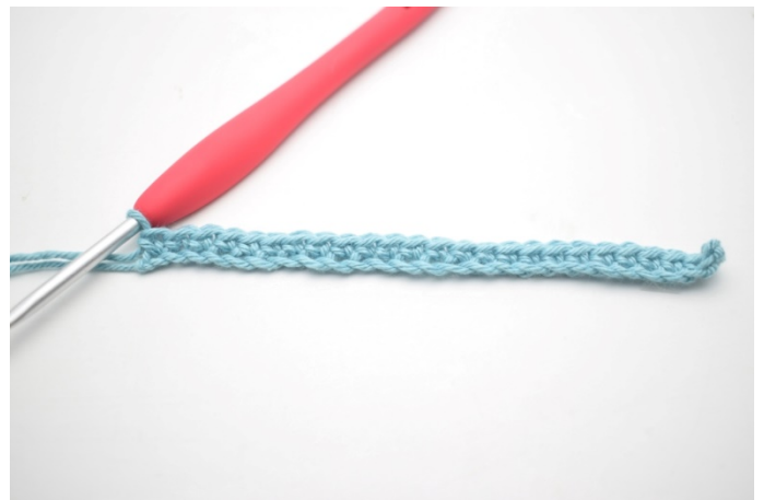
4. Virka fm i varje m varvet ut.