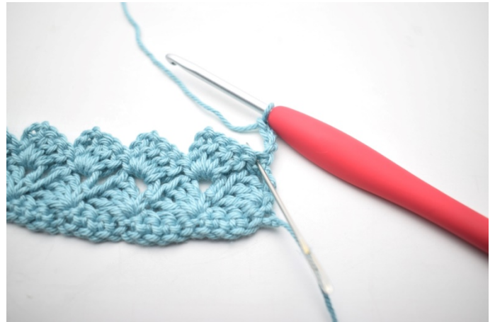
26. Virka 3 st i första m.