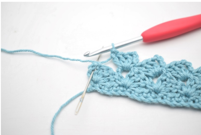
23. Virka 1 fm i sista lm-bågen.