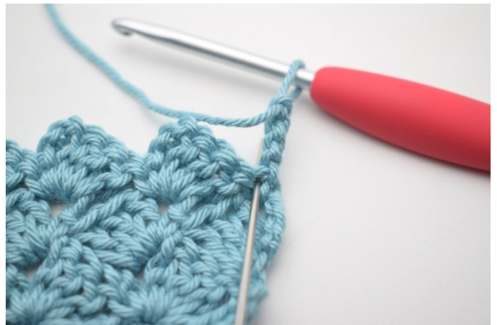
35. Virka 2 st i första m.