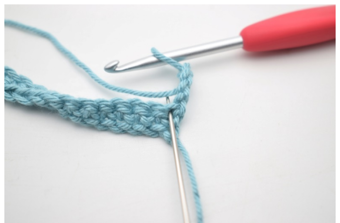
6. Virka 3 st i första m.