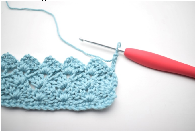
34. Vänd med 4 lm.