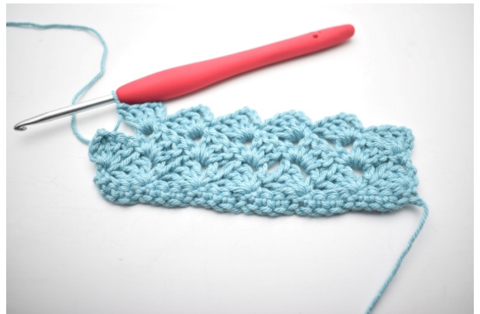
30. "Virka 1 fm, 3 lm och 3 st i nästa lm-båge". Upprepa "-" 13 gånger.