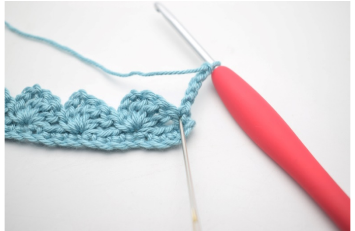
16. Virka 3 st i första m.