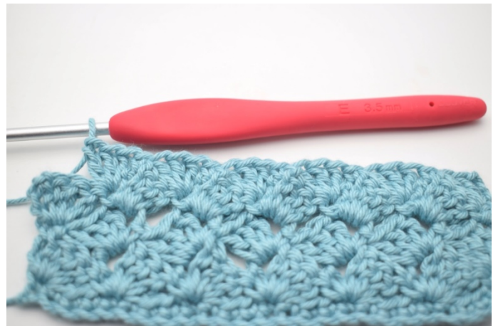
45. Upprepa ”-” 13 gånger.