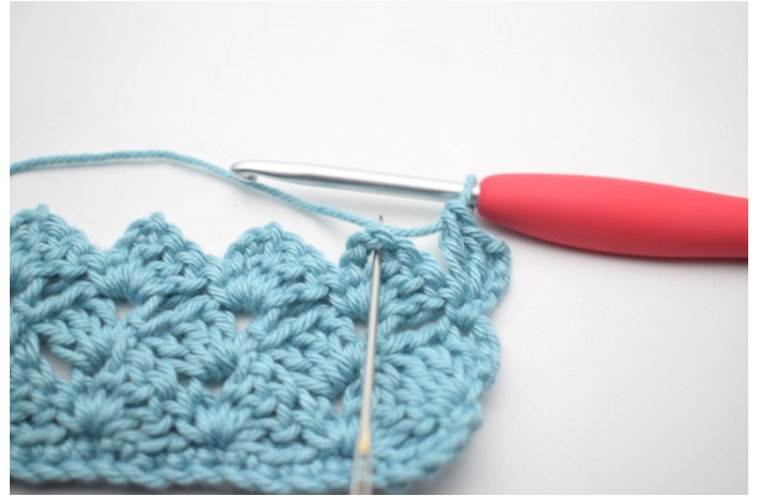
37. "Virka 1 fm i nästa lm-båge.