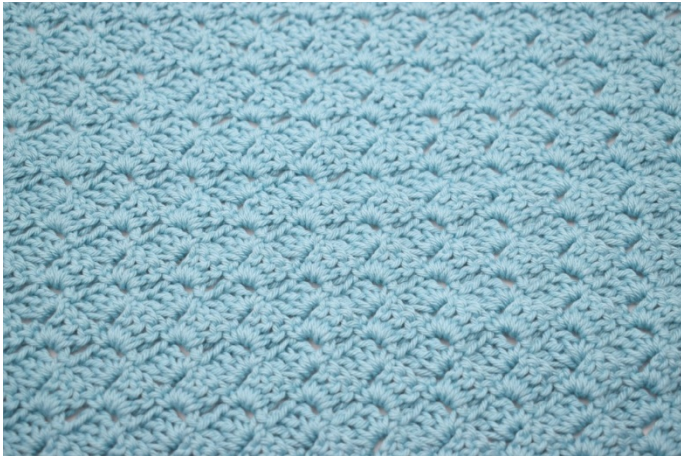
33. Upprepa varv 3 tills du har 24 varv totalt.