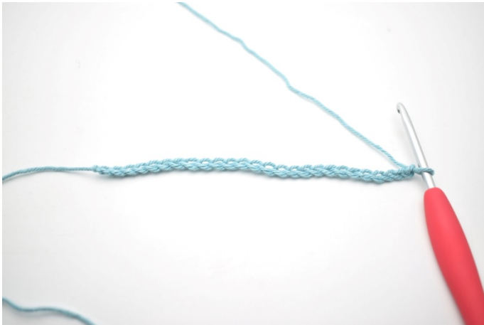
1. Lägg upp 58 lm.