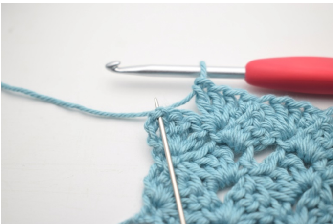
46. Virka 1 fm i sista lm-bågen.