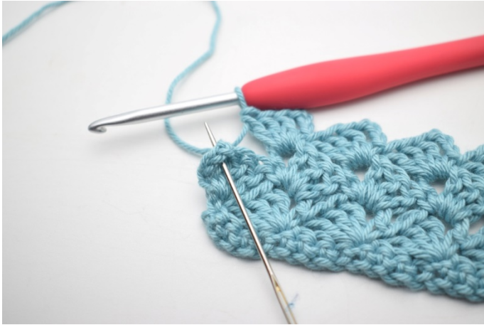
31. Virka 1 fm i sista lm-bågen.