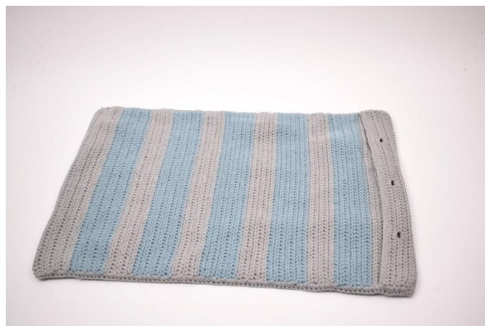
6. Upprepa på båda sidor. Klipp garnet och fäst.