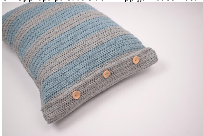
8. Stoppa ner kudden och knäpp knapparna.