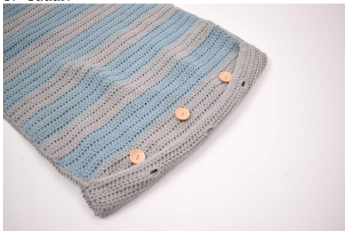
7. Sy fast de 3 knapparna så de passar med knapphålen.