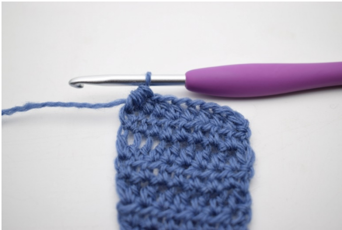
3. Virka de 2 sista hst tills. (69)