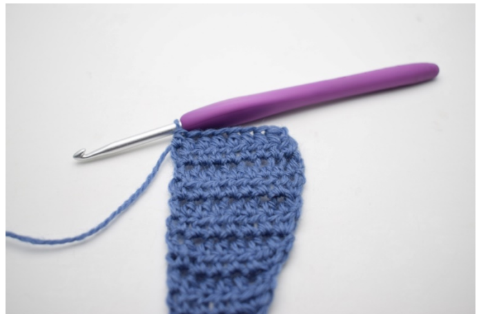
2. Virka 1 hst i varje m. (69)