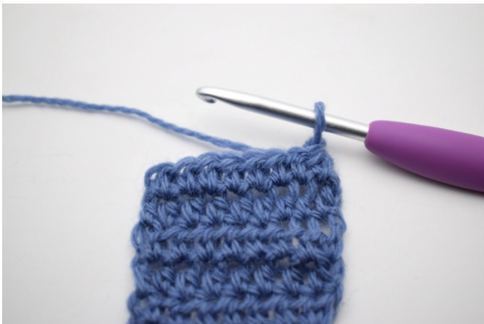
1. Vänd med 1 lm.