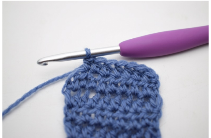
2. Virka 1 hst i de första 68 m.