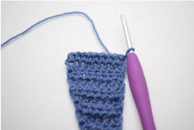
1. Vänd med 1 lm.