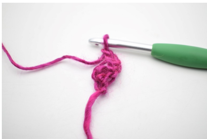
1. Vänd med 3 lm. (ersätter 1 st)