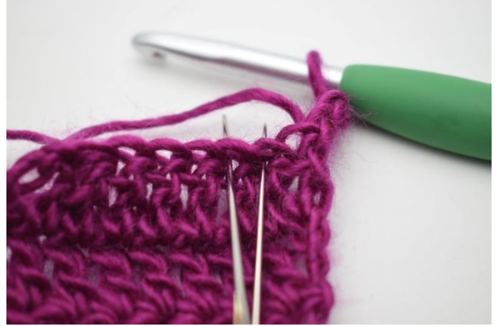
2. Minska: Virka 2:e och 3:e st tillsammans.