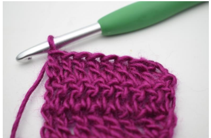
4. Virka st varvet ut.

86. Vänd med 3 lm. Virka 2 st tillsammans. Virka st varvet ut. (82)