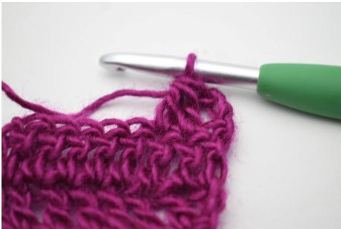
3. Så där.