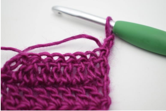
1. Vänd med 3 lm.