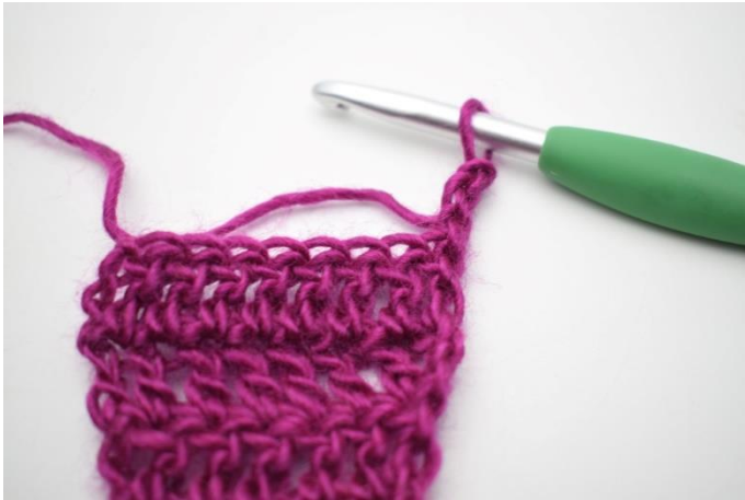
1. Vänd med 3 lm.

85. Vänd med 3 lm. Virka 2 st tillsammans. Virka st varvet ut. (83)