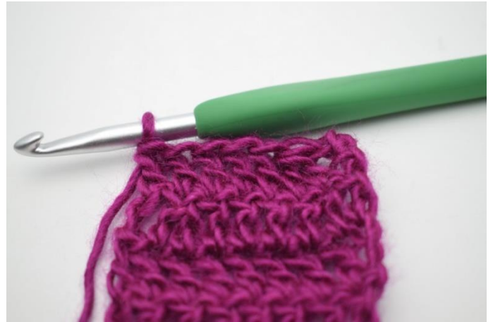
4. Virka st varvet ut.

87. - 165. Upprepa denna metod: " Vänd med 3 lm. Virka 2 st tillsammans. Virka st varvet ut." till du har 165 varv. (2) Klipp garnet och fäst.