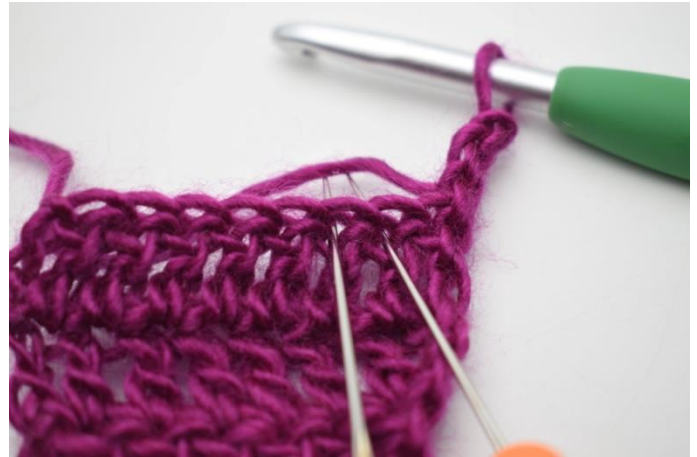
2. Minska: Virka 2:e och 3: st tillsammans