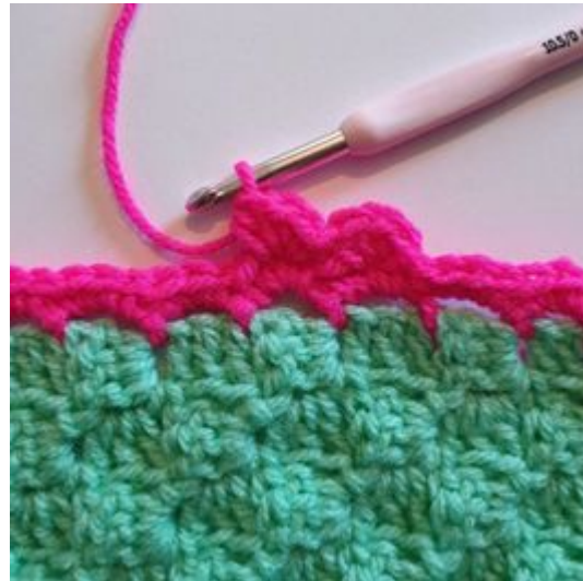
4. Hoppa över 1 m och gör 1 sm i mellanrummet från förra varvet.