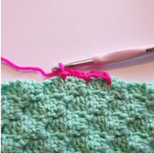
5. Gör 1 sm mellan de nästa 2 pixlarna.