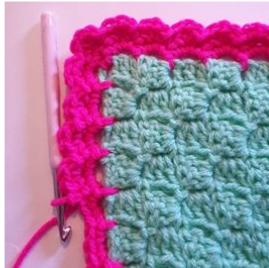
8. Fortsätt varvet runt.