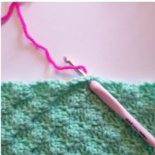
1. Du kan börja vart du vill på filten.