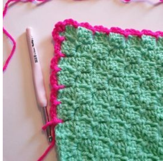
10. Försätt virka enligt tidigare instruktioner runt om filten.