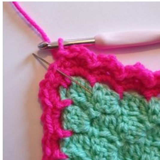
6. När du kommer till hörnet virkar du på samma sätt. Alltså *3 hst i samma m, hoppa över 1 m, 1 sm*