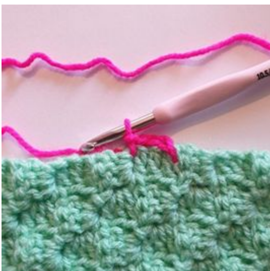
3. Gör 1 sm mellan de nästa 2 pixlarna.