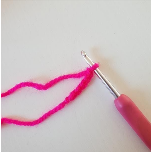
1. Börja med att göra 5 luftmaskor