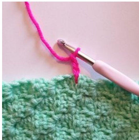
2. Gör 3 lm.