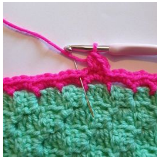
2. Hoppa över 1 m och virka 1 sm i mellanrummet från förra varvet.