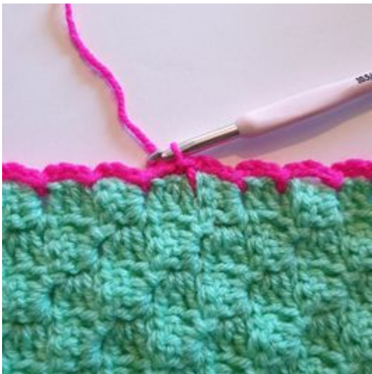
11. Avsluta varvet med en sm där varvet började.