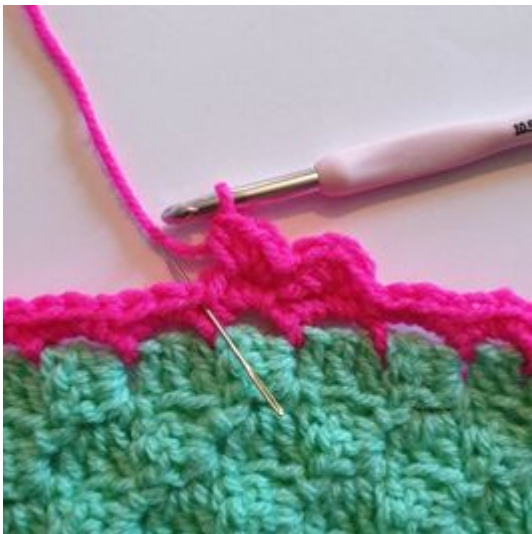
5. Försätt att virka 3 hst i samma m i mitten av det föregående m på förra varvet och virka 1 sm i mellanrummet. *3 hst i samma m, hoppa över 1 m, 1 sm*