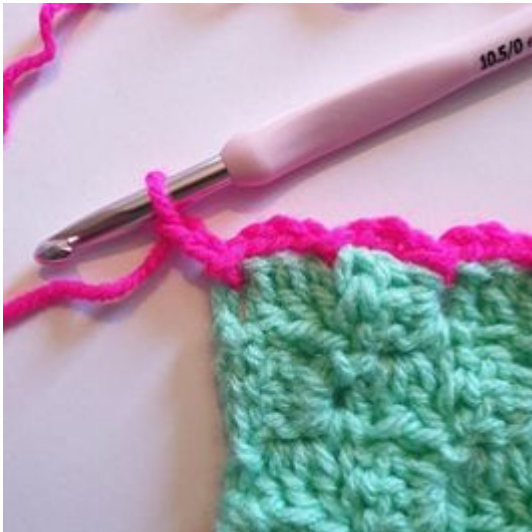
7. Gör 2 lm.