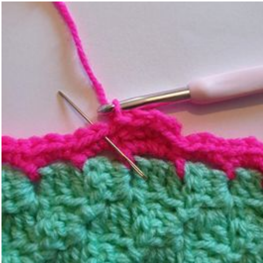
3. Gör 3 hst i nästa m.