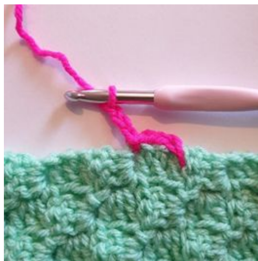
4. Gör 3 lm.