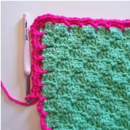
5. Försätt med 3 fm i varje 1m-båge hela varvet.