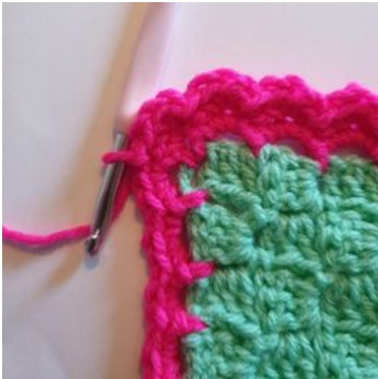
7. Fortsätt virka runt hörnet. *3 hst i samma m, hoppa över 1 m, 1 sm*