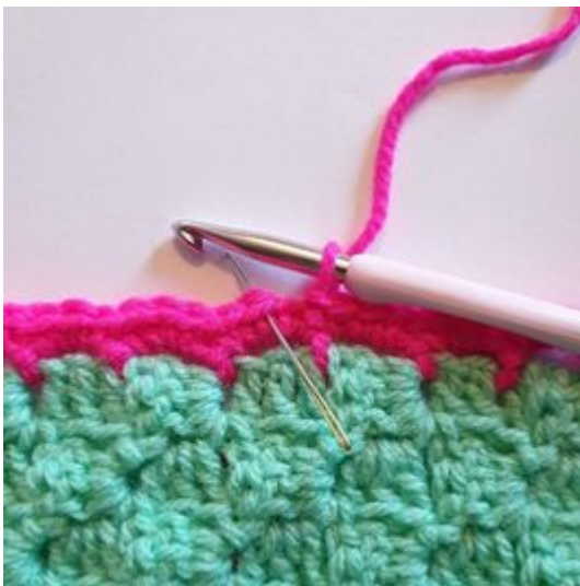
1. Nu ska du virka 3 hst i nästa fm. Alltså 3 hst i samma maska.