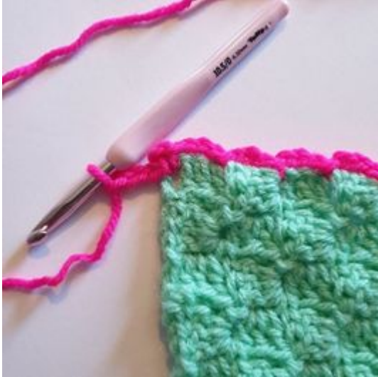
9. Gör 3 lm.