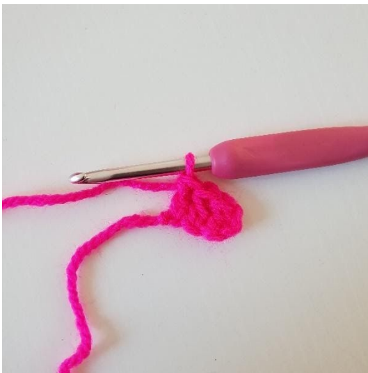
3. Gör stolpar i de nästa 2 luftmaskorna. Du har nu gjort din första pixel.