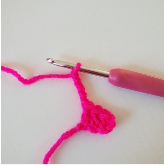
1. Gör 5 luftmaskor