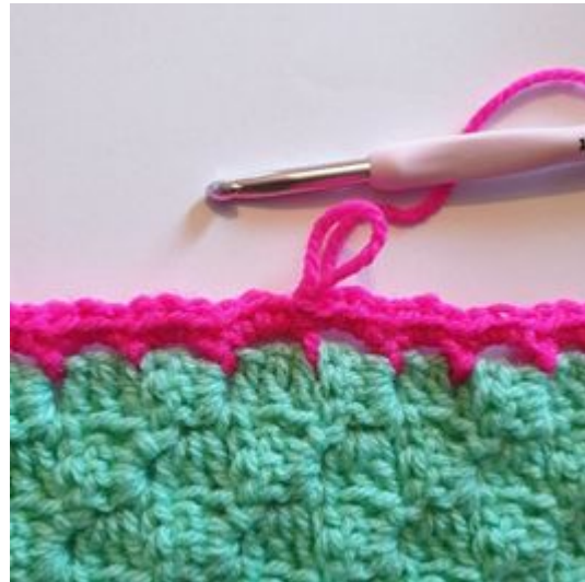
6. Avsluta varvet med 1 sm