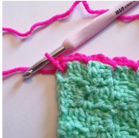
8. Virka 1 sm igen i hörnet.