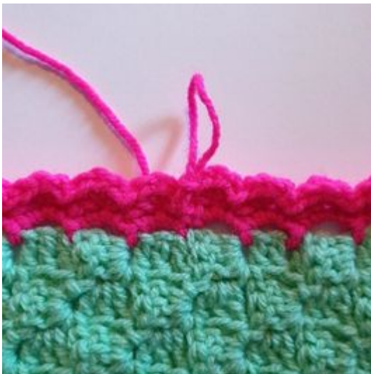
9. Avsluta med 1 sm.