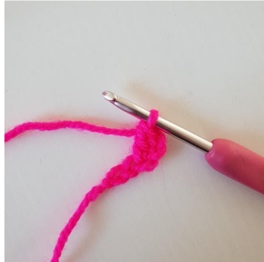
2. I tredje luftmaskan virkar du 1 stolpe