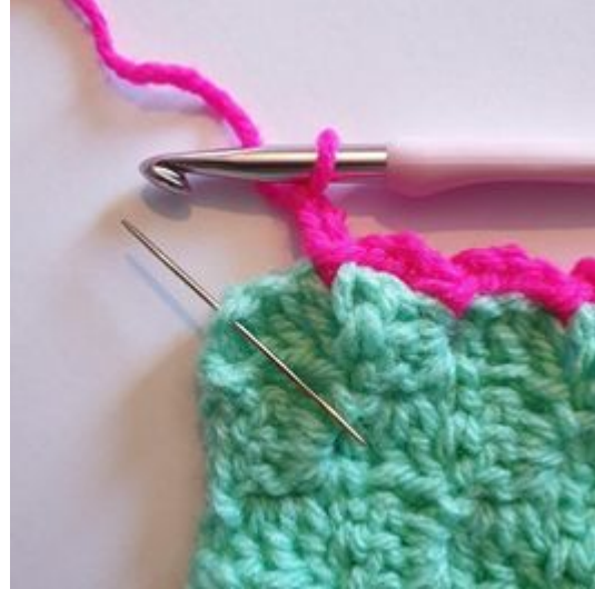
6. När du kommit till hörnet gör du 1 sm i hörnet.