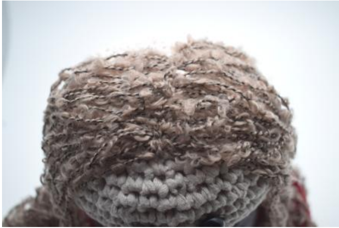
Sy några stygn på mitten av håret.