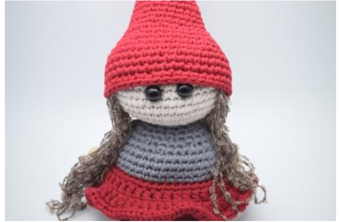
Sätt på luvan och sy fast den runt huvudet.