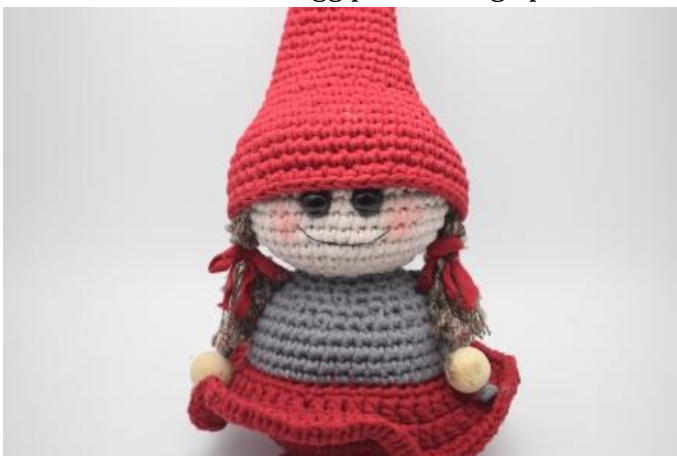
Brodera en mun och lägg på lite rouge på kinderna.