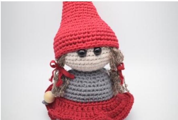
Gör ev. hästsvansar och rätt till med en sax.