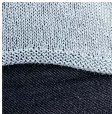
Midja - kant