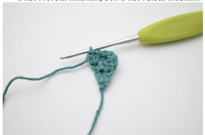
6. Virka 1 hst i de följande 2 m, och 2 hst i sista maskan.