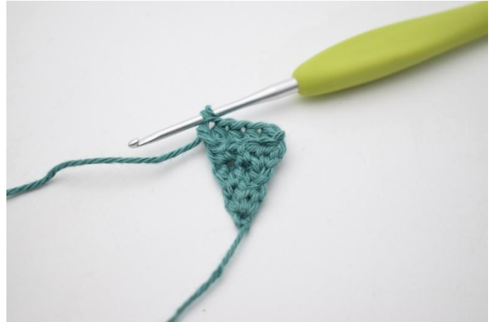
8. Virka 1 hst i de följande 3 m, och 2 hst i sista maskan.