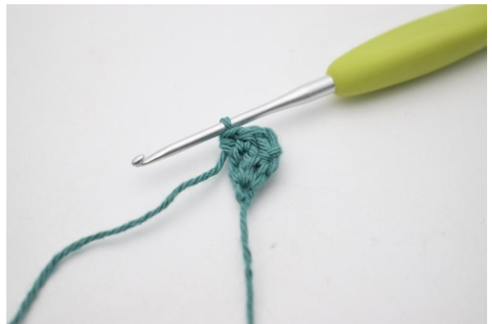
4. Nu virkas alla rader i bakre maskbågen. Virka 1 hst i första maskan, och 2 hst i sista maskan.