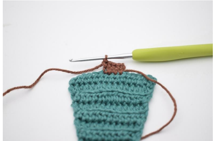
14. Virka 1 fm i de 4 m.