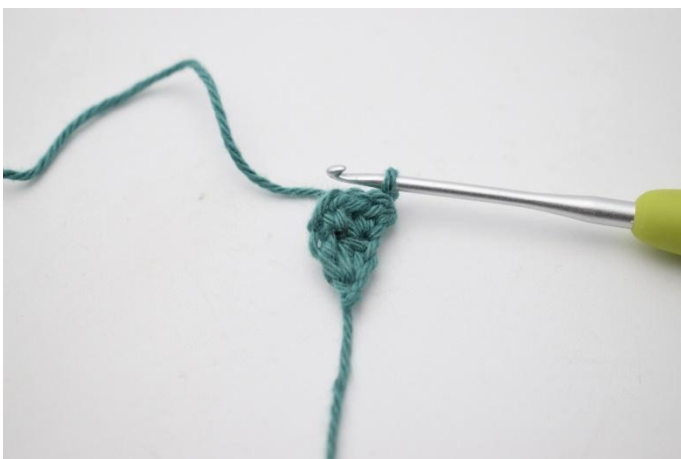
5. Vänd med 1 lm.