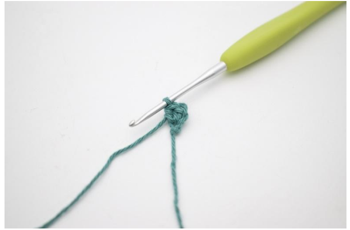
2. Virka 2 hst i 2.a lm.