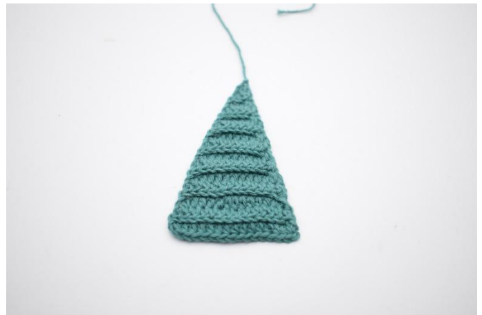
10. Klipp garnet och fäst tråden.