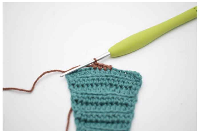
12. Virka 4 fm med den nya färgen .