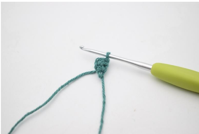
3. Vänd med 1 lm.