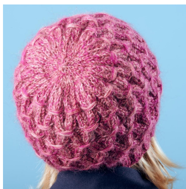
Minskningar i toppen