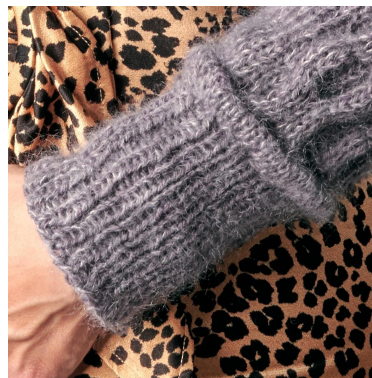
Veck och resår