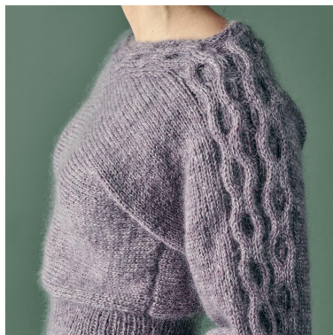
Flätvridning på ärm