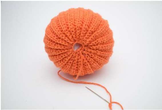
19. Klipp garnet och sy igen hålet helt.