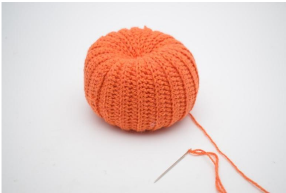
22. Dra åt lite lätt och fäst tråden.