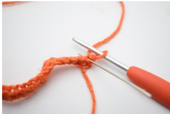
2. Från och med nu virkas endast i bmb.