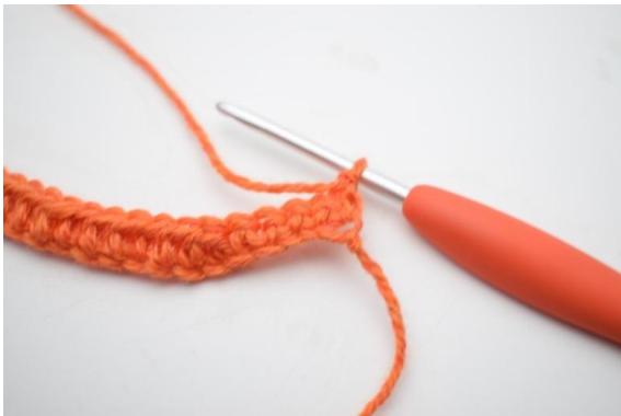
1. Vänd med 1 lm.