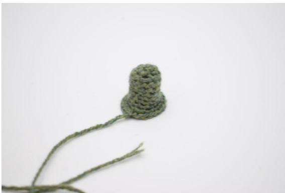
23. Sy fast stjälken.