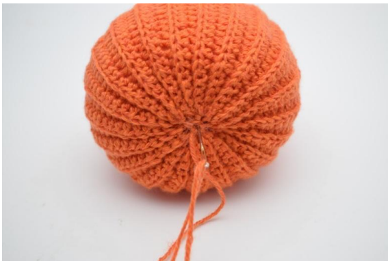
21. Dra upp garnet genom pumpan och tillbaka igen