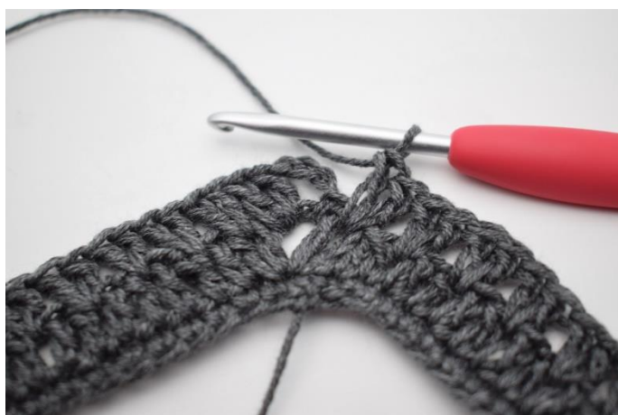
13. Virka "2 st mellan nästa 2 st, hoppa 1 m". Upprepa "-" 34 gånger totalt.