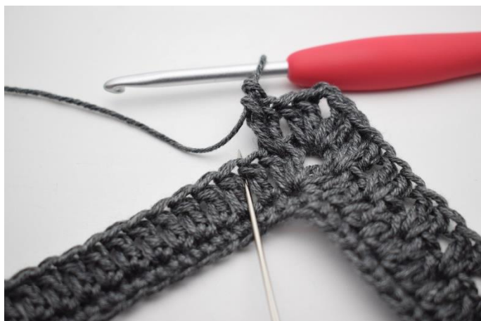
11. Hoppa 1 m och virka 2 st mellan nästa 2 st.