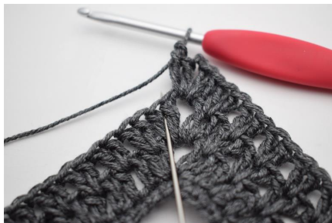
6. Virka 2 st mellan första 2 st.