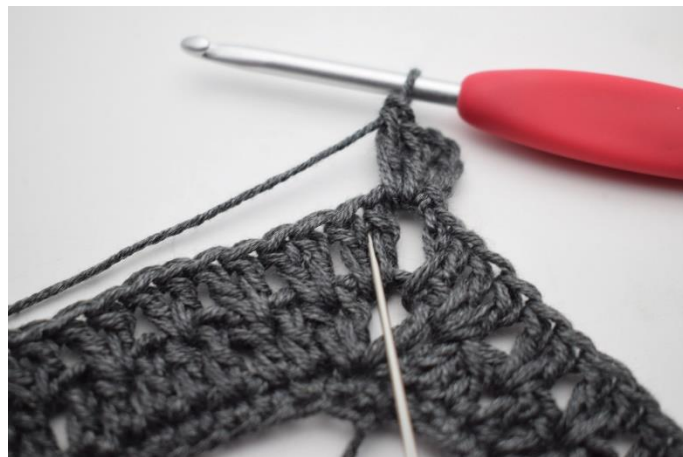
2. Virka 2 st mellan första 2 st.