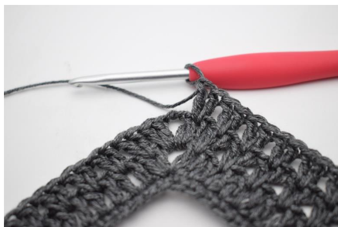
4. Virka "2 st mellan nästa 2 st, hoppa 1 m". Upprepa "-" 36 gånger totalt.