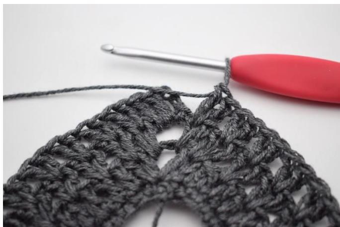
8. Virka "2 st mellan nästa 2 st, hoppa 1 m". Upprepa "-" 36 gånger totalt.