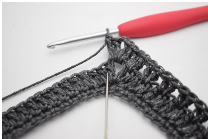
9. Virka 2 st mellan första 2 st. Nålen på bilden markerar var dina st ska virkas.