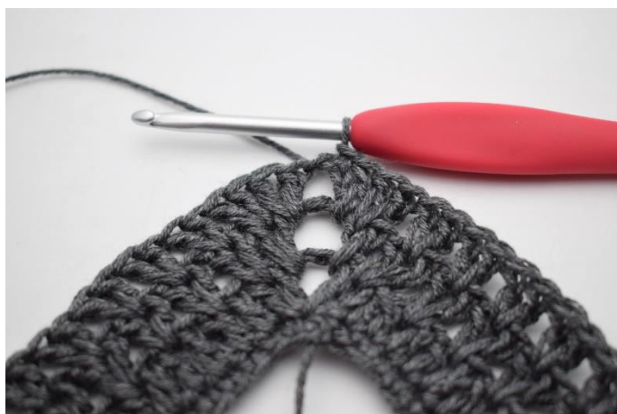
11. Avsluta med 1 sm.