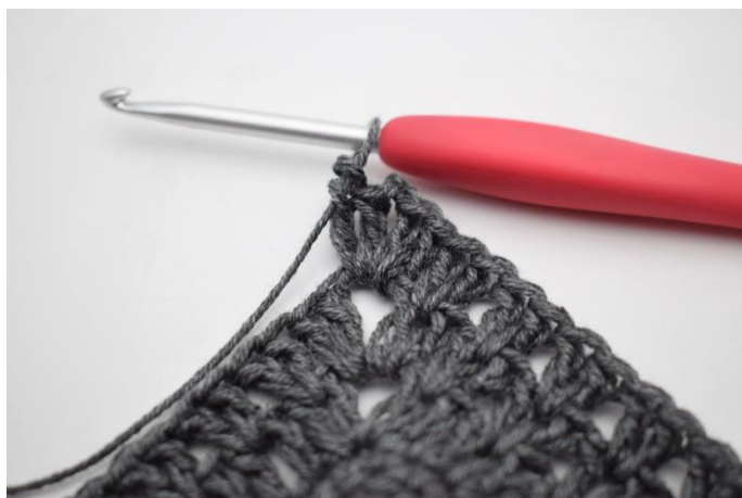
5. Virka 2 st, 2 lm, 2 st i lm-bågen.