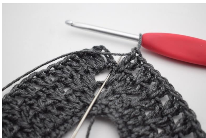
9. Virka 1 st i lm-bågen från varvets början.