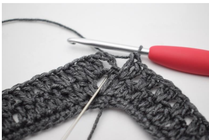
14. Virka 1 st i lm-bågen från varvets början.