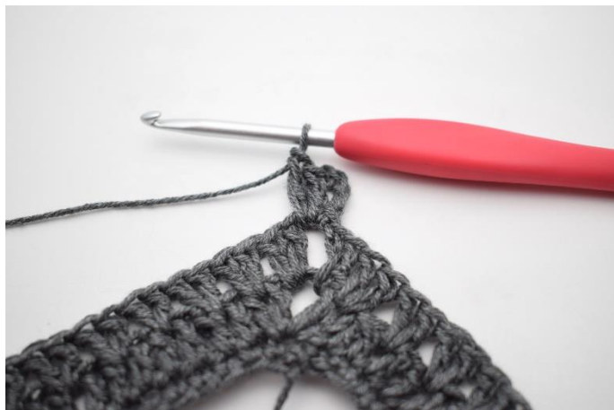
1. Virka sm fram till lm-bågen. Virka 5 lm och virka 2 st i lm-bågen.