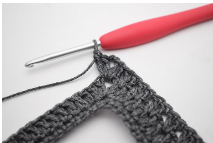
8. Virka 2 st, 2 lm, 2 st i lm-bågen.