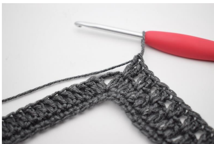
7. Virka "2 st mellan nästa 2 st, hoppa 1 m". Upprepa "-" 34 gånger totalt.