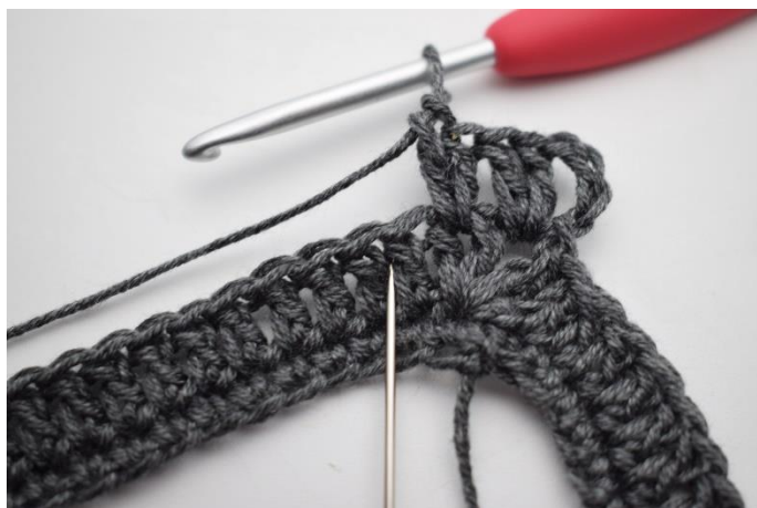
5. Hoppa 1 m och virka 2 st mellan nästa 2 st.