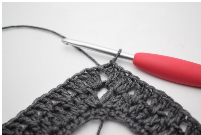
16. Avsluta med 1 sm.