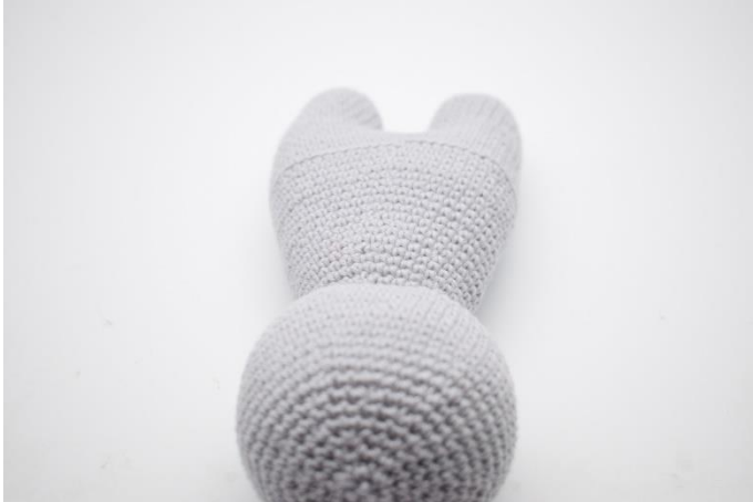
1. Placera kaninens huvud in mot dig själv.