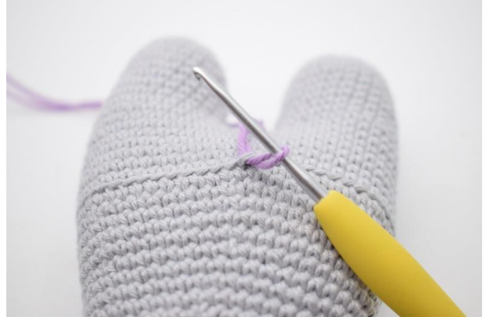
2. Fäst tråden i en av maskbågarna på kroppen där du endast virkade i bmb