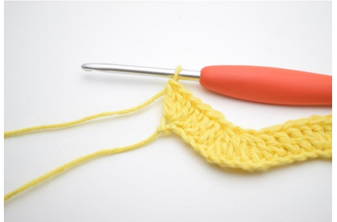
14. I sista lm, virka 3 st.