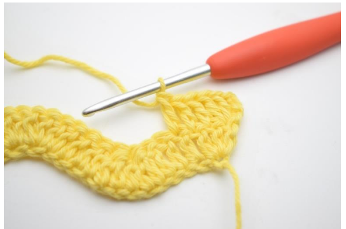
4. Virka 1 st i nästa 3 m.