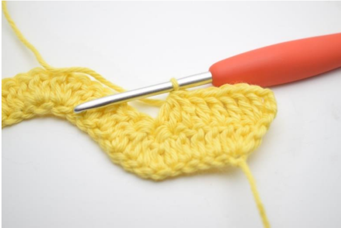
5. Virka 3 st tills över nästa 3 m.