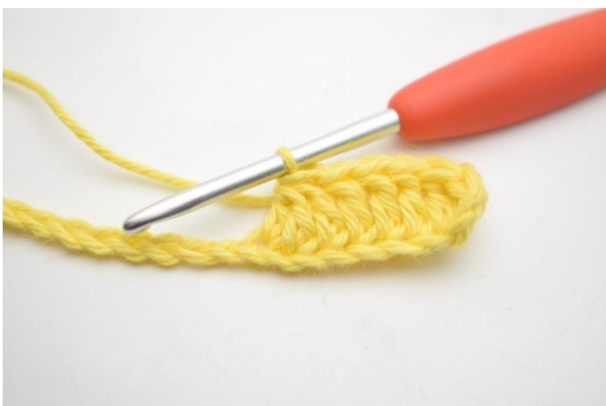
5. Virka 3 st tills över de nästa 3 lm. (Det betyder at du ska virka ihop 3 st till 1)