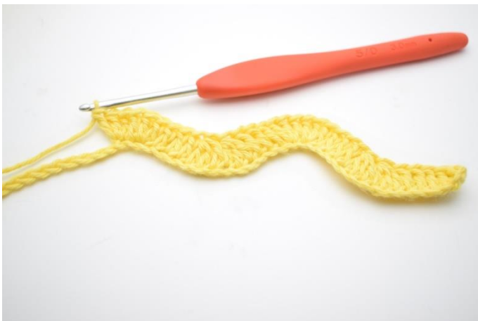
11. Virka 1 st i nästa 3 lm. Virka 3 st i nästa 2 lm.