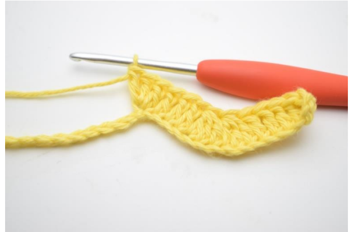
8. Virka 3 st i nästa lm.