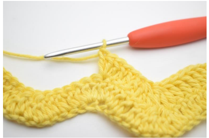
8. Virka 3 st i nästa m.