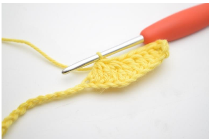
6. Upprepa och virka 3 st tills över nästa 3 lm.