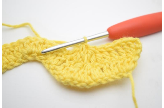
6. Upprepa och virka 3 st tills över de nästa 3 m.