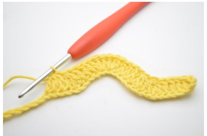
10. Virka 1 st i nästa 3 lm. "Virka 3 st tills över nästa 3 lm". Upprepa "-" 2 gånger totalt.