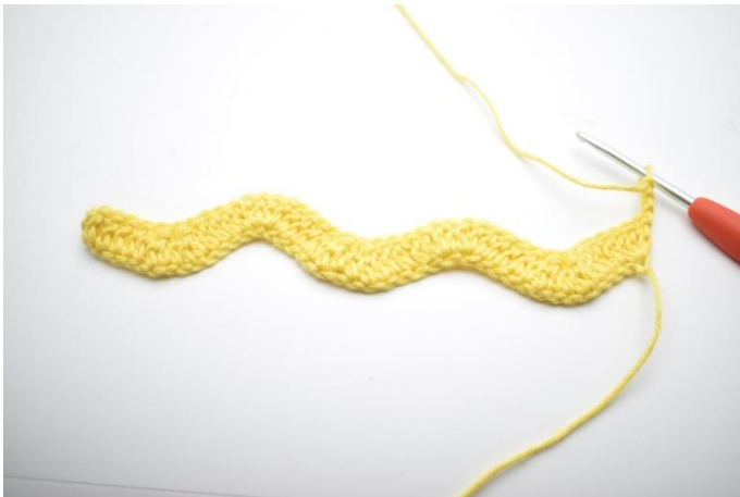
1. Vänd med 3 lm.