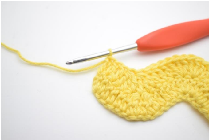
13. Virka 1 st i nästa 3 m.