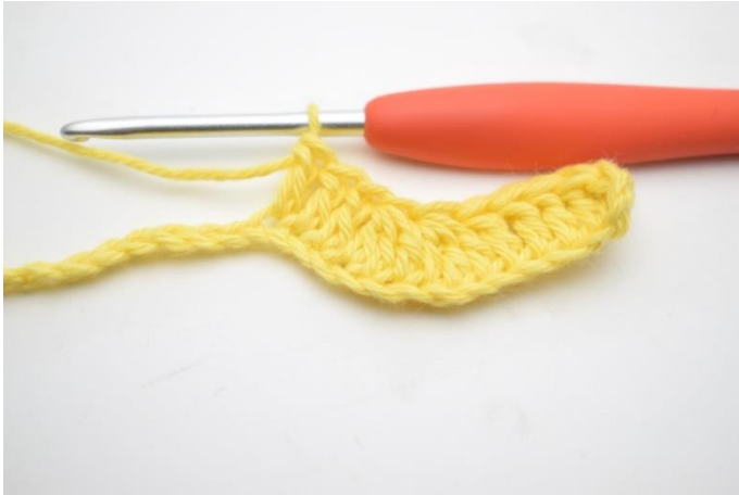
7. Virka 1 st i nästa 3 lm.