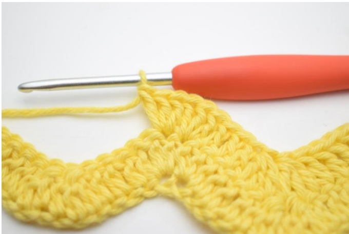
9. Upprepa och virka 3 st i nästa m.