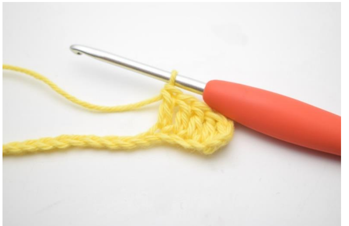
4. Virka 1 st i nästa 3 lm.