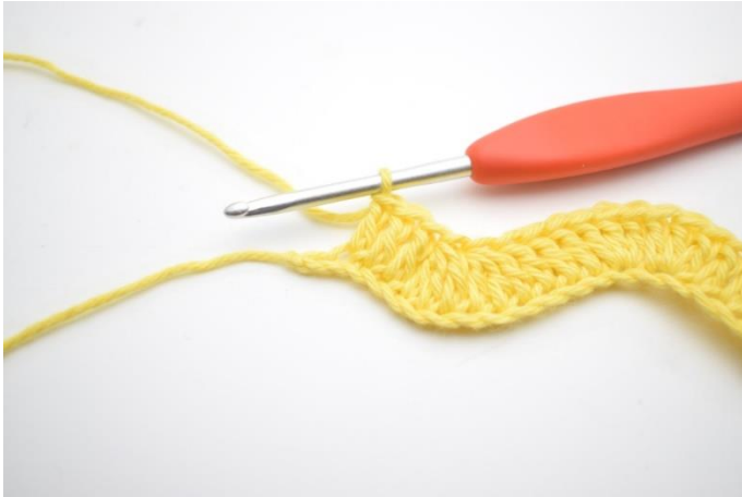
13. Virka 1 st i nästa 3 lm.