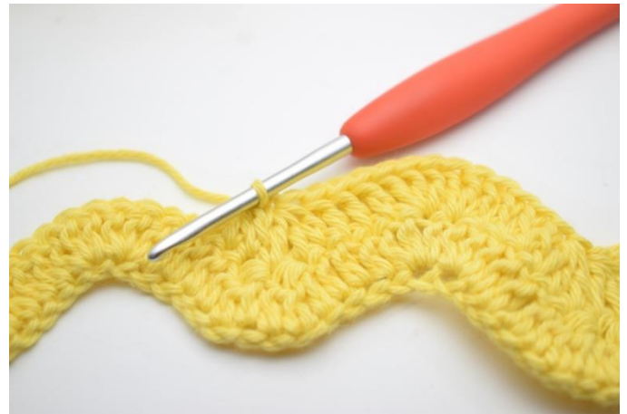
10. Virka 1 st i nästa 3 m. "Virka 3 st tills över de nästa 3 m". Upprepa "-" 2 gånger totalt.