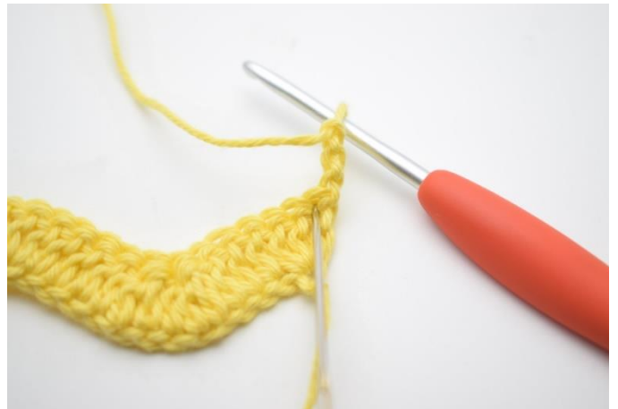
2. Virka 2 st i första m.