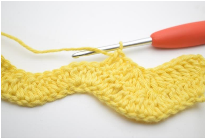
7. Virka 1 st i nästa 3 m.