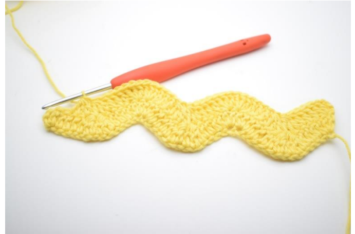
12. Sådär. Upprepa varvet ut tills det återstår 4 lm.