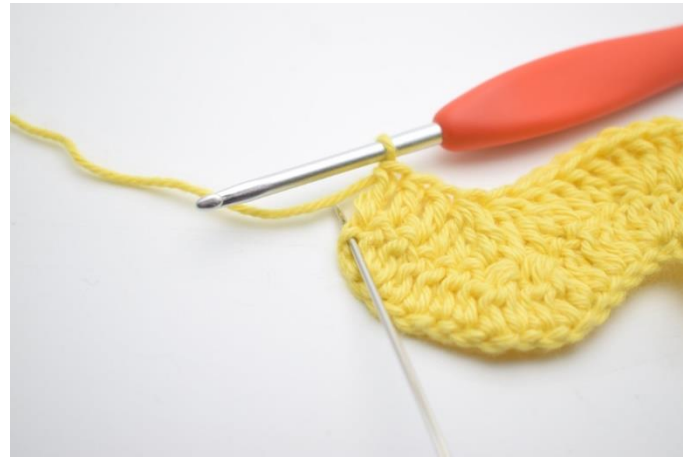
14. I sista m, virka 3 st.