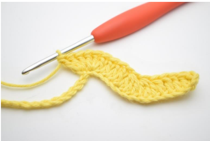
9. Upprepa och virka 3 st i nästa lm.