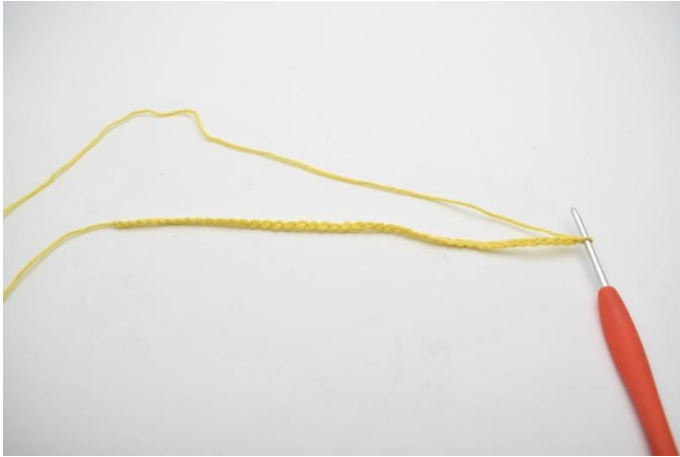
1. Lägg upp 58 lm.