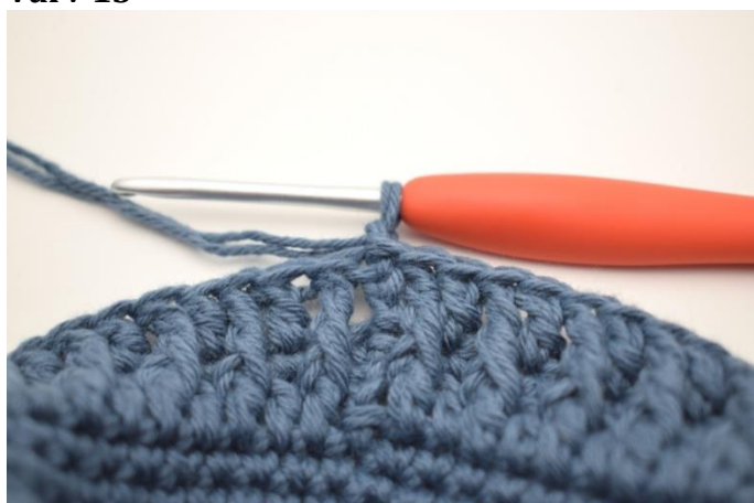
1. Virka 1 lm.