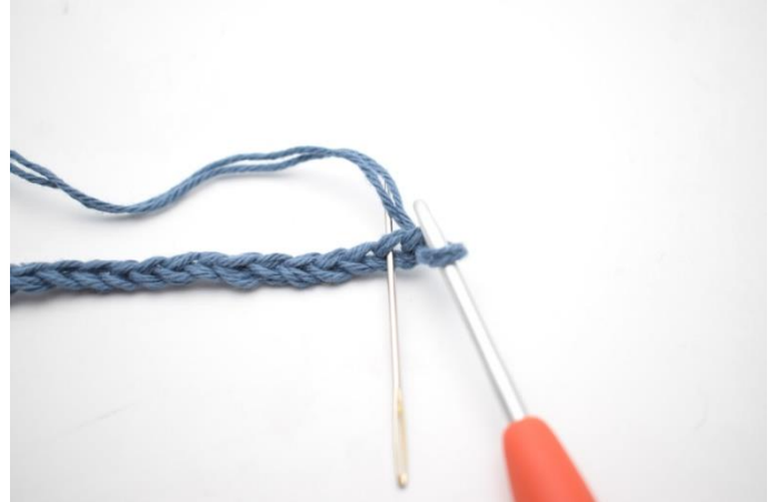
2. I 2:e lm från nålen, virka 1 fm.