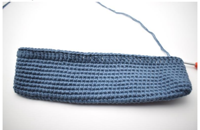
1. Virka 3 lm (ersätter 1:e st). Virka st i varje maska varvet runt. Avsluta med 1 sm. (92)