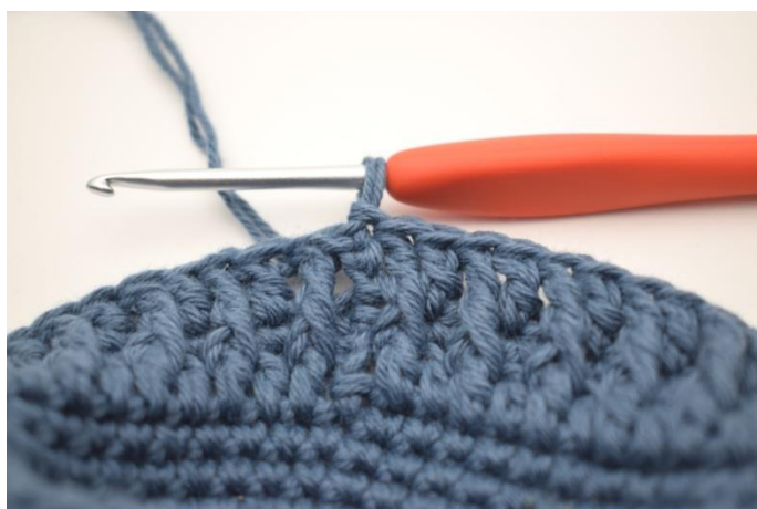
8. Upprepa "-" varvet runt. Avsluta med 1 sm i 3:e lm från varvets början. (92)