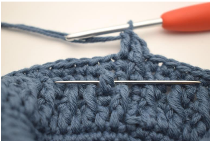
5. Virka 1 redst fr runt nästa stolpe.