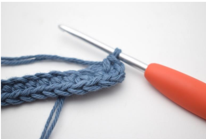
5. I sista m, virka 4 fm.