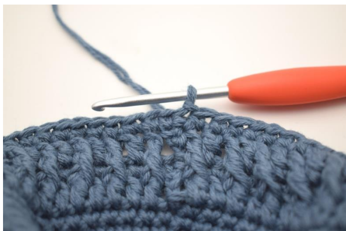
2. Virka fm i varje maska varvet runt och avsluta med 1 sm. (92)