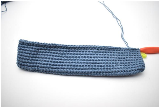
1. Upprepa varv 2 tills du har 9 fm varv totalt. Sista varv avslutas med 1 sm.