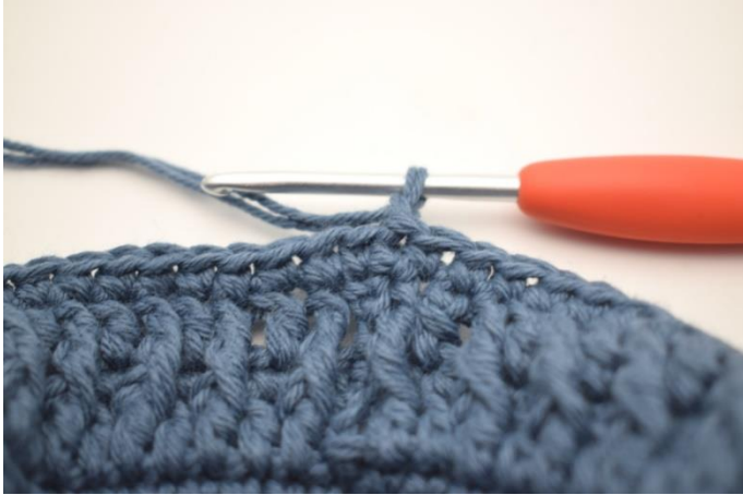
1. Virka 1 lm.