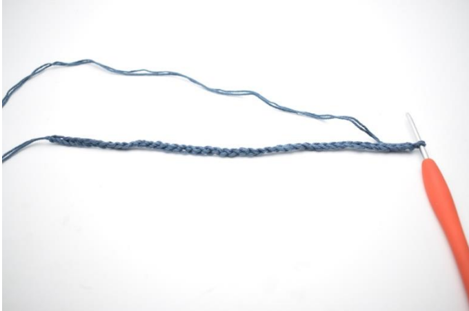
1. Lägg upp 44 lm.