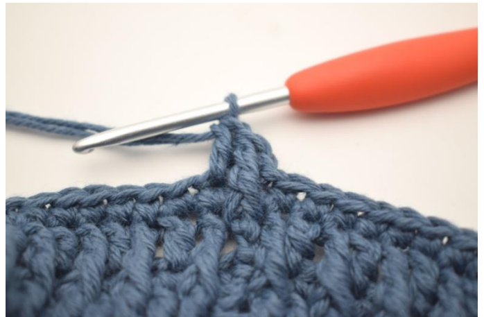
4. Virka 1 st i nästa m.