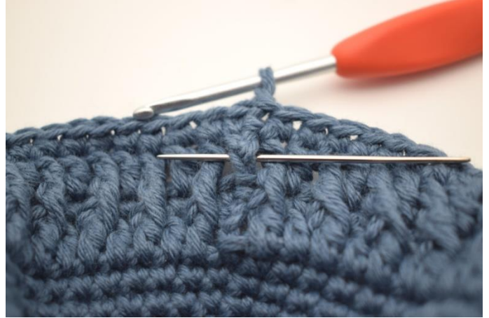
2. Virka 1 redst fr runt första stolpe.