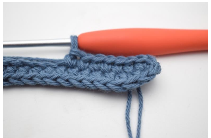
6. Virka nu på motsatta sida av din lm-rad. Virka 1 fm i nästa 42 lm.