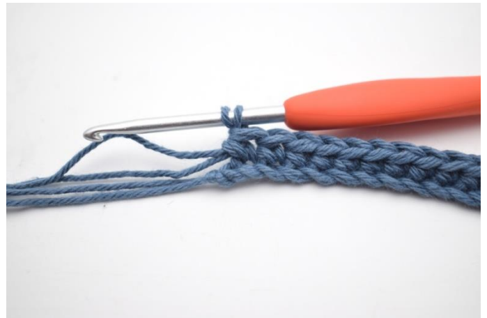
4. Virka 1 fm i nästa 41 m.