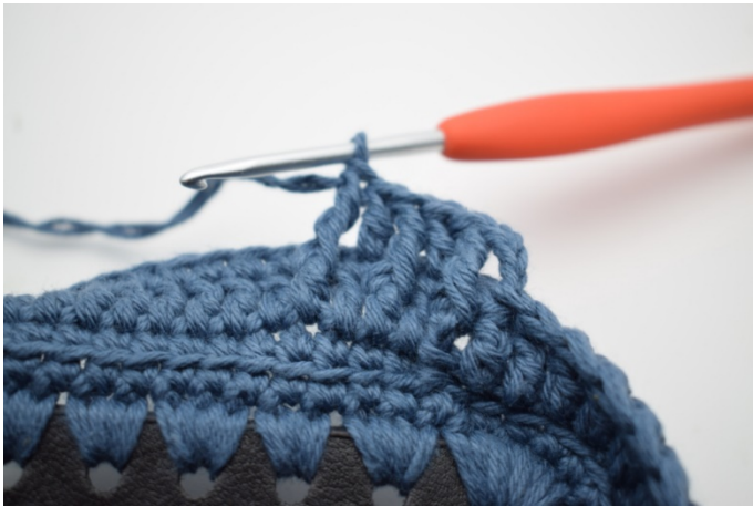
7. "Virka 1 st i nästa maska, 1 reldst fr runt nästa st från föregående varv."