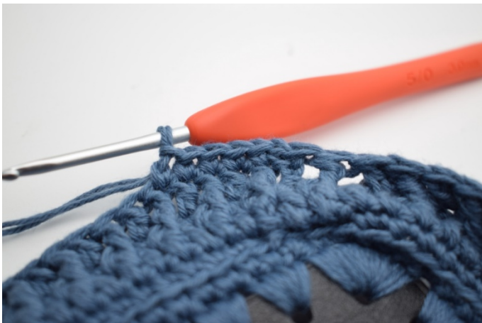
1. Virka 1 lm. Virka fm i varje maska varvet runt och avsluta med 1 sm. (160)