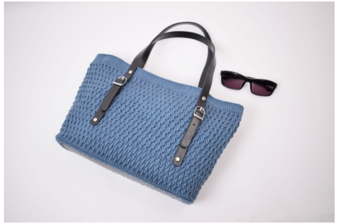
Sy fast tillbehöret enligt beskrivningen.