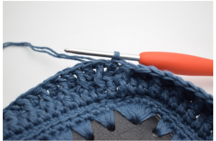
8. Upprepa "-" varvet runt. Avsluta med 1 sm i 3:e lm från varvets början. (160)