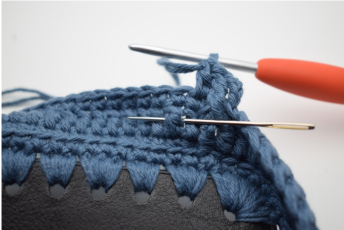
5. Virka 1 reldst fr runt nästa stolpe.