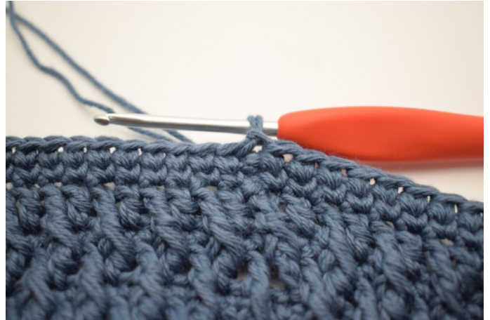
6. Upprepa varvet runt och avsluta med 1 sm.