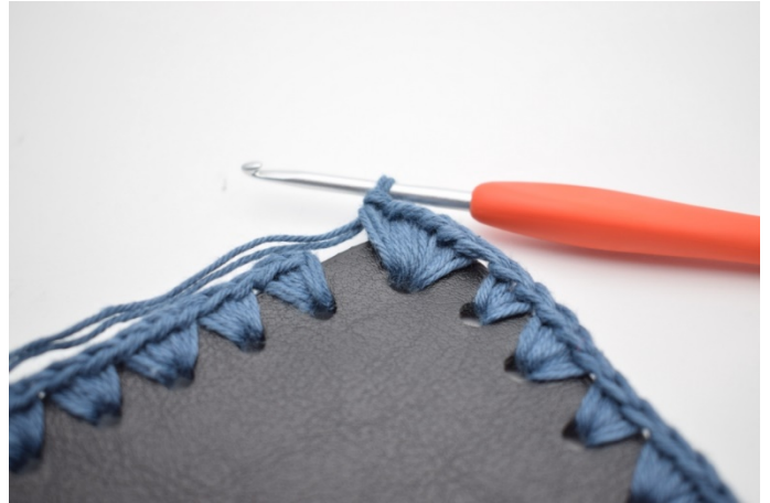
12. I hörnets håll, virka 6 fm.