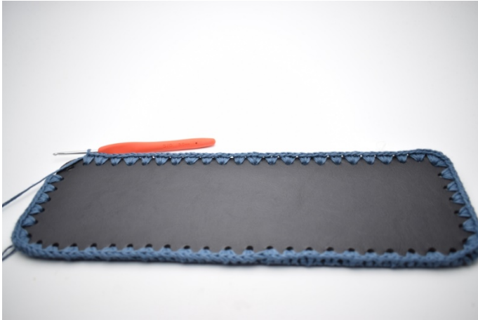
11. Virka "3 fm i nästa håll, 2 fm i nästa håll". Upprepa "-" 11 gånger.