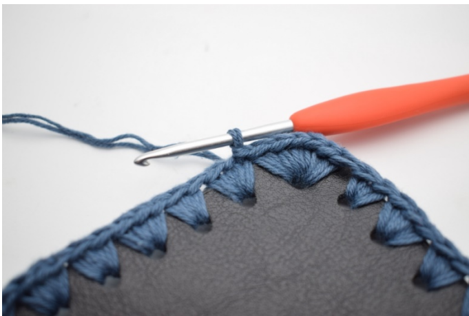
13. Avsluta med 1 sm. (160)