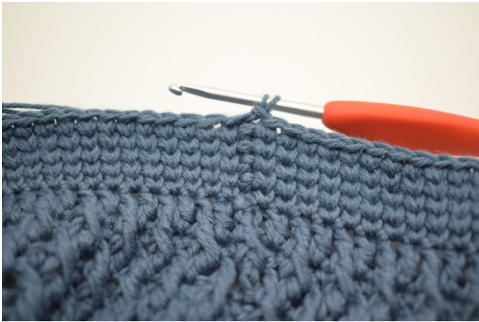
Upprepa varvet 4 gånger totalt. Klipp garnet och fäst.