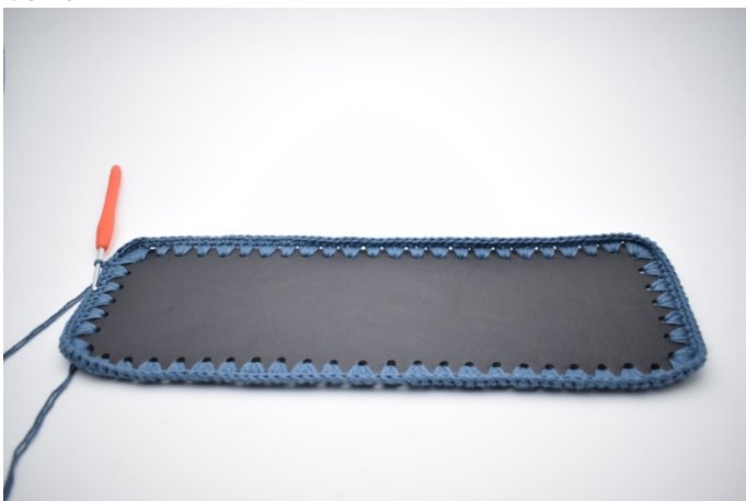
1. Virka 1 lm och virka 1 varv fm. Avsluta med 1 sm. (160)