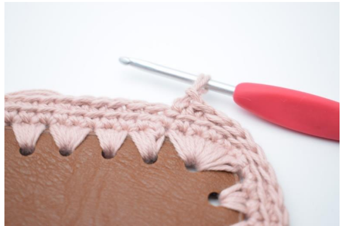
6. Upprepa varvet runt.