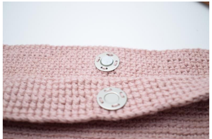
9. Sy fast magnetlåsen på mitten av väskans insida.