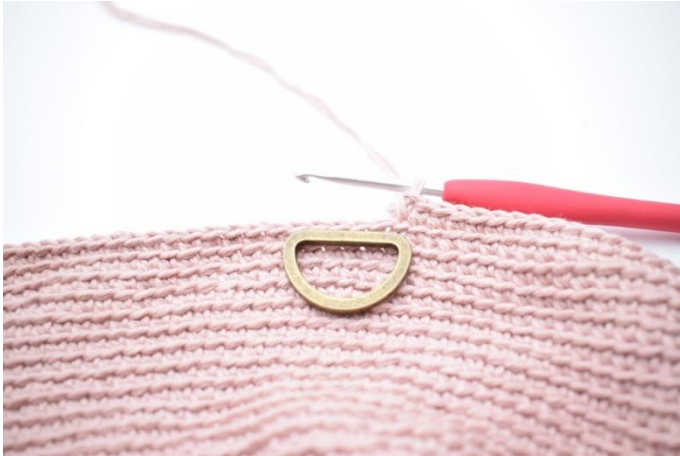
5. Virka fast D-ringgen med fm genom båda maskbågarna över 5 maskor.