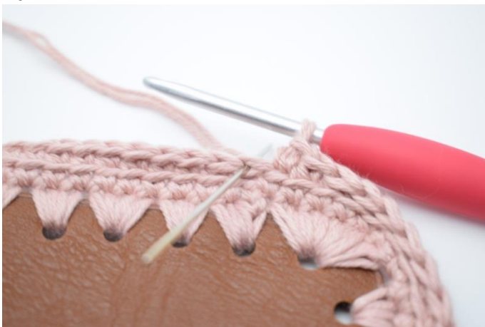
1. Upprepa varv 3. Virka 1 fm i bmb.