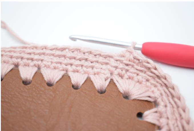
3. Upprepa varvet runt.