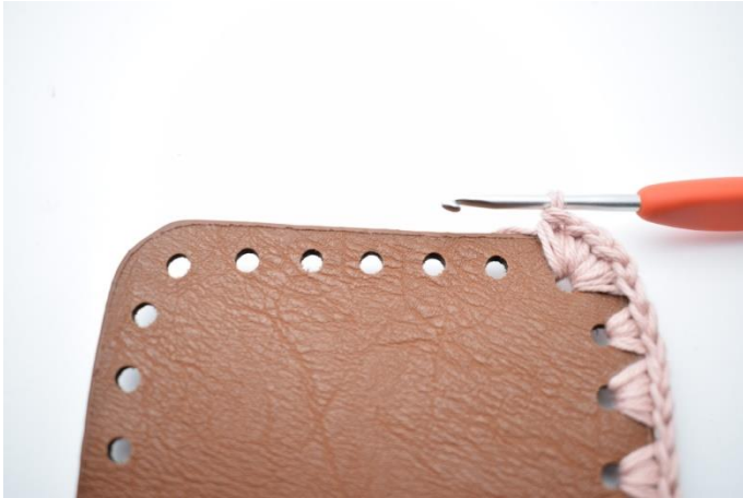
7. Fortsätt virka på andra kortsidan.