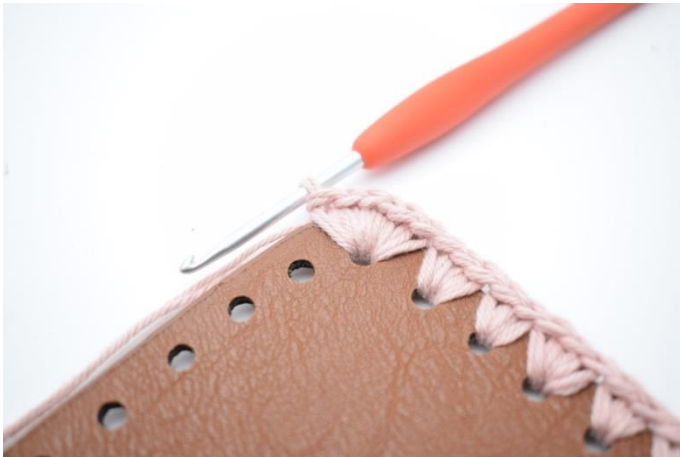
9. I hörnhålet, virka 6 fm.