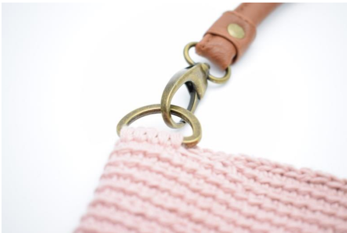
8. Haka fast handtagen på D-ringarna.