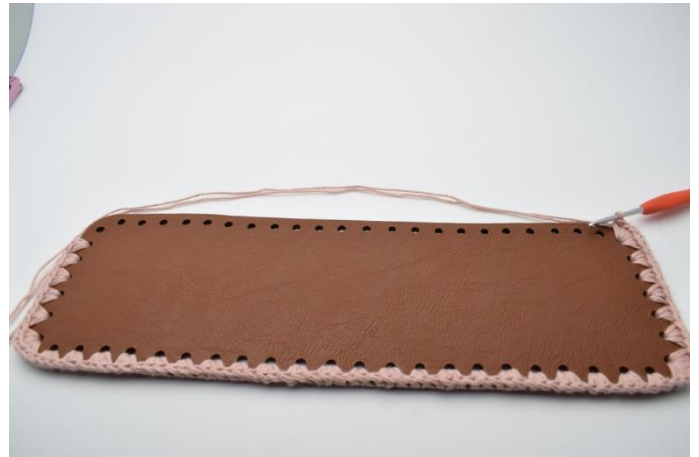
10. Fortsätt virka på andra långsidan.