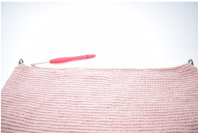
Virka fm i bmb fram till början på varvet.