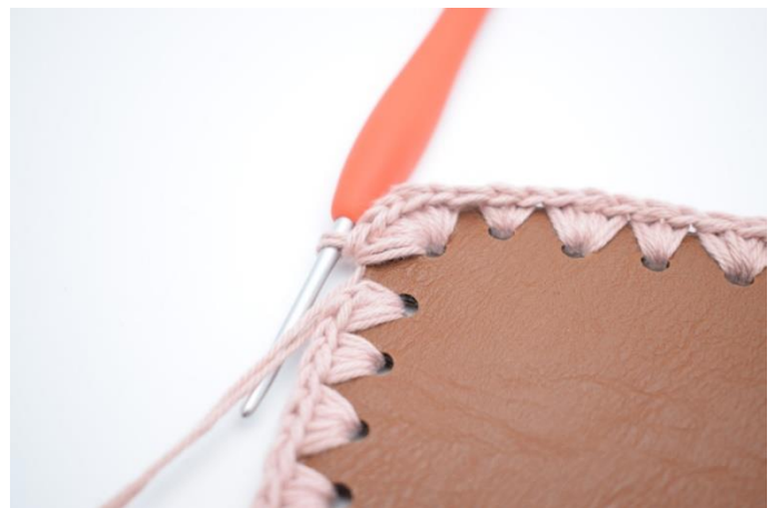
12. I hörnhålet, virka 6 fm. (160)