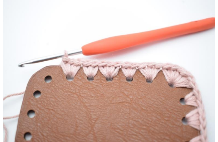
8. Virka 3 fm i första hålet. Virka "2 fm i nästa hål. Virka 3 fm i nästa hål." Upprepa "-" 2 gånger totalt.