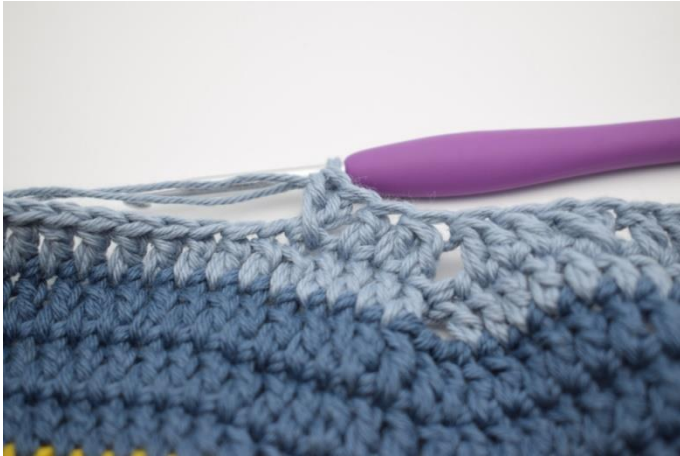
13. Hoppa 1 m över och virka 1 st. Virka 1 st i den maskan du hoppade.