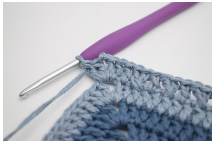
16. Virka 2 st, 2 lm och 2 st i nästa lm-båge)