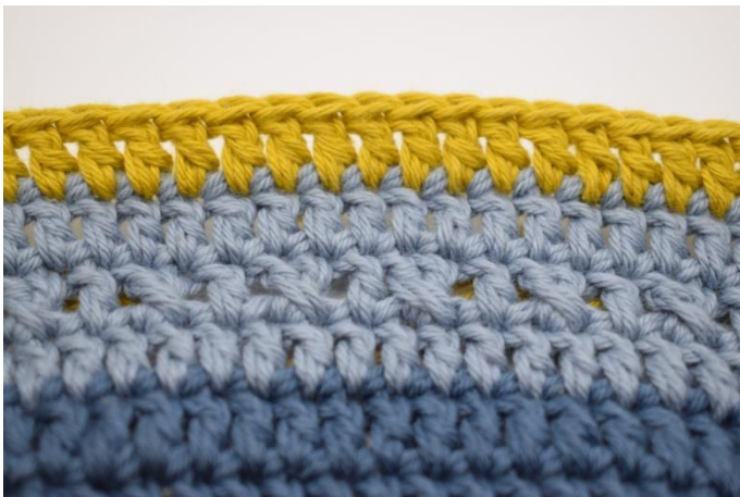
9. Du har nu virkat 1 mönstervarv och 2 stolpvarv.