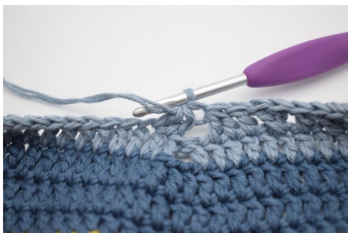
11. Virka 2 st tills.