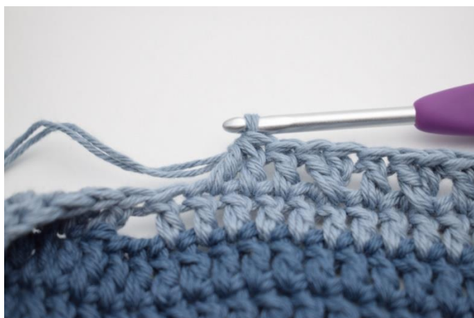
9. Virka 2 st tills.