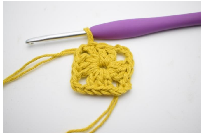
4. Virka 2 st. Avsluta med 1 sm i 3:e lm från varvets början.