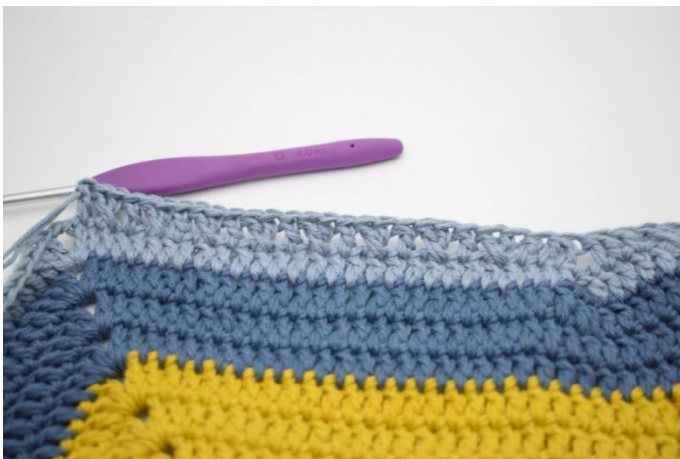
15. "Hoppa 1 m och virka 1 st. Virka 1 st i den maskan du hoppade. Virka 1 st i nästa m". Upprepas "-" 8 gånger.