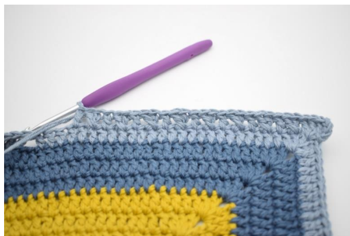
8. "Hoppa 1 m och virka 1 st. Virka 1 st i den maskan du hoppade. Virka 1 st i nästa m". Upprepa "-" 8 gånger.