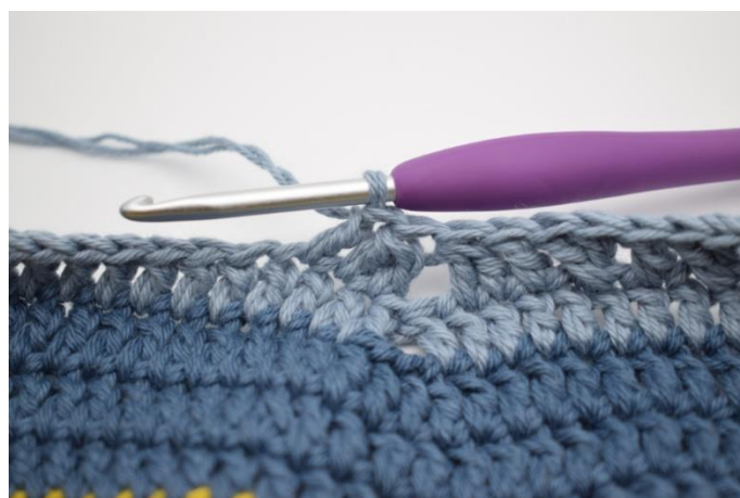
12. Virka 1 st i nästa m.