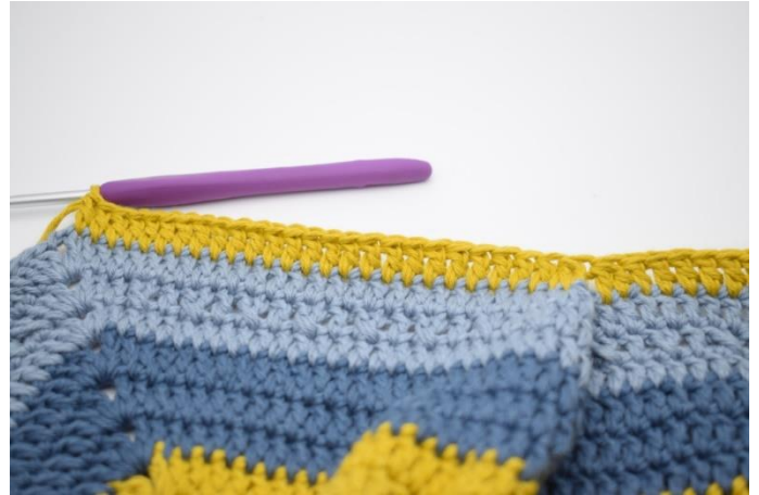
6. Virka 1 st i nästa 25 m.