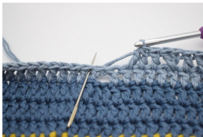
10. Hoppa 2 m.