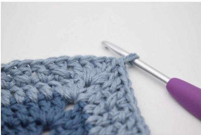
17. Upprepas på alla 4 sidor. Virka 1 st i lm-bågen från varvets början. Avsluta med 1 sm i 3:e lm.