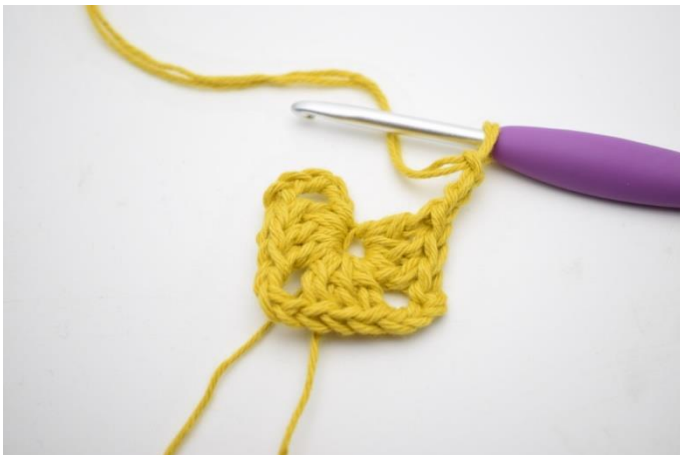
3. Upprepa "-" 3 gånger totalt.