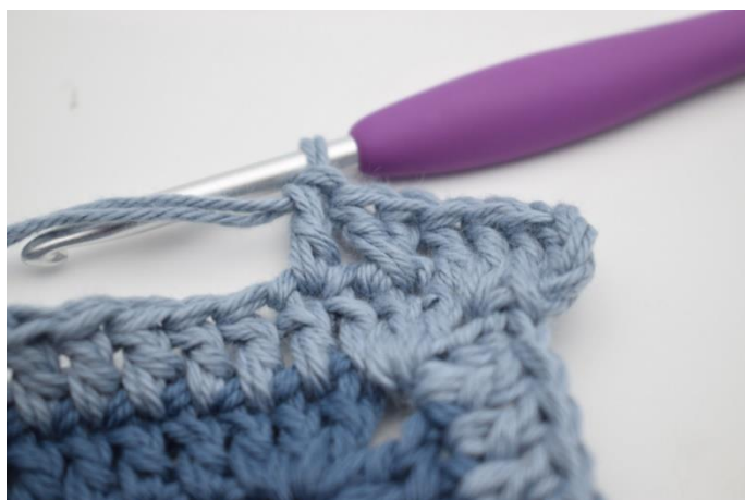
7. Virka 1 st i nästa m.