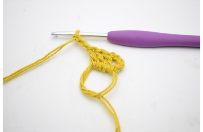
2. Virka "3 st och 3 lm".