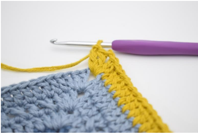
7. Virka 2 st, 2 lm och 2 st i nästa lm-båge.