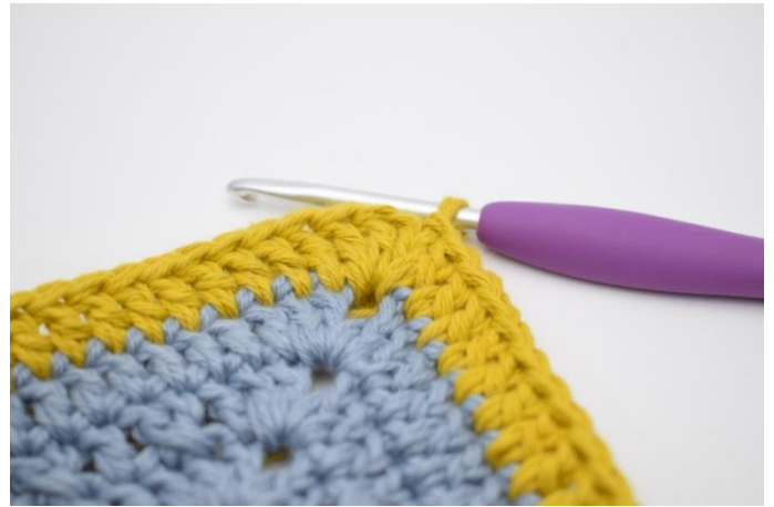
8. Upprepa på alla 4 sidor. Virka 1 st i lm-bågen från varvets början. Avsluta med 1 sm i 3:e lm.