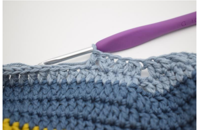
14. Virka 1 st i nästa m.