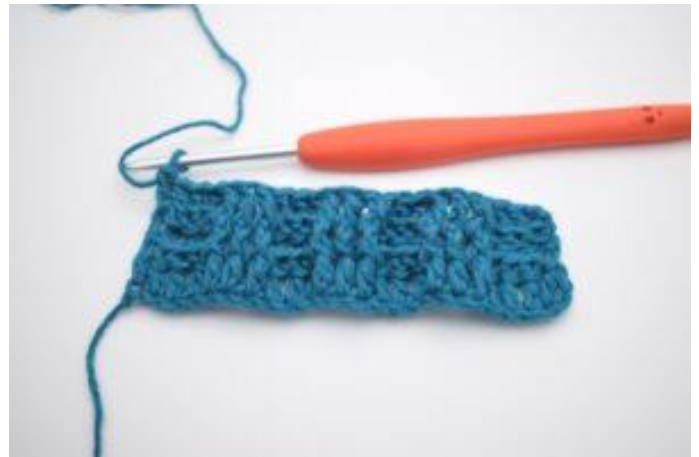
8. Upprepa 3 relst bak och 3 relst fr växelvist varvet ut. Varvet avslutas med 3 relst bak. I sista m, virka 1 vanlig st.