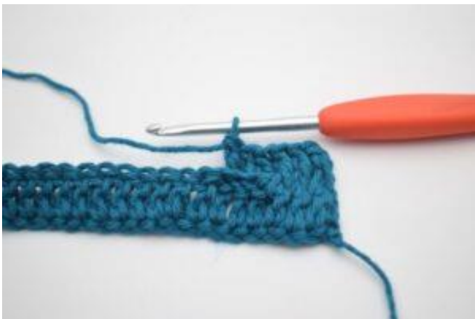
7. Virka 1 relst bak runt nästa 2 stolpar.