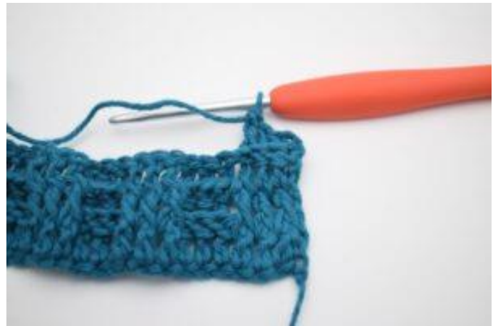
4. Virka 1 relst bak runt nästa 2 st.