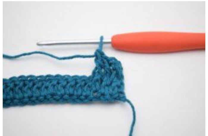
4. Virka 1 relst fr runt nästa 2 stolpar.