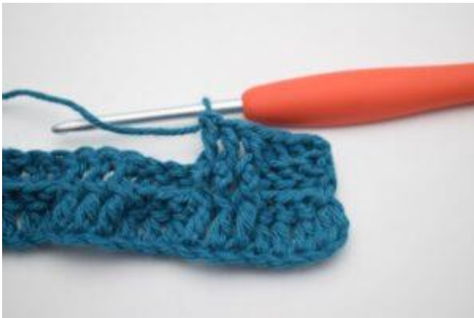
7. Virka 1 relst fr runt nästa 2 st.