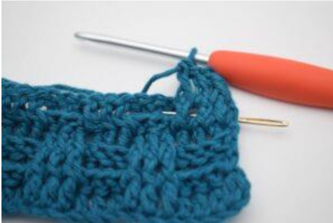
5. Virka 1 relst bak runt nästa st.