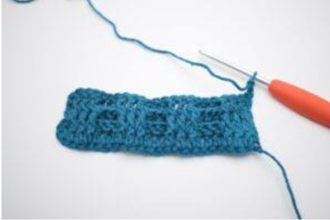
1. Vänd med 2 lm.