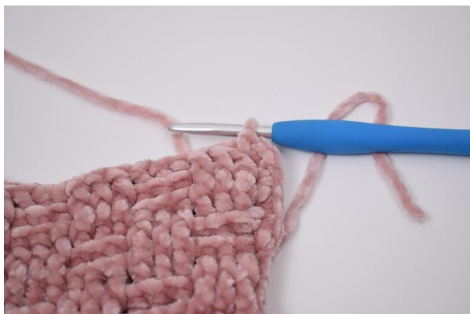
3. Virka fm fram till hörnet. I hörnet, virka 3 fm.