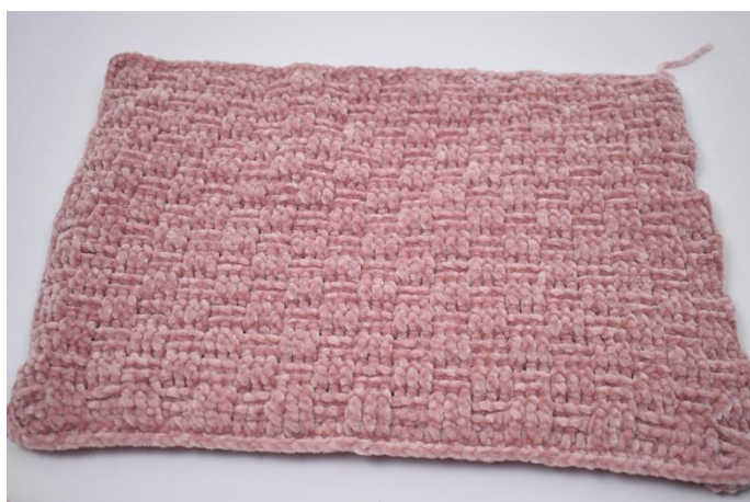
5. Virka fm runt varje sida.