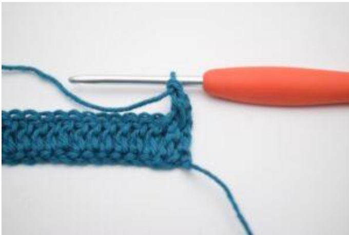
3. Sådär. Du har nu virkat 1 relst fr.