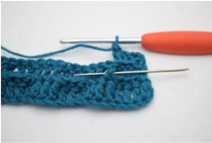
5. Virka 1 relst fr runt nästa stolpe.