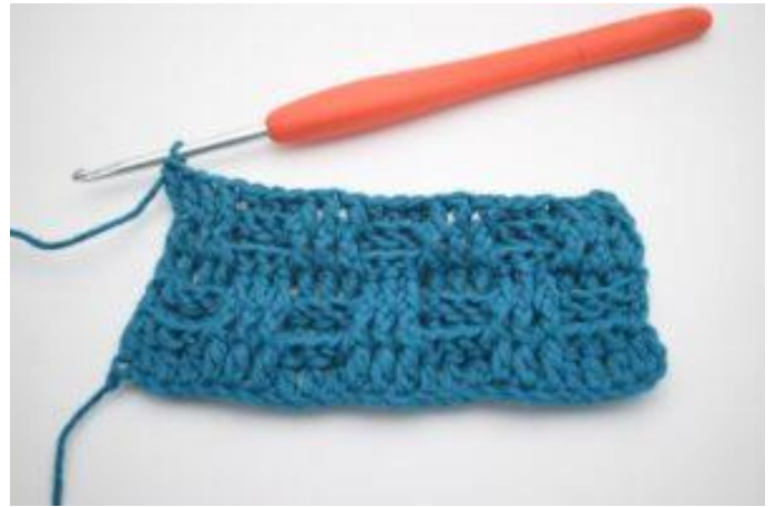
8. Upprepa 3 relst fr och 3 relst bak växelvist varvet ut. Varvet avslutas med 3 relst fr. Virka 1 vanlig st i sista m. Upprepa varv 2-5 enligt mönsterbeskrivningen.