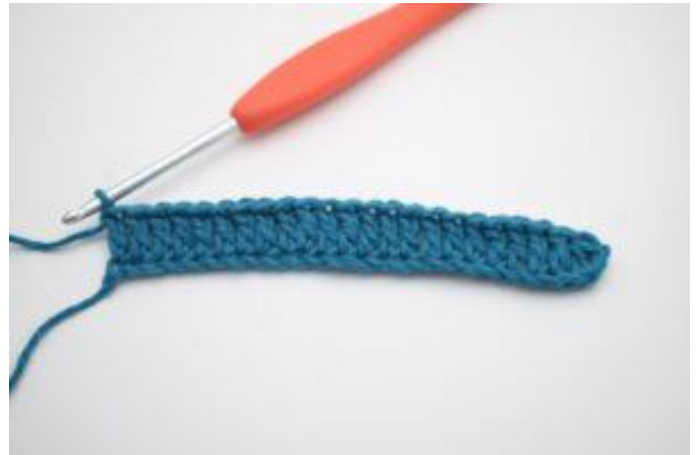
4. Virka st varvet ut.