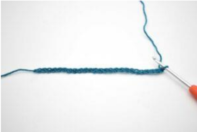
1. Lägg upp lm.