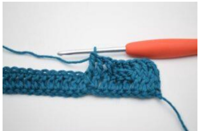
8. Virka 1 relst fr runt nästa 3 stolpar.