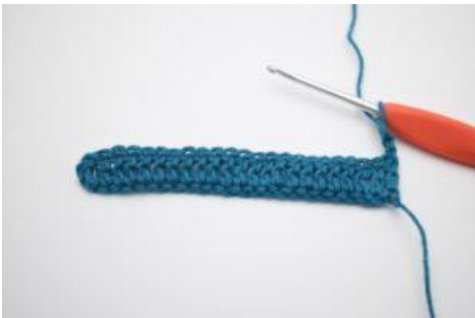
1. Vänd med 2 lm.