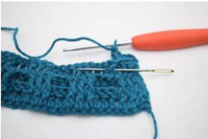
5. Virka 1 relst fr runt nästa st.