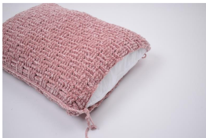
6. Stoppa ner monteringskudden innan du virkar ihop fodralet helt.