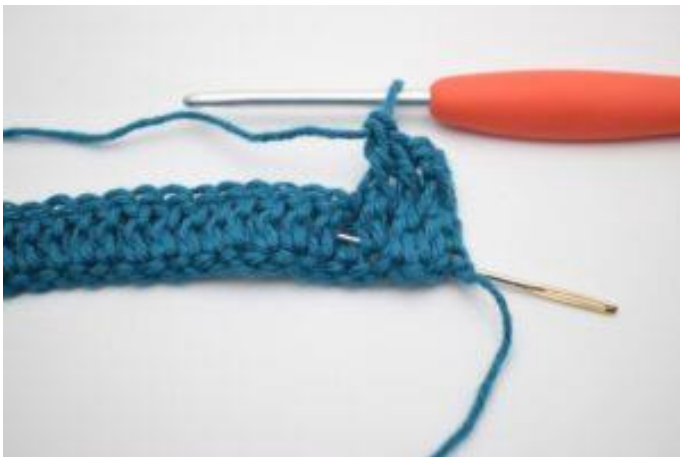
5. Virka 1 relst bak. Detta är en st som virkas bakifrån runt stolpen från föregående varv. Nålen markerar stolpen som din relst bak ska virkas runt om.