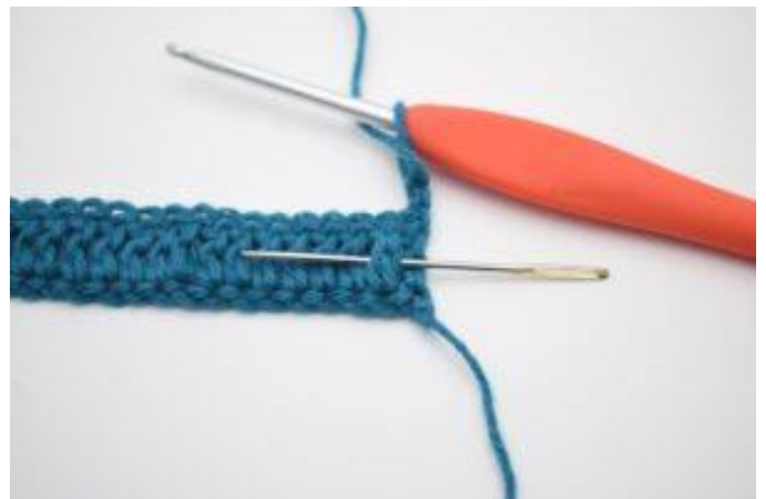
2. Virka 1 relst fr. Detta är en st som virkas framifrån runt stolpen från föregående varv. Nålen markerar stolpen som din relst fr ska virkas runt om.