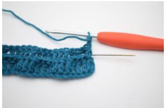
2. Virka 1 relst bak runt första stolpen.