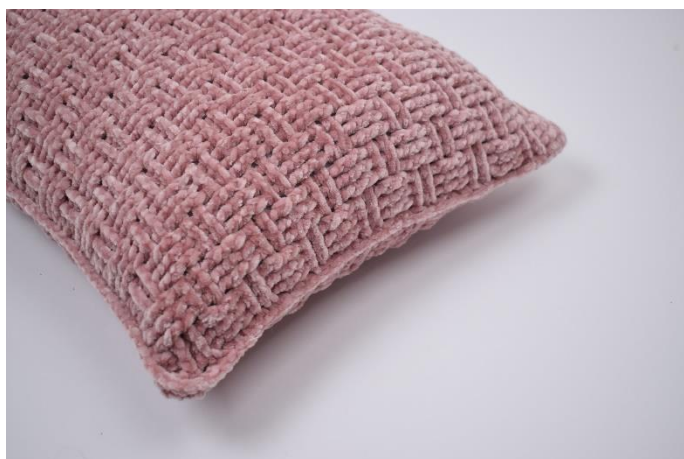
7. Klipp garnet och fäst.