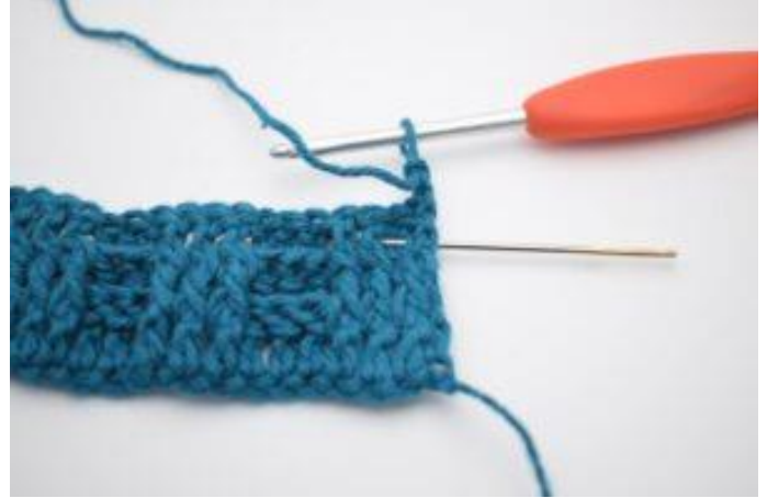
2. Virka 1 relst bak runt första st.