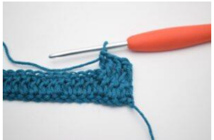
6. Sådär. Du har nu virkat 1 relst bak.