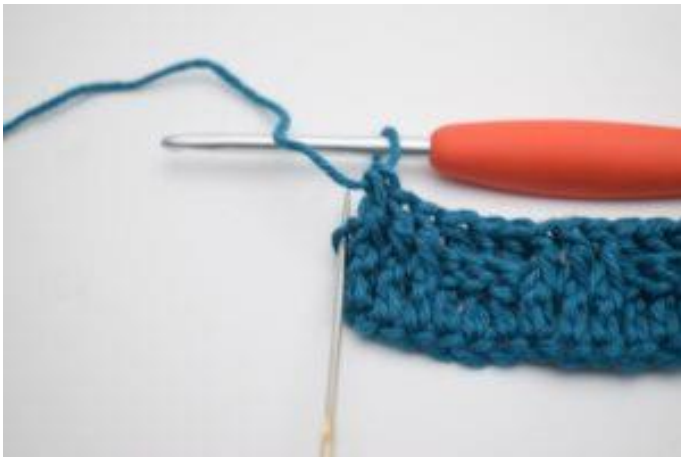
11. I sista m, virka 1 vanlig stolpe.