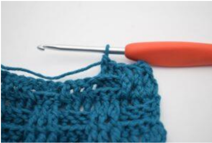
7. Virka 1 relst bak runt nästa 2 st.