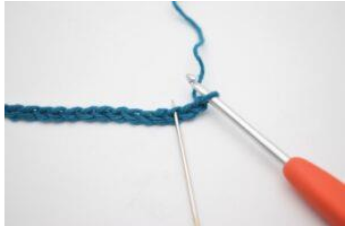
2. Virka 1 st i 3:e lm från nålen.