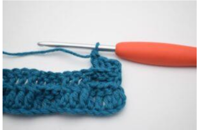
4. Virka 1 relst bak runt nästa 2 stolpar.