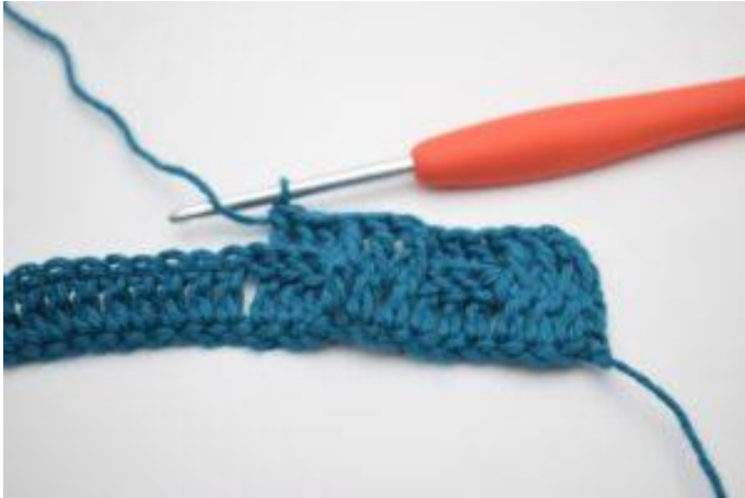
9. Virka 1 relst bak runt nästa 3 stolpar.