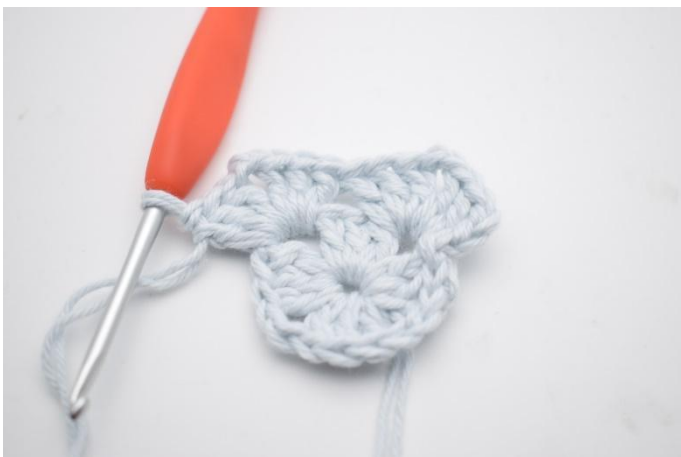
5. Så här.