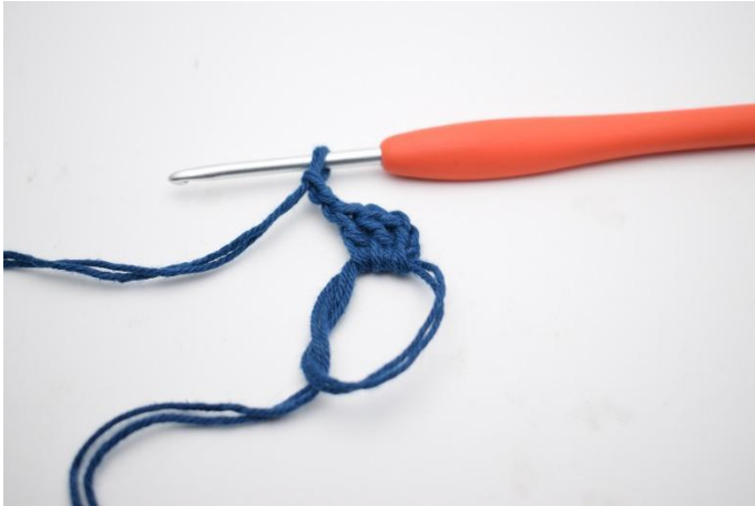
3. och gör 2 lm.