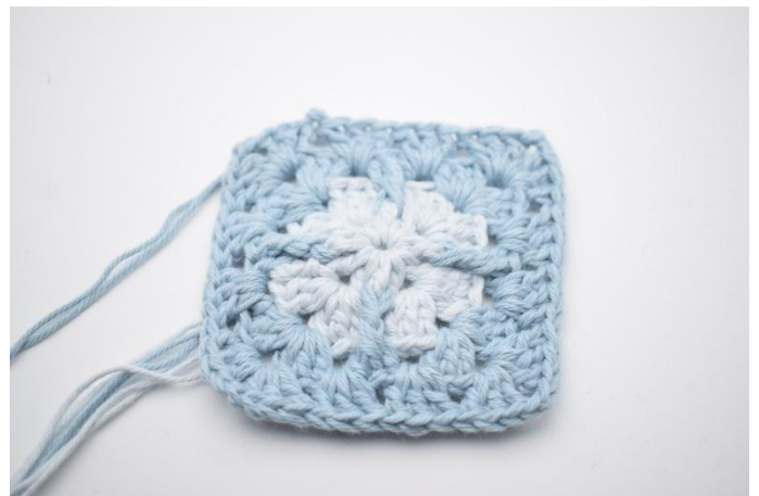
10. Avsluta med 1 sm. Klipp av garnet.