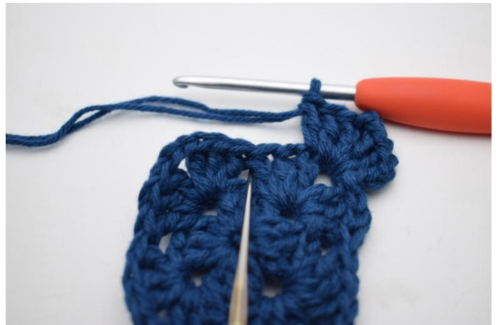
4. Virka 3 st i nästa mellanrum.