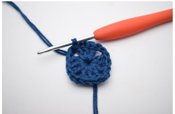
2. Så här.