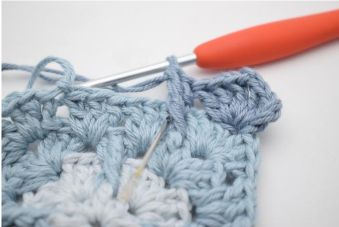
7. Virka 1 st till i samma mellanrum.