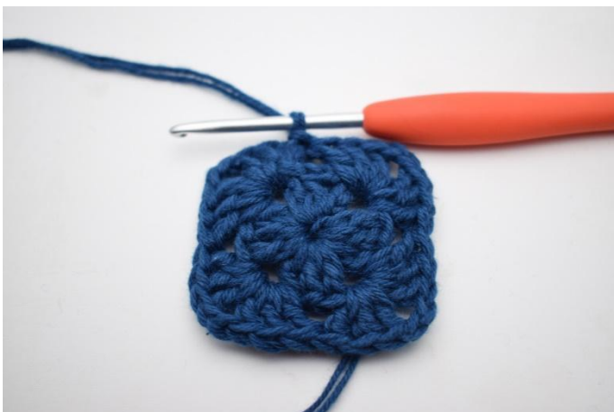
7. Avsluta med 1 sm.