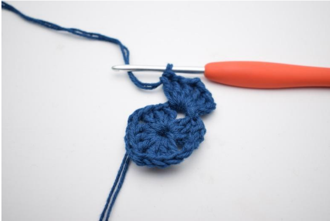
3. Gör 3 lm, virka 2 st, 2 lm, 3 st i lm-bågen.