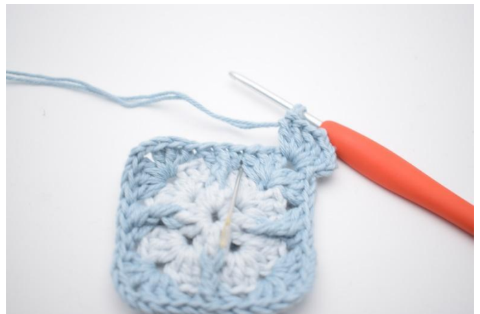
4. I nästa lm-mellanrummen virkas 3 st