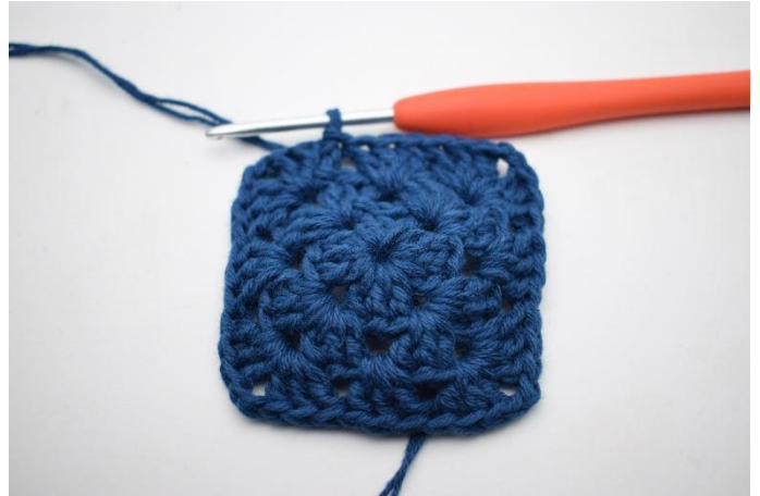
8. Avsluta med 1 sm.