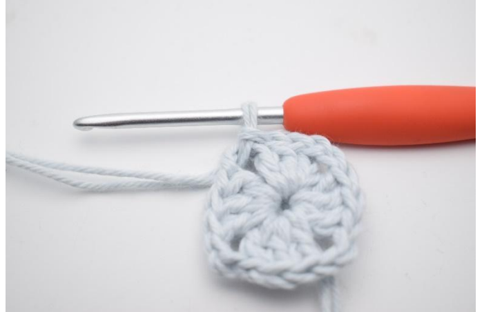
2. Så här.