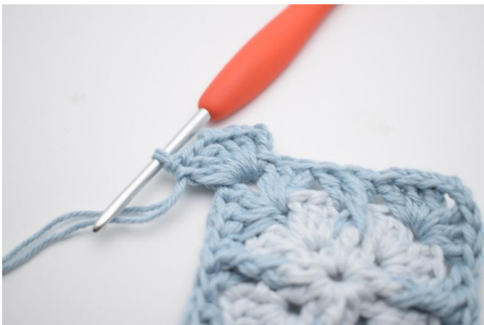
3. Gör 3 lm, virka 2 st, 2 lm, 3 st i lm-bågen.