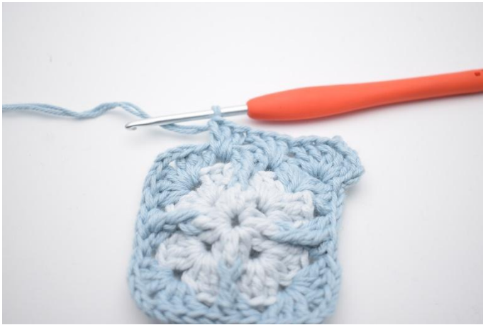
7. Så här.