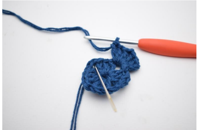
4. Virka " 3 st, 2 lm, 3 st i nästa lm-båge".