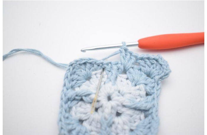
6. Virka 3 st i nästa mellanrum.