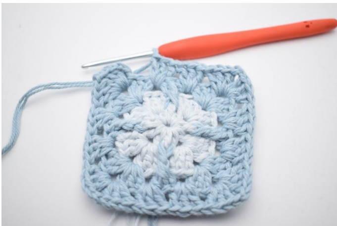
9. Upprepa "till" totalt 3 gånger.