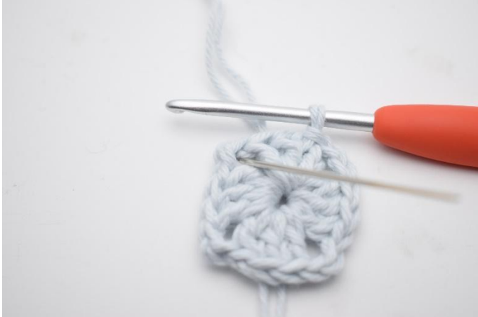
1. Gör sm fram till lm-bågen.