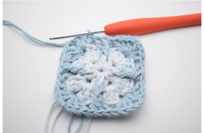
12. Avsluta med 1 sm.