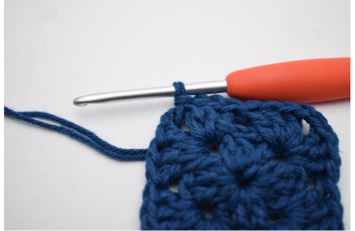
2. Så här.