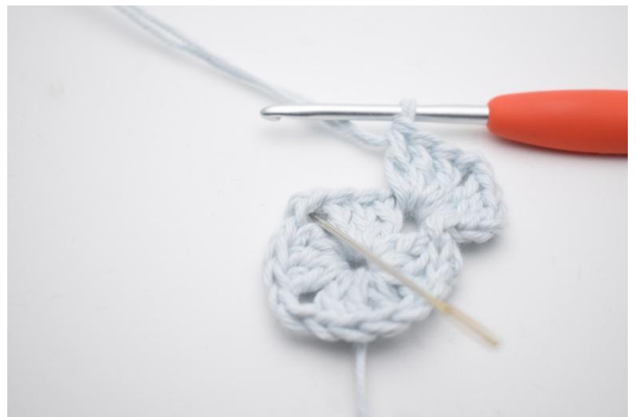
4. Virka " 3 st, 2 lm, och 3 st i nästa lm-båge".