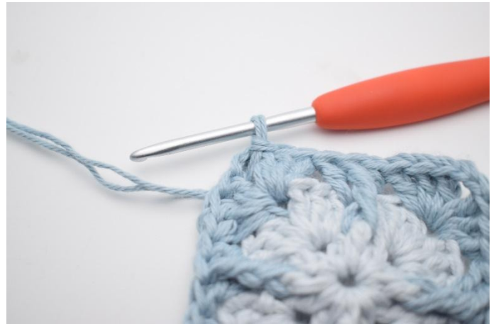
2. Så här.