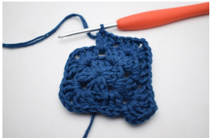
6. Virka "3 st, 2 lm och 3 st i nästa lm-båge. Virka 3 st i nästa mellanrum".