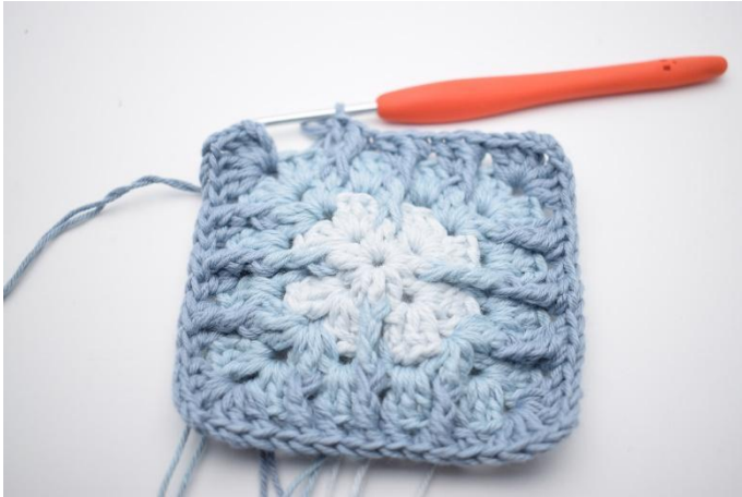
13. Upprepa "till" totalt 3 gånger.