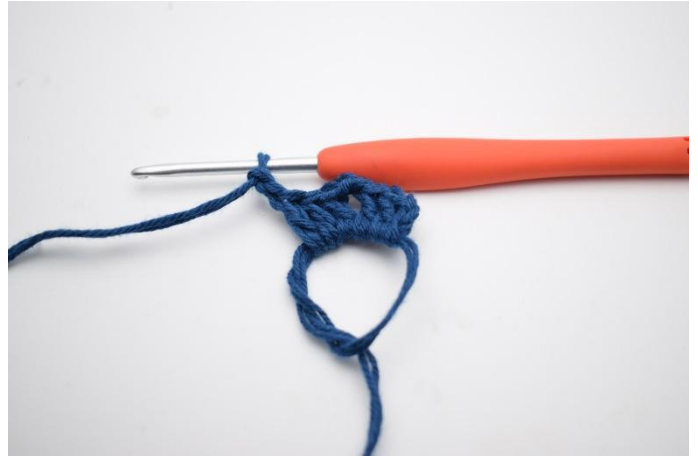
4. Virka "3 st och 2 lm,".