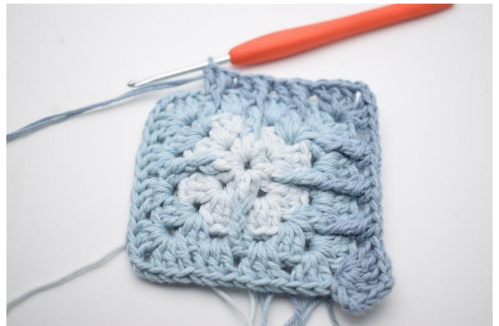
12. Virka "3 st, 2 lm, 3 st i nästa lm-båge. I de nästa 3 lm-mellanrummen virkas 1 st, 1 Db relst fr kring den mittersta m i st-gruppen från varv 3 och 1 st".