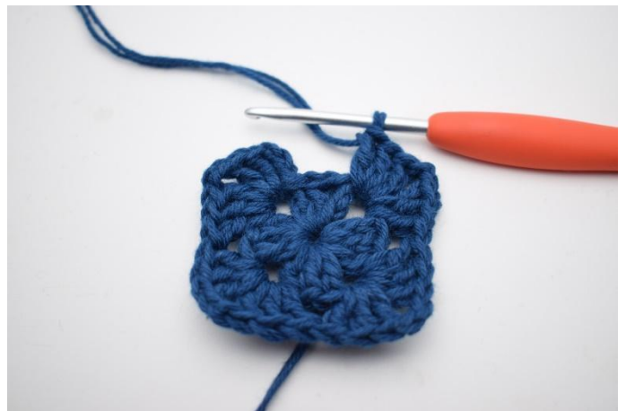
6. Upprepa "till" totalt 3 gånger.