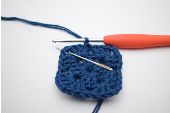
1. Gör sm fram till lm-bågen.