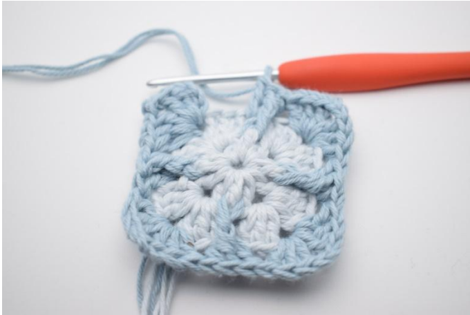
11. Upprepa "till" totalt 3 gånger.