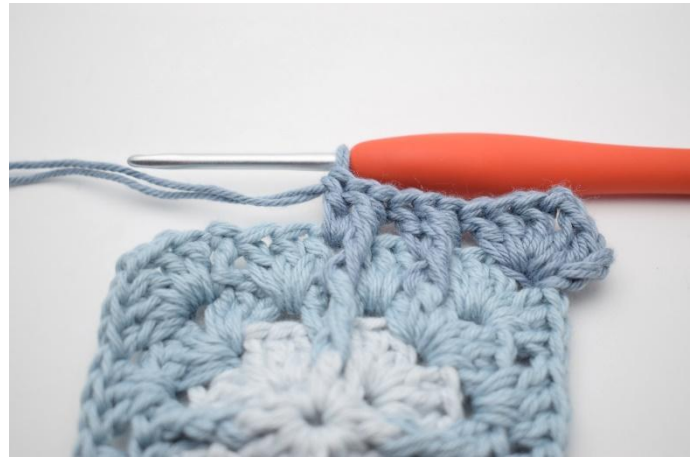
10. Så här.