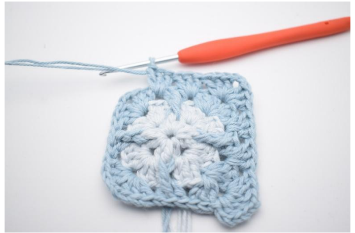
8. Virka 3 st, 2 lm, 3 st i nästa lm-båge. I de nästa 2 lm-mellanrummen virkas 3 st i samma mellanrum".