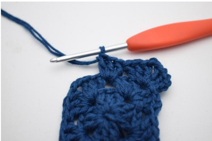
5. Så här.