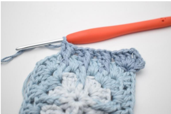
11. Upprepa igen i nästa mellanrum.