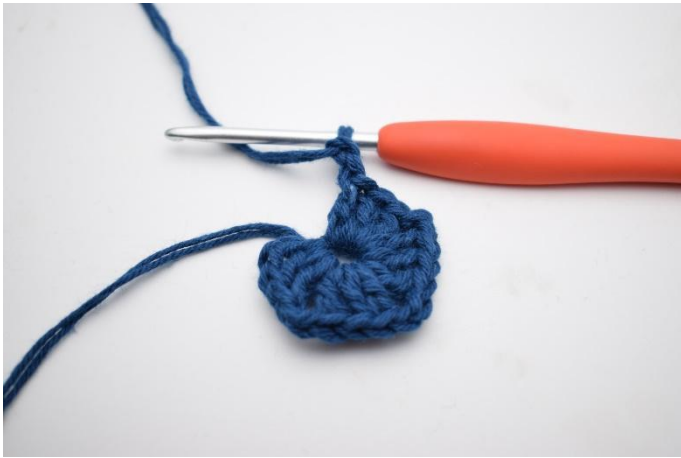
5. Upprepa "till" totalt 3 gånger.