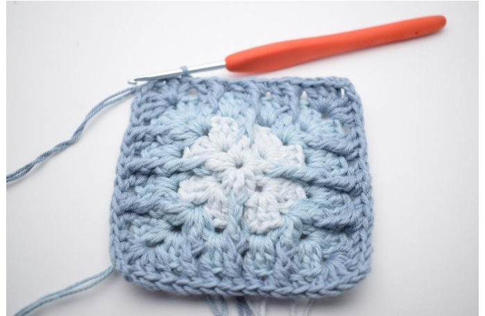
14. Avsluta med 1 sm.