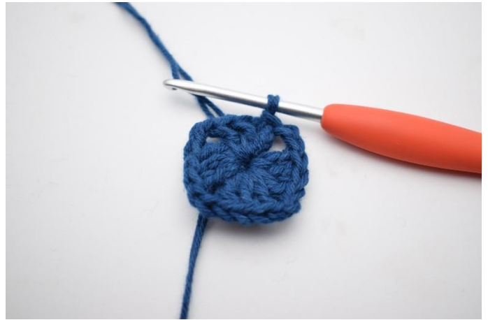
6. Avsluta med 1sm.