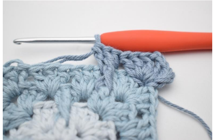
8. Så här.