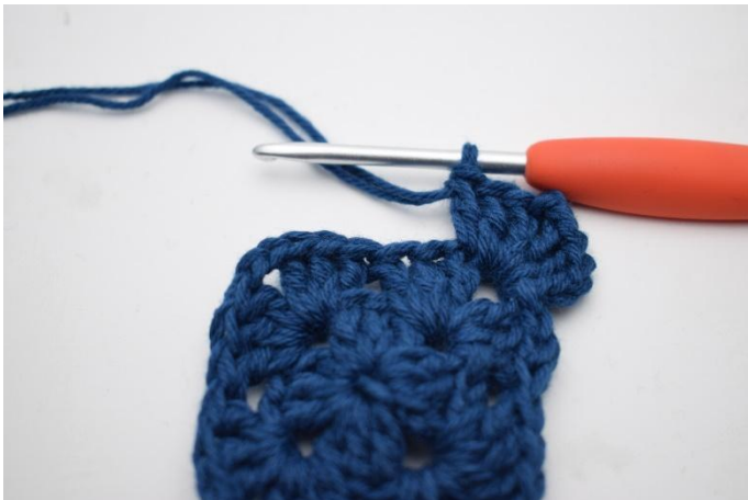
3. Gör 3 lm, virka 2 st, 2 lm, 3 st i lm-bågen.