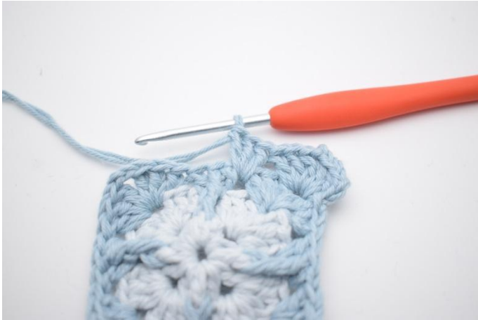
5. Så här.