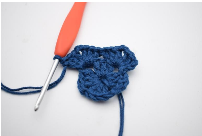
5. Så här.