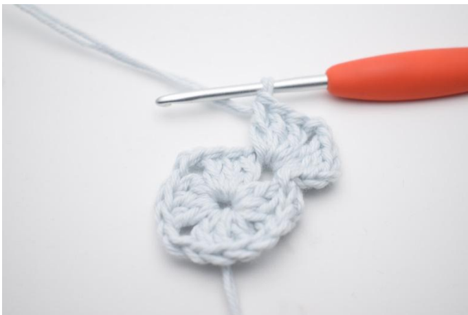
3. Virka " 3 st, 2 lm, 3 st 1 lm i nästa lm-båge.