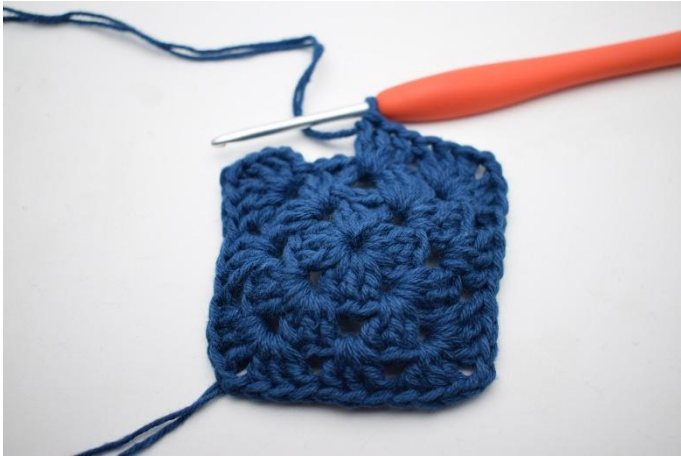
7. Upprepa "till" totalt 3 gånger.