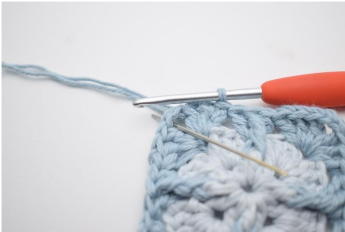
1. Gör sm fram till lm-bågen.