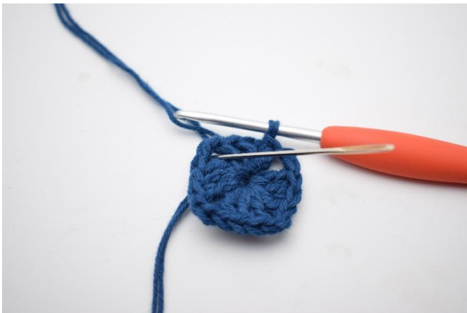
1. Gör sm fram till lm-bågen.