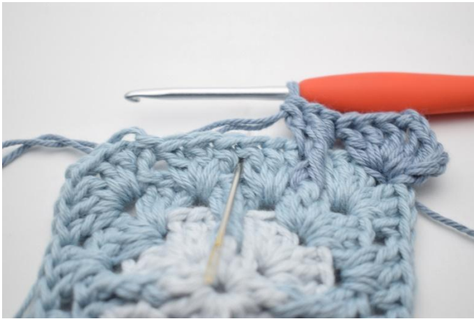
9. Upprepa detta i nästa mellanrum.