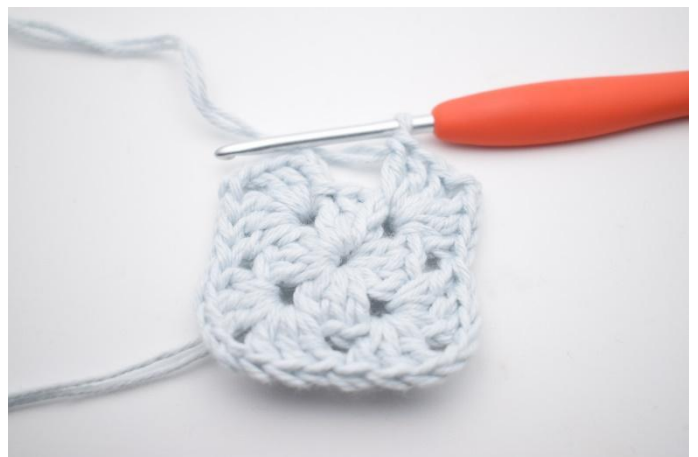
6. Upprepa "till" totalt 3 gånger.