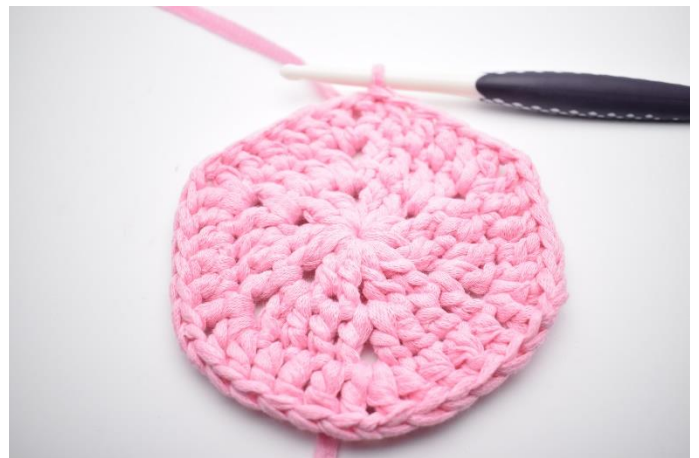
6. Upprepa "-" varvet runt och avsluta med 1 sm i 3:e lm på varvets början. (36)