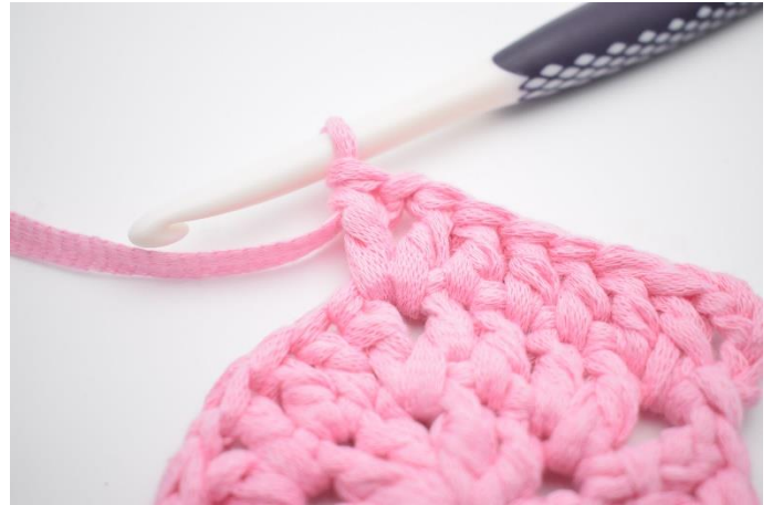
4. " I nästa lm-båge virka 1 st, 1 lm, 1 st.