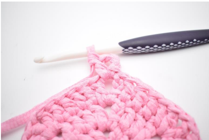
1. Virka 1 sm fram till lm-bågen. Virka 4 lm (ersätter 1 st och 1 lm). Virka 1 st om lm-bågen.