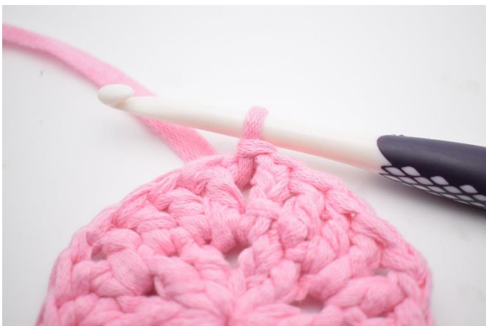
1. Virka 1 sm fram till lm-bågen.