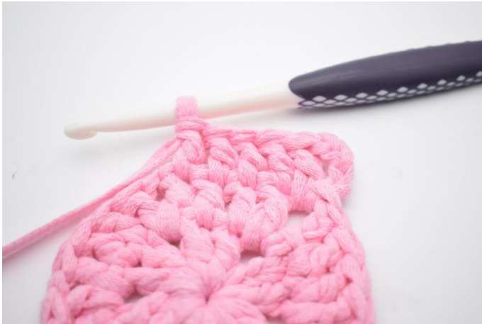
3. Virka 1 st i nästa 4 m.