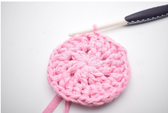
7. " I nästa lm-båge virka 1 st, 1 lm, 1 st. Virka 1 st i nästa 2 m "Upprepa "-" varvet runt och avsluta med 1 sm i 3:e lm på varvets början. (24)