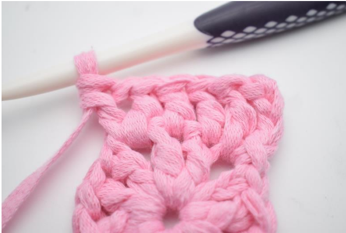
5. I nästa lm-båge virka "1 st, 1 lm, 1 st".