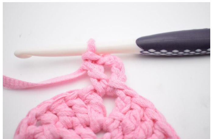
2. Virka 4 lm (ersätter 1 st och 1lm) Virka 1 st om lm-bågen.