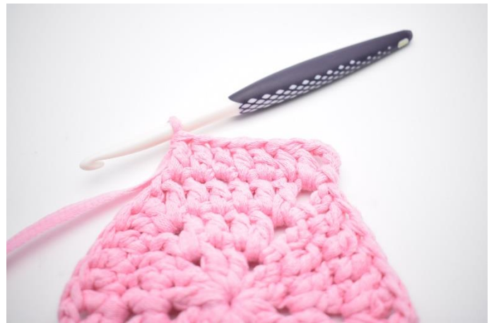
2. Virka 1 st i nästa 6 m.