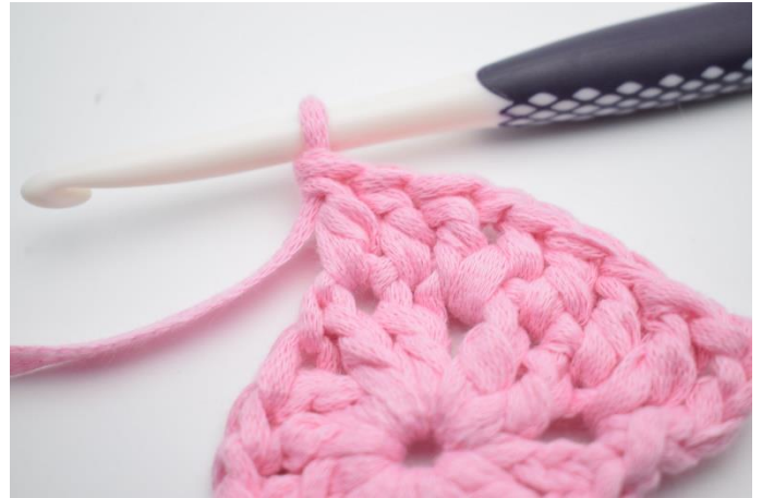
6. Virka 1 st i nästa 2 m