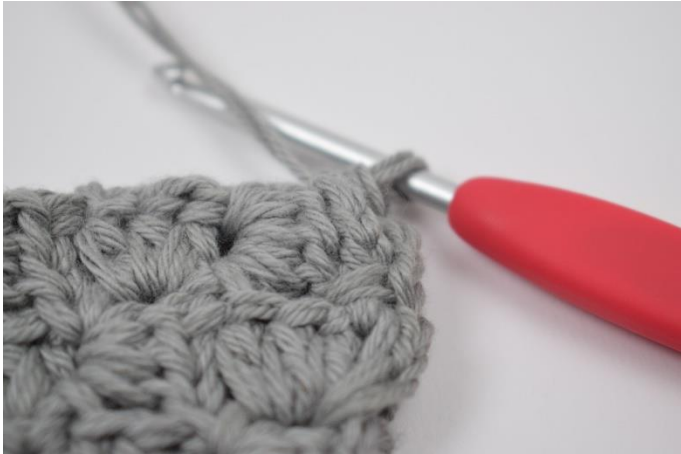
5. Virka 1 fm i hörnet.