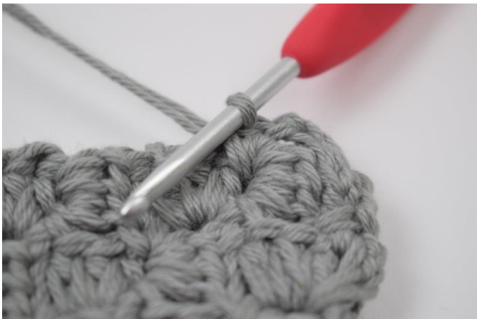
7. Virka 1 fm mellan 2 nästa "fyrkanter".