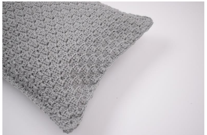
8. Upprepa detta hela vägen runt om kudden. Stoppa ner kudden i kuddfodralet innan det virkas ihop helt. Avsluta med 1 sm. Klipp garnet och fäst.