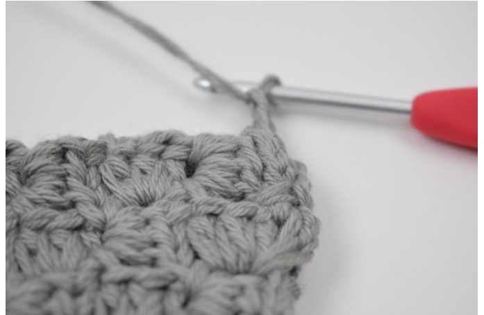
6. Virka 2 lm.