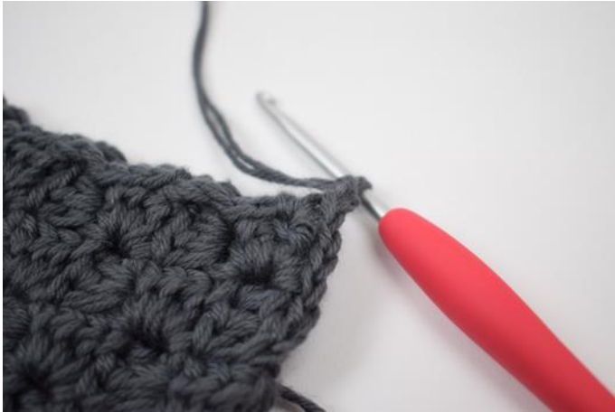
7. Virka 2 lm.