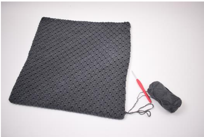
9. Fortsätt runtom kudden