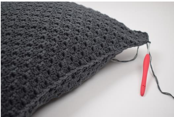
11. Fortsätt hela vägen runt och avsluta med 1 sm.