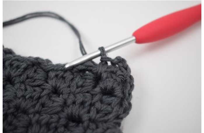
8. Virka 1 fm mellan nästa 2 "fyrkanter".