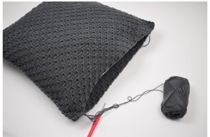
10. Stoppa ner kudden i kuddfodralet innan det sys ihop helt.