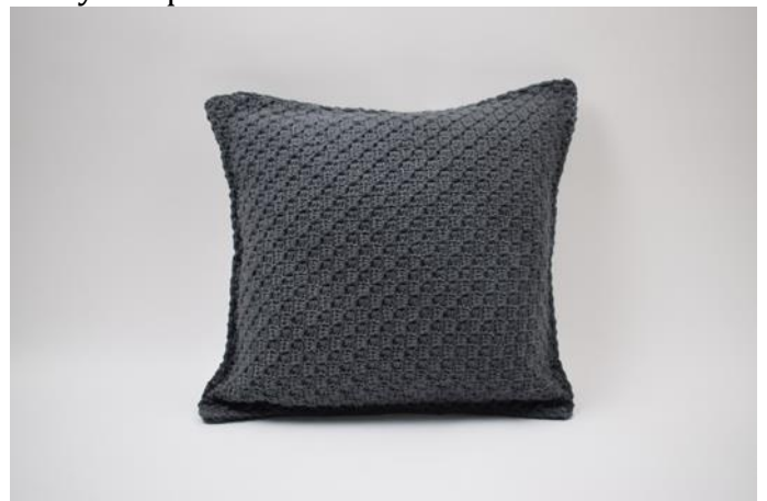
12. Klipp garnet och fäst.