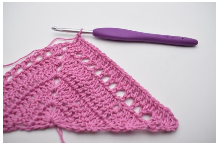
2. Virka 1 st i de följande 24 masker och lm-hål.