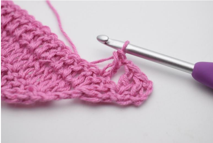
3. Så här.