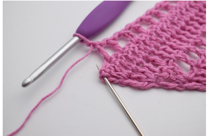
10. Gör 1 lm, hoppa över 1 m, virka 2 st och 1 dst i sista st.