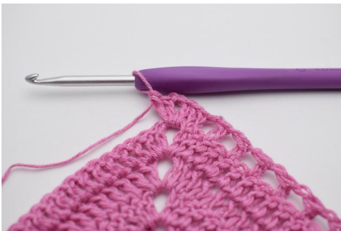
5. I lm-bågen virkas 2 st, 2 lm, 2 st.