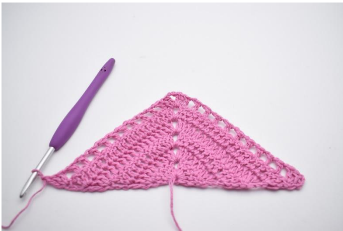
11. Så här.