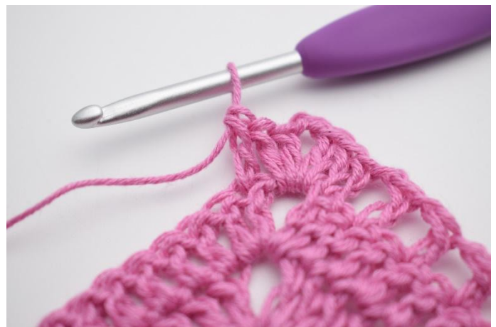
6. Virka 1 st i nästa m.