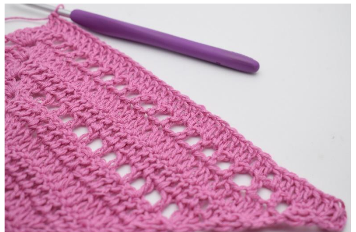
2. Virka 1 st i de följande 36 masker och lm-hål.