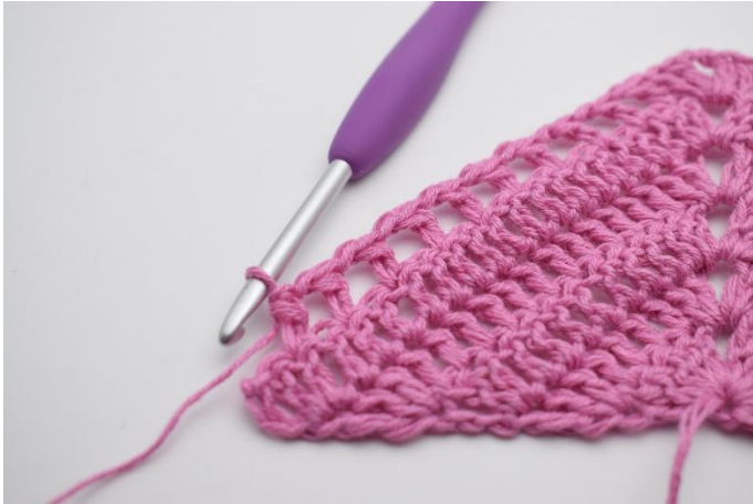
9. Upprepa "till" totalt 9 gånger