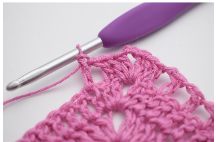
8. Så här.