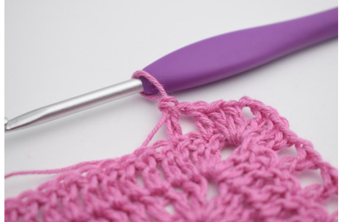
8. Så här.