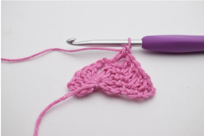
3. Virka 1 st i de följande 4 m.