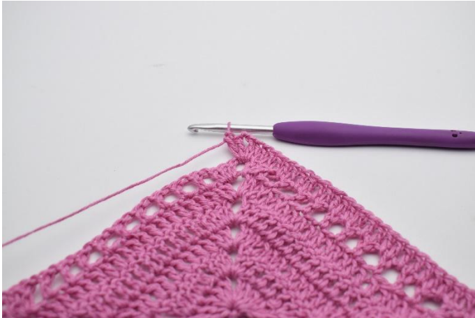
3. I lm-bågen virkas 2 st, 2 lm, 2 st.