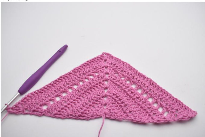
1. Vänd arbetet med 4 lm. Virka 2 st i första m. Virka 1 st i de följande 28 m. I lm-bågen virkas 2 st, 2 lm, 2 st. Virka 1 st i de följande 28 m. I sista m virkas 2 st och 1dst.