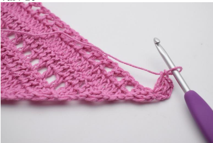
1. Vänd arbetet med 4 lm. Virka 2 st i första m.