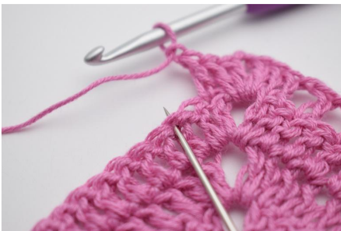
7. "Gör 1 lm, hoppa över 1 m, virka 1 st i nästa m".