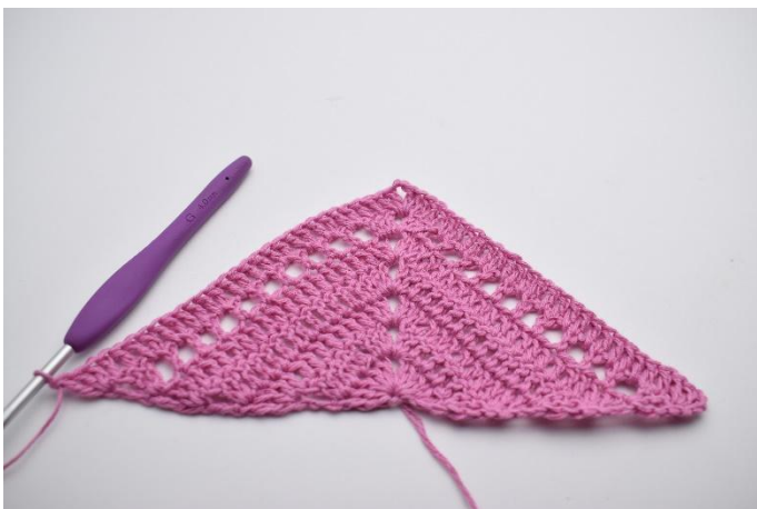
5. I sista m virkas 2 st och 1 dst.