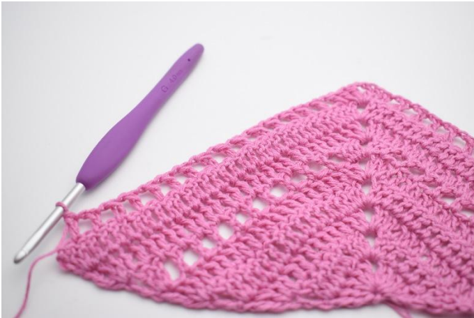
9. Upprepa "till" totalt 15 gånger.