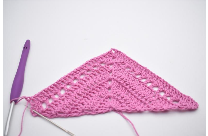
4. Virka 1 st i de följande 24 maskor och lm-hål.