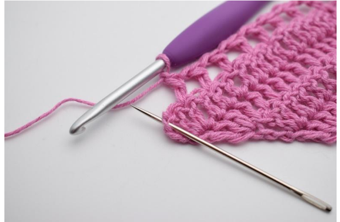
10. Gör 1 lm, hoppa över 1 m, virka 2 st och 1 dst i sista st.