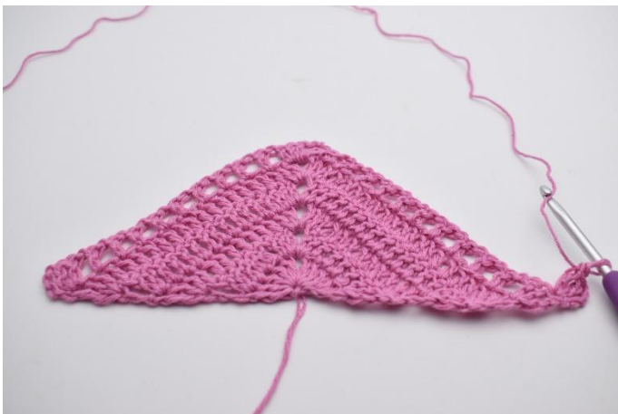
1. Vänd arbetet med 4 lm. Virka 2 st i första m.