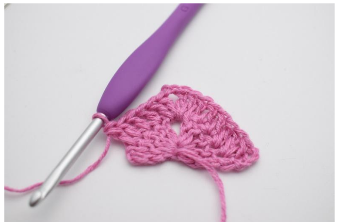
6. Virka 1 st i de nästa 4 m.