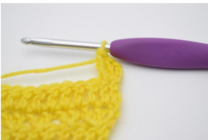
5. Så här.