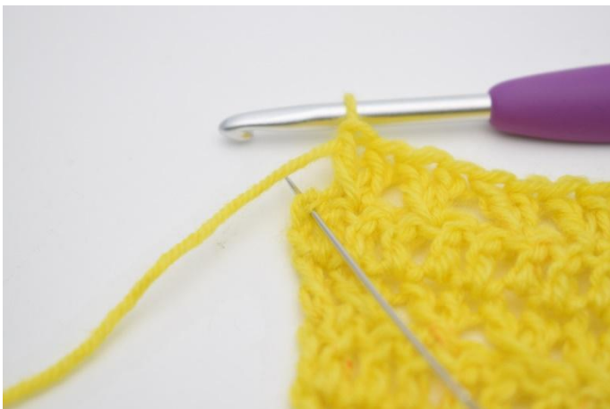
11. Virka 1 st i sista m.