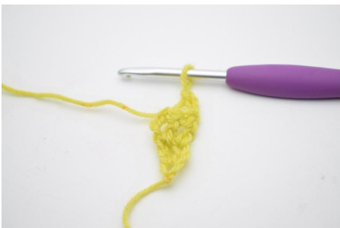
1. Vänd med 3 lm.