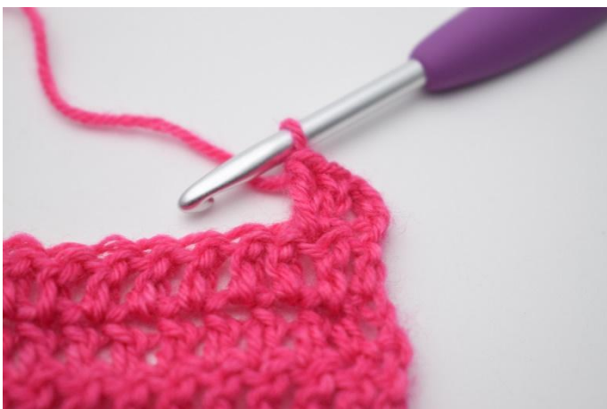
5. Så här.