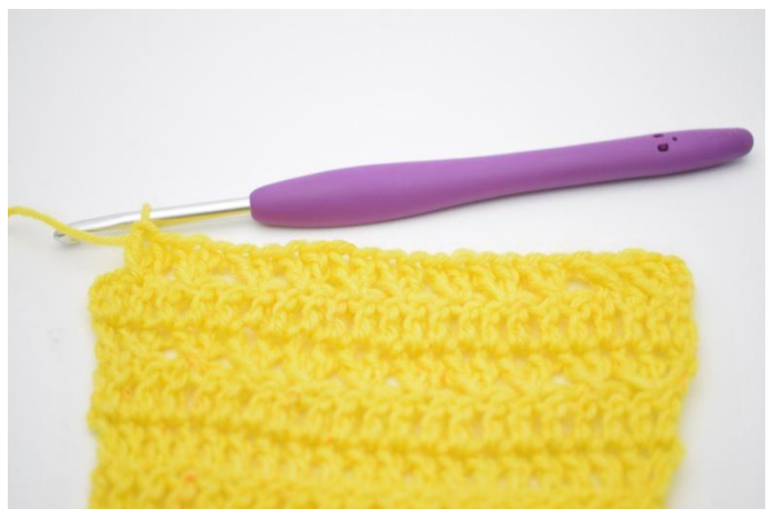
10. Upprepa med korsade st tills det är 1 m kvar.