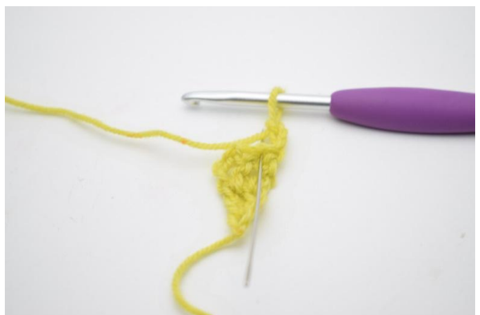
2. Virka 1 st i första m. (Nålen markerar här den första m.)