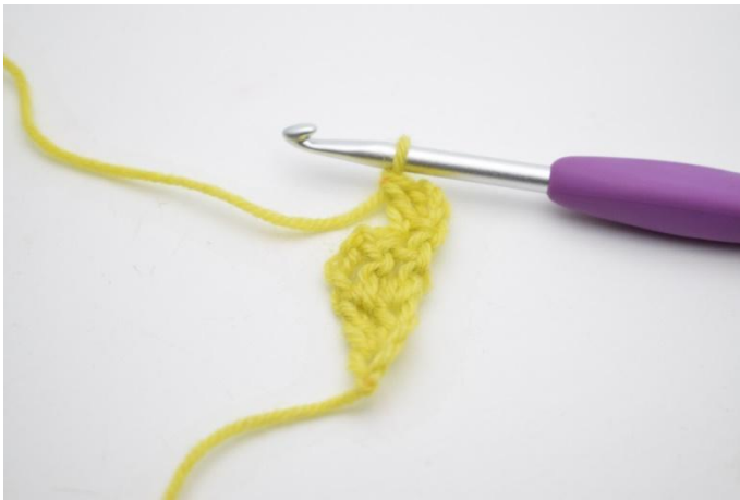
3. Så här. Det har nu virkats 1 ökning.