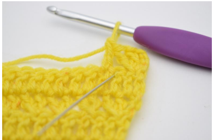
8. Nu virkas det 1 st i den mask som precis hoppades över.