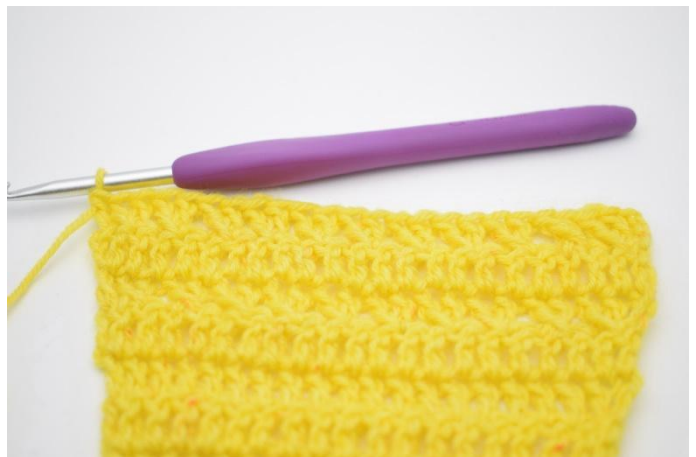
12. Det har nu virkats 1 mönsterrad.

24. Vänd med 3 lm. virka 1 st i första m. Virka st maskor varvet ut." (25)