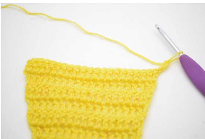
1. Vänd med 3 lm.

21. Nu ska det virkas en mönstervarv med ökning. Dessa varv virkas på följande sätt: Vänd med 3 lm. "Hoppa över 1 m och virka 1 st i nästa m. Virka 1 st i m som du precis hoppade över". Upprepa "till" varvet ut tills det är 1 m kvar. Virka 1 st i sista m. (22)