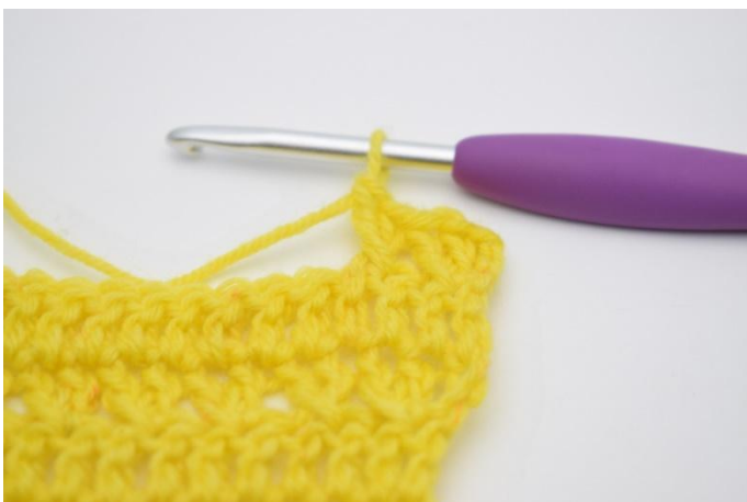
9. Så här.