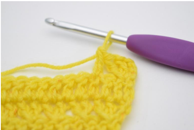
7. virka 1 st.