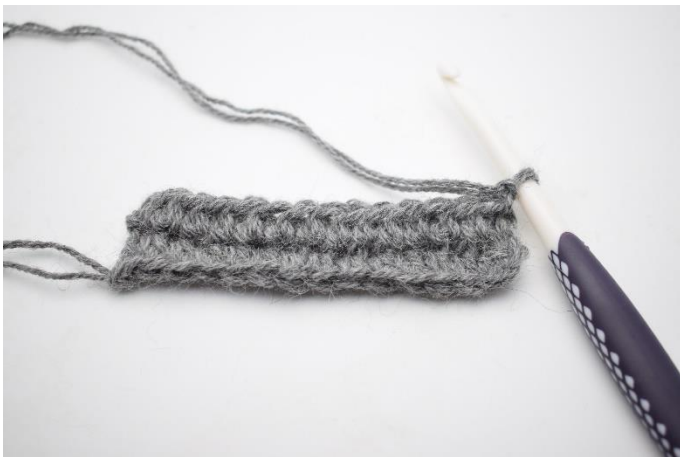
1. Upprepa metoden från varv 2. Vänd med 1 lm