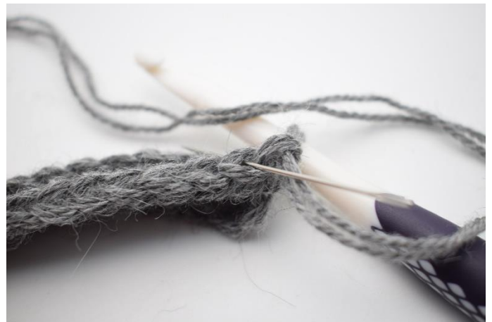
2. Virka hst i bmb. Nålen visar vilken båge du ska virka i.