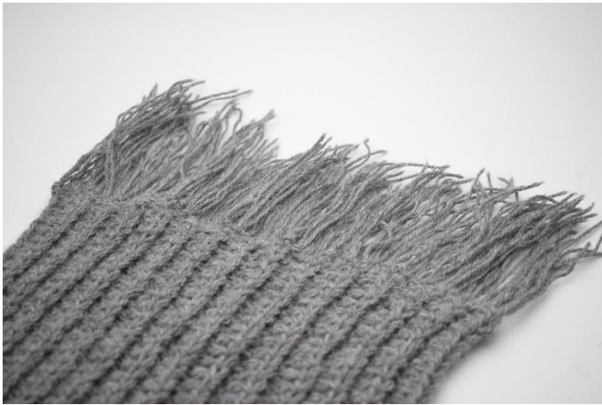
7. Upprepa längs hela kanten.