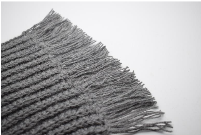
9. Upprepa på andra sidan av halsduken.