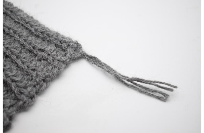
6. Dra åt lite lätt...