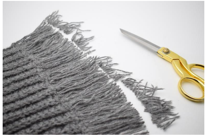
8. Klipp av ung. 1 cm så alla fransar är lika långa.