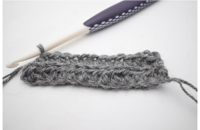
4. Virka hst i bmb varvet ut. I sista m kan man med fördel virka genom båda bågar för att undvika hål i kanten.