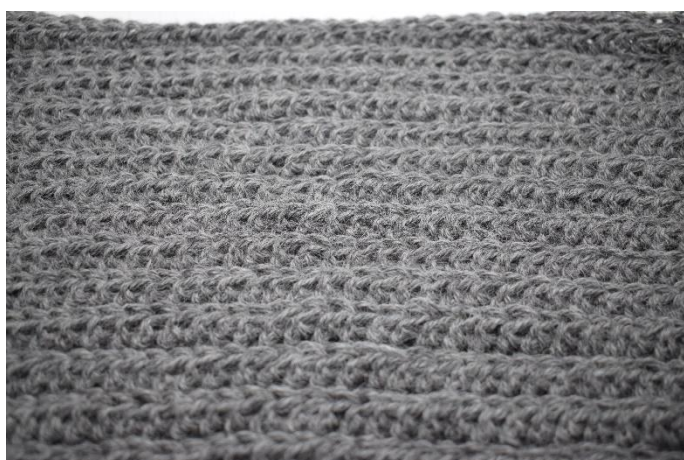
6. Upprepa metoden från varv 2, 27 gånger totalt.