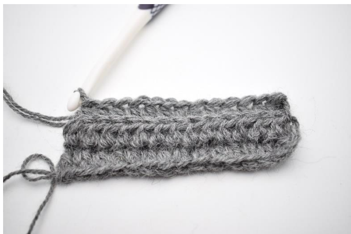
4. Upprepa varvet ut. Sista hst virkas genom båda maskbågar.