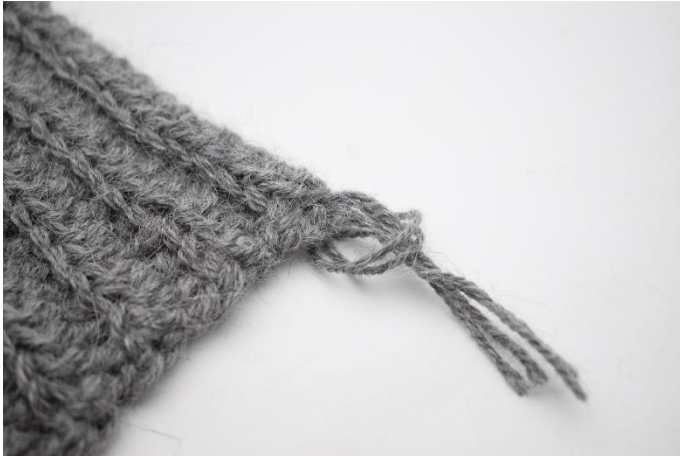
5. Dra garnändorna genom öglan.