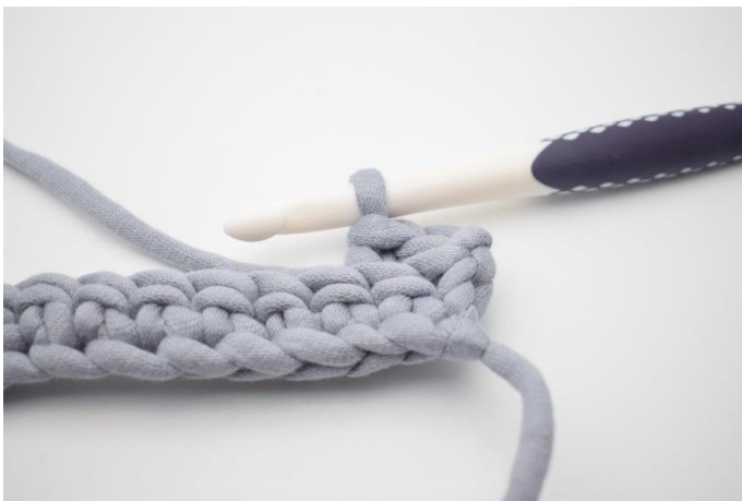
5. Så här.