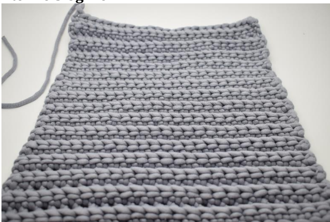
1. Upprepa varv 2 totalt 29 gånger. Klipp garnet och fäst tråden. Virka 1 del till likadant.