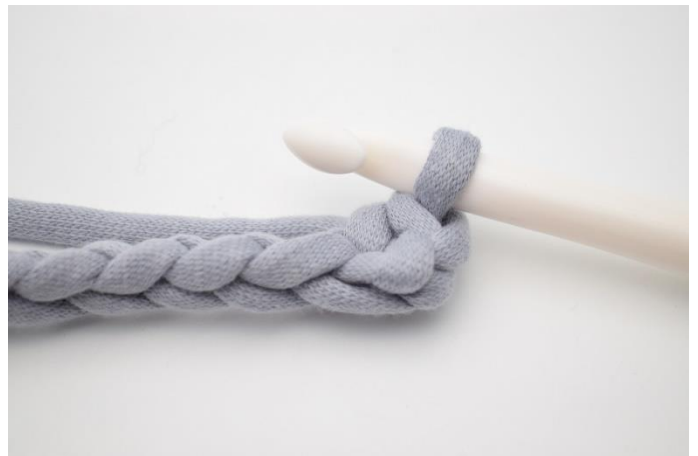
4. Så här.