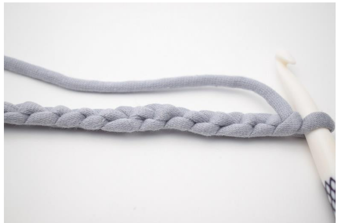
2. Vrid lm-raden så "baksidan" vänds uppåt.