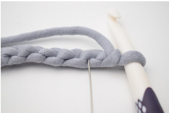
3. För en snyggare kant kan man virka 1 fm i alla i horisontella bågar. Nålen på bilden visar vilken båge 1:a fm ska virkas i.