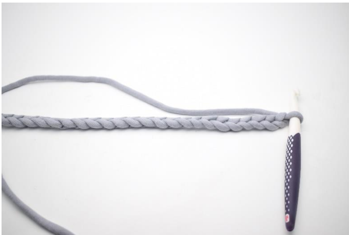
1. Lägg upp lm.