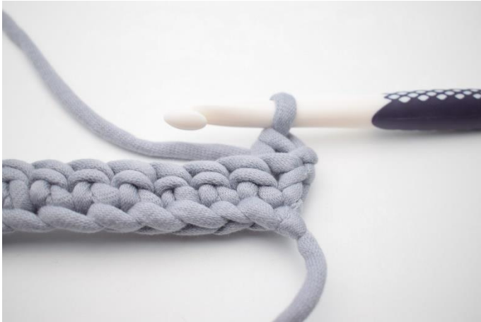
3. Så här.