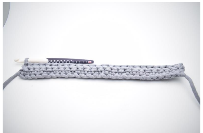
6. Upprepa varvet ut.