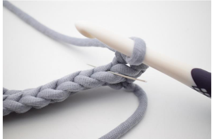
4. Virka 1 fm i bmb i nästa m. Nålen på bilden visar vilken båge dina fm ska virkas i.