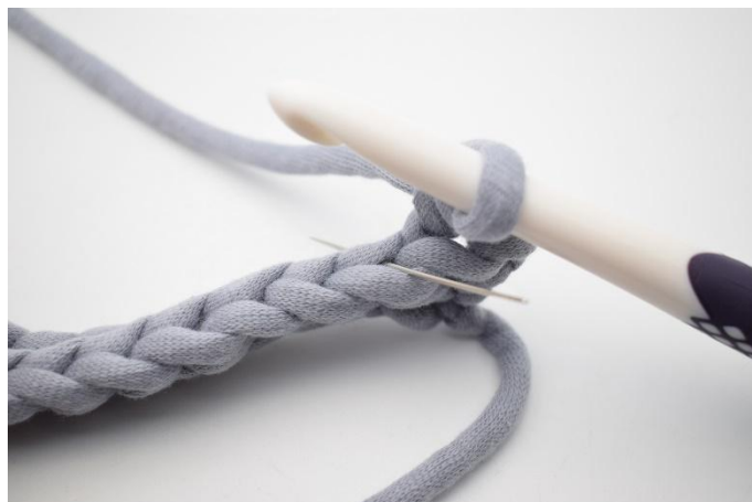
4. Virka 1 fm i bmb i nästa m. Nålen markerer här den båge din fm ska virkas i.