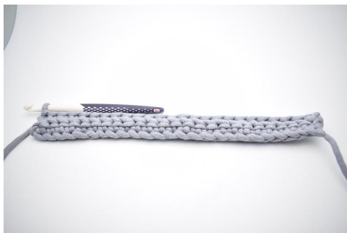
6. Upprepa varvet ut.