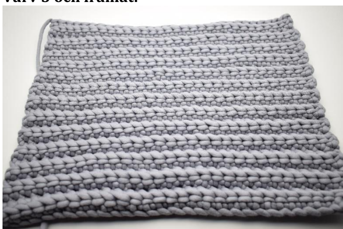
1. Upprepa varv 2 totalt 25 gånger. Klipp garnet och fäst trådarna. Virka 1 del till likadant.