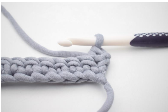
3. Så här.