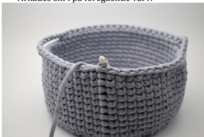
7. Virka 1 ks i återstående 10 m.