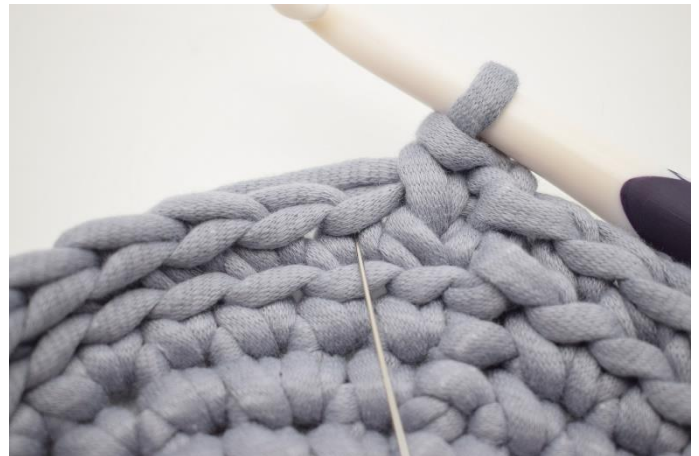
4. Virka 1 ks i nästa m. Nålen på bilden visar hur en fm ska virkas för att bli en ks.