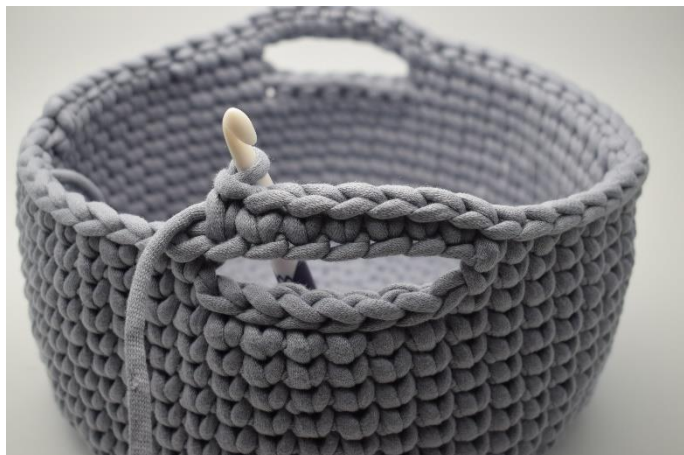
4. Virka fm i de 7 lm.