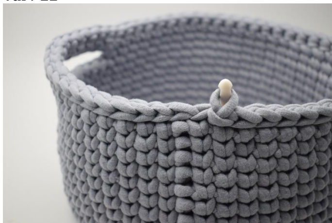
1. Virka 1 varv sm.