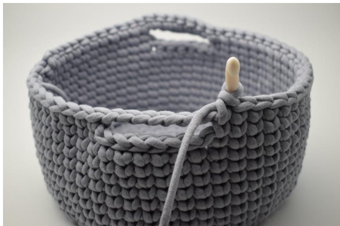
3. Virka ks i nästa 21 m.