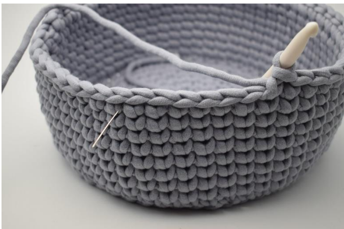
5. Virka sm i nästa 6 m där du i vanliga fall ville ha virkat ks, alltså virkas totalt 7 sm.