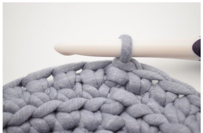
6. Upprepa ks varvet ut och avsluta med 1 sm.