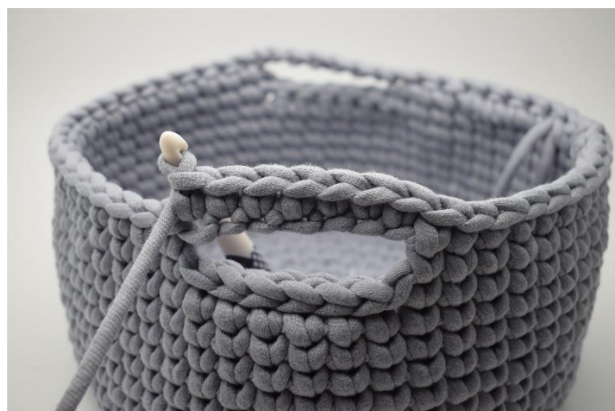
2. Virka 1 fm i de 7 lm.