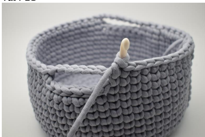
1. Virka 1 lm och virka ks i första 11 m.