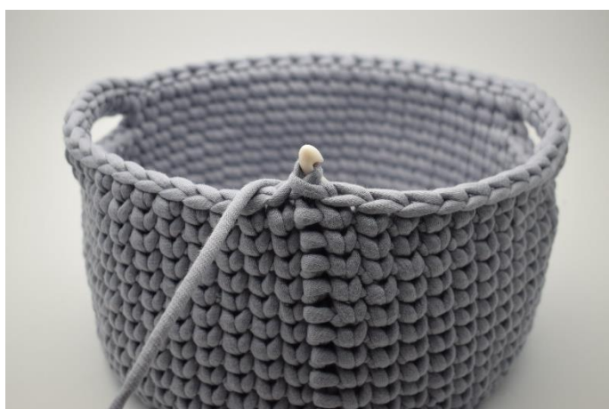
5. Virka ks i återstående 10 m.