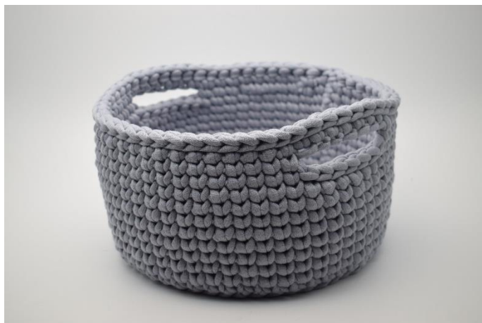
2. Klipp garnet og fäst trådarna.