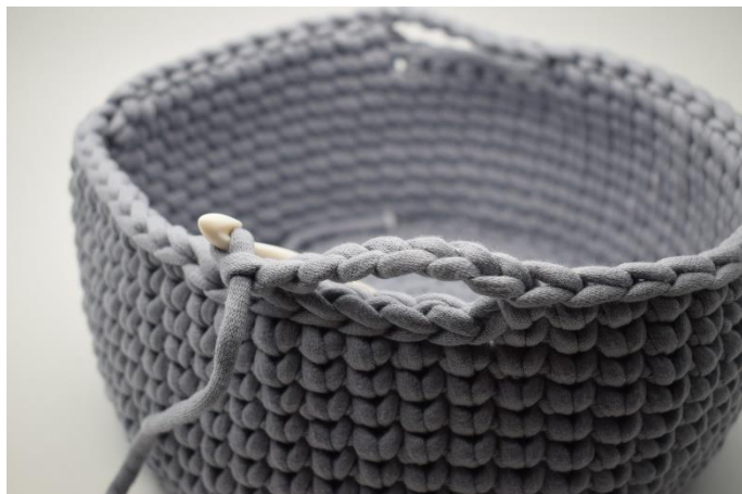
5. Virka 7 lm, Hoppa över nästa 6 m som det virkades sm i på föregående varv.