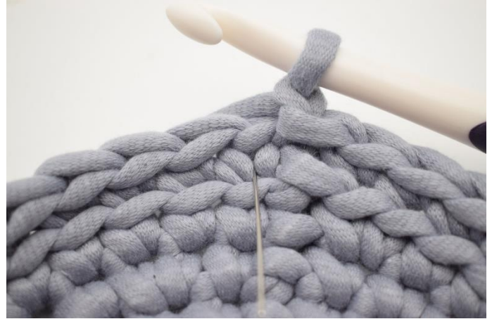
2. Nu ska det virkas ks. Ks är en vanlig fm men istället för att virka den som vanligt virkas det ner i "V:et" på maskan. Nålen på bilden visar hur din fm ska virkas för att bli en ks.