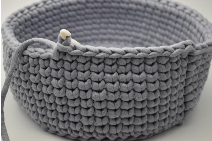
1. Virka 1 lm. Virka ks i nästa 11 m.