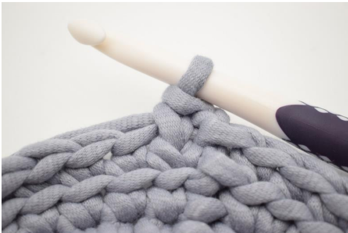
3. Sådär. Nu har du virkat 1 ks.