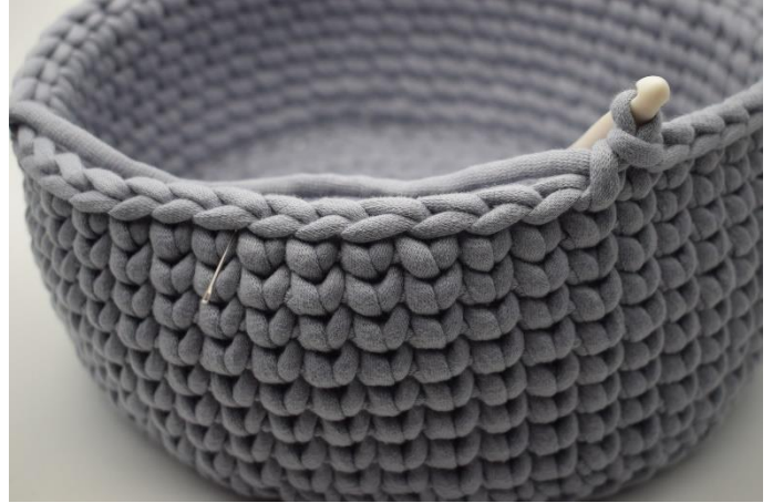
2. Virka sm i nästa 6 m där du i vanliga fall ville ha virkat ks, alltså virkas totalt 7 sm.