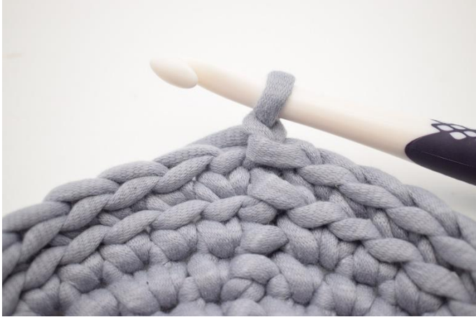
1. Virka 1 lm.