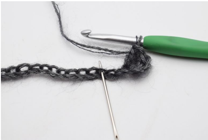
3. Hoppa över 2 lm,