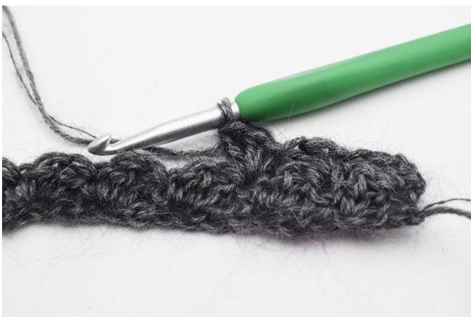
7. virka "1 fm, 2 stm i nästa m".