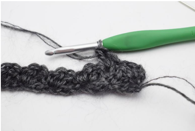
5. virka "1 fm, 2 stm i nästa m".