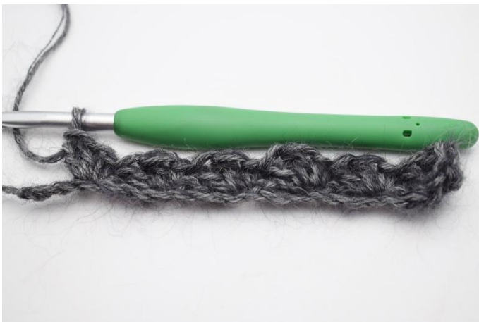
7. Hoppa över 2 lm, virka "1 fm, 2 stm" i nästa maska. Upprepa varvet ut tills du har 2 lm kvar.