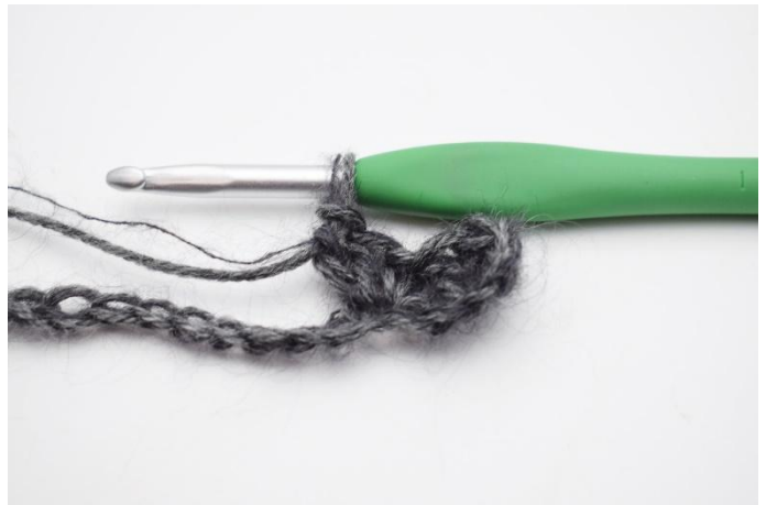
4. Virka "1 fm, 2 stm" i nästa maska.