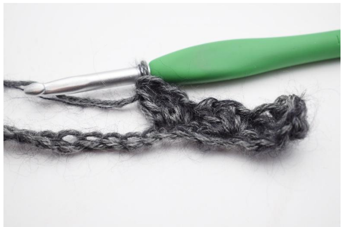
6. Virka "1 fm, 2 stm" i nästa maska.