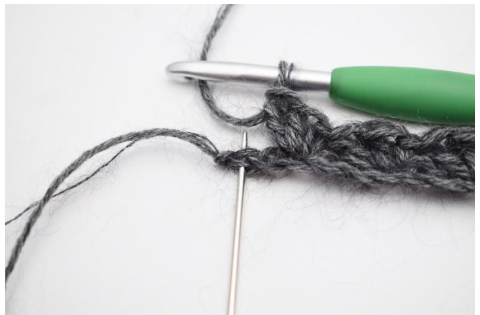
8. Hoppa över 1 lm,