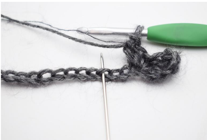
5. Hoppa över 2 lm,