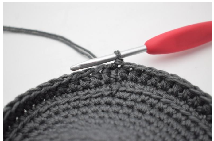
6. Gör 1 lm. Virka hst varvet runt. Avsluta med 1 sm.