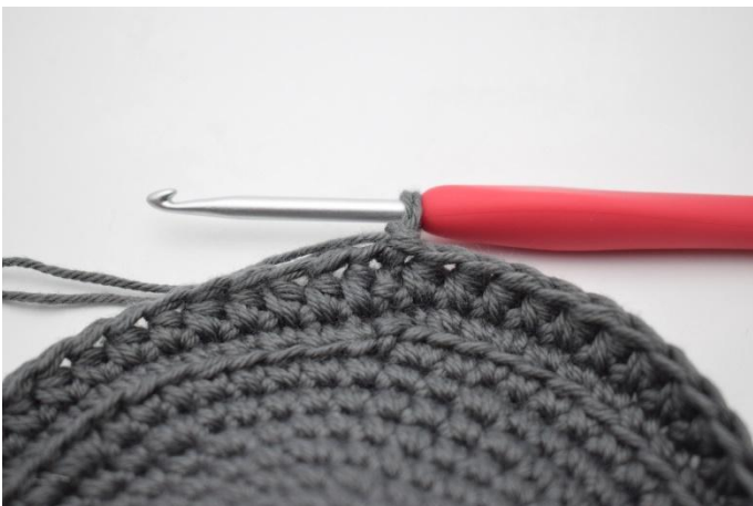
7. Gör 1 lm.