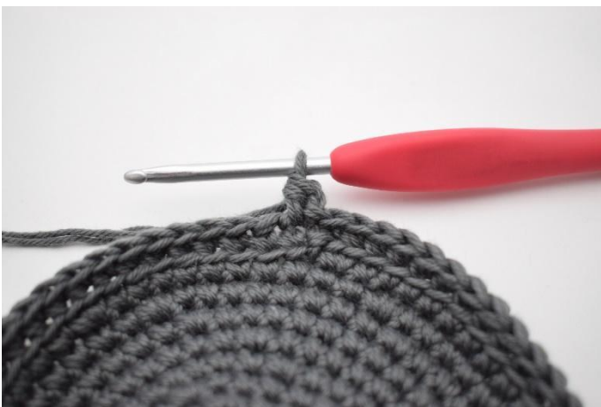
5. Virka 1 hst.