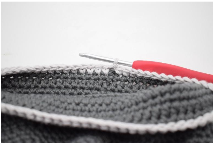
17. Byta till en kontrastfärg. Gör 1 lm. Virka fm varvet runt. Avsluta med 1 sm. Klipp garnet och fäst.