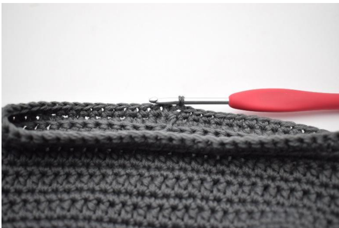
13. Gör 1 lm. Virka fm varvet runt. Avsluta med 1 sm.