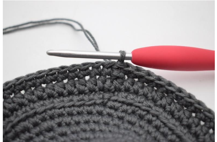
8. Virka fm varvet runt. Avsluta med 1 sm.