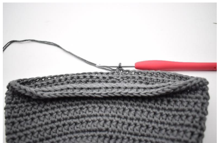
12. Avsluta med 1 sm.