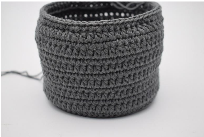
9. Upprepa dessa 2 varv som beskrivits i mönstret.