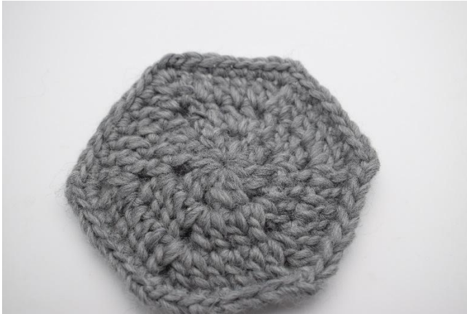
Så här ser den ut innan tovning. Mått ca. 14x15 cm