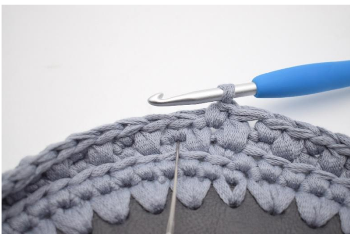
17. Virka 1 dfm i nästa m. Nålen markerar var din dfm ska virkas.