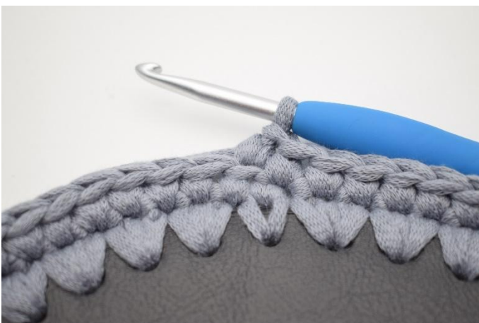
5. Så här.