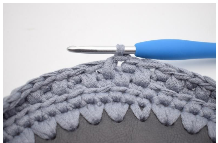
18. Så här.