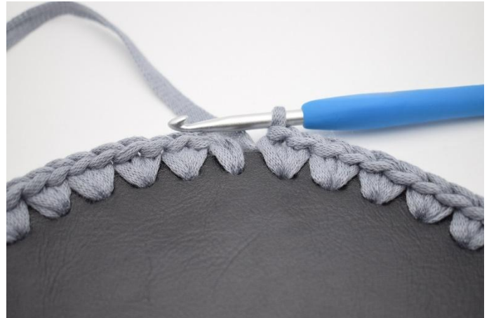
2. Så här.