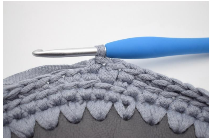
10. Virka 1 fm i nästa m.