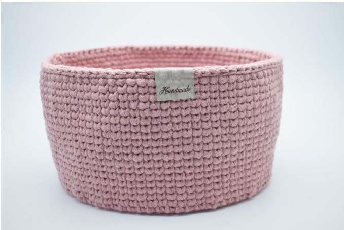
23. Sy eller limma eventuellt fast ett fräckt "Handmade" märke. Märket är vikt över kanten på korgen.