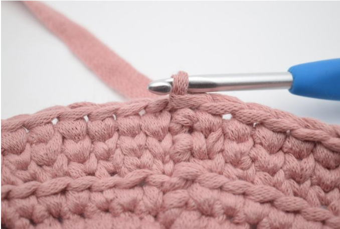
21. Så här.