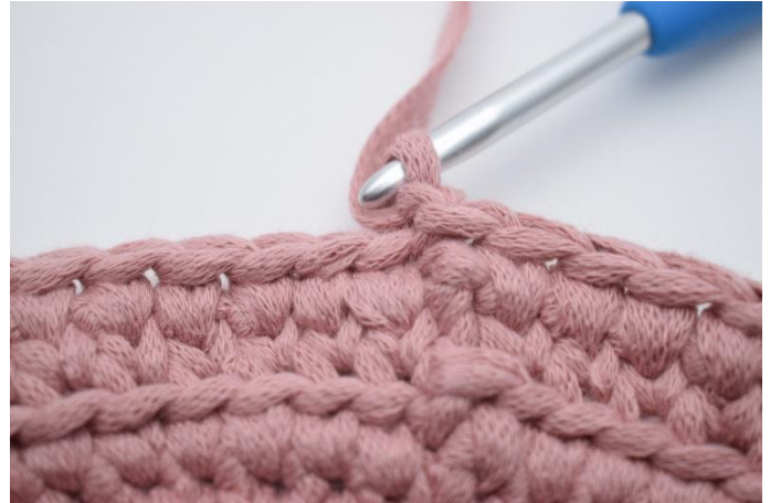
16. Gör 1 lm.