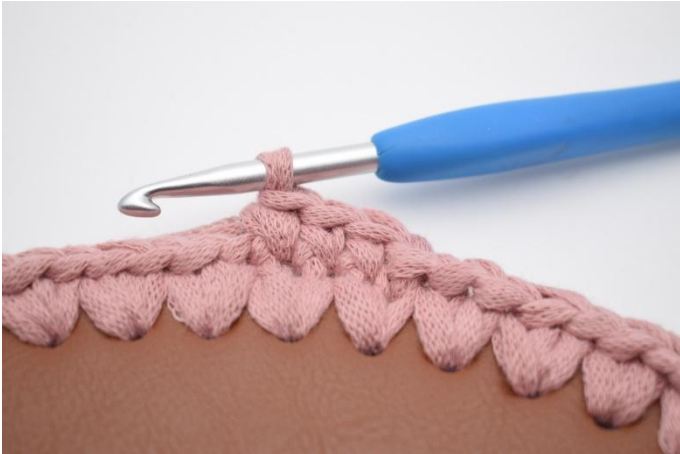
3. Gör 1 lm, virka 1 varv fm.