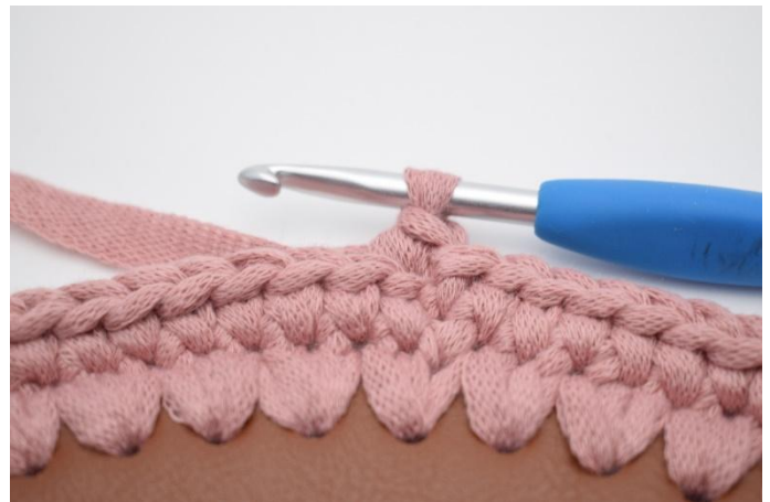
6. Så här.