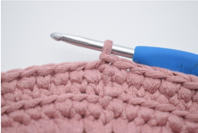
15. Så här.