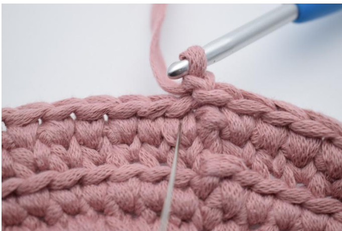
17. Virka 1 fm ner i vét på den första maskan.