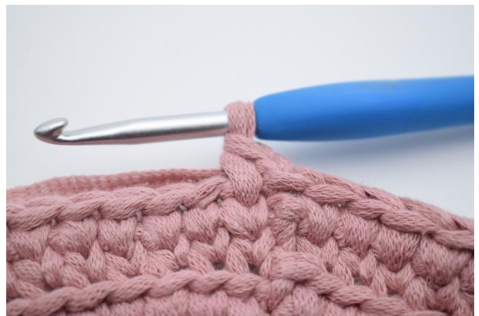
18. Så här.