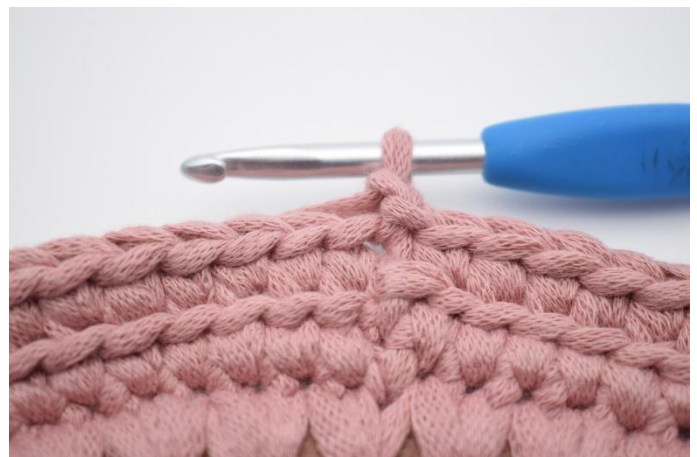
8. Gör 1 lm.