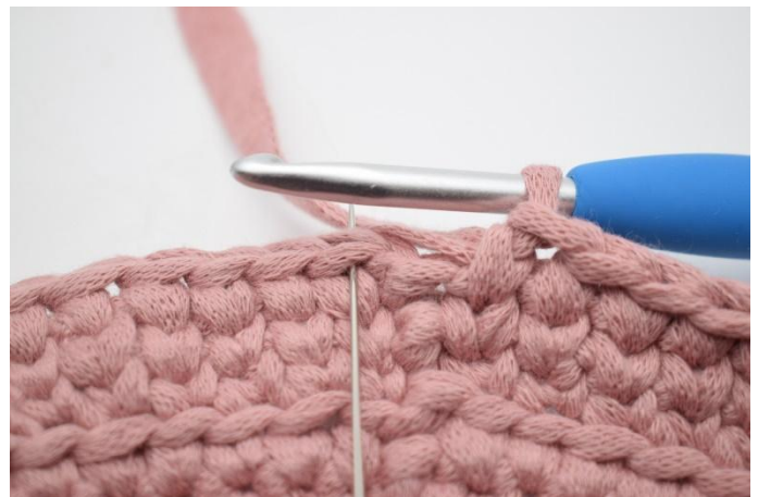
20. Avsluta med 1 sm i den första maskan från varvets början.