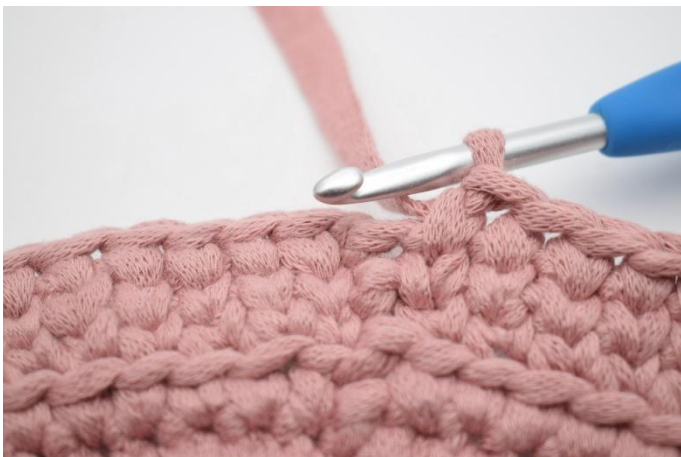
19. Upprepa varvet runt.