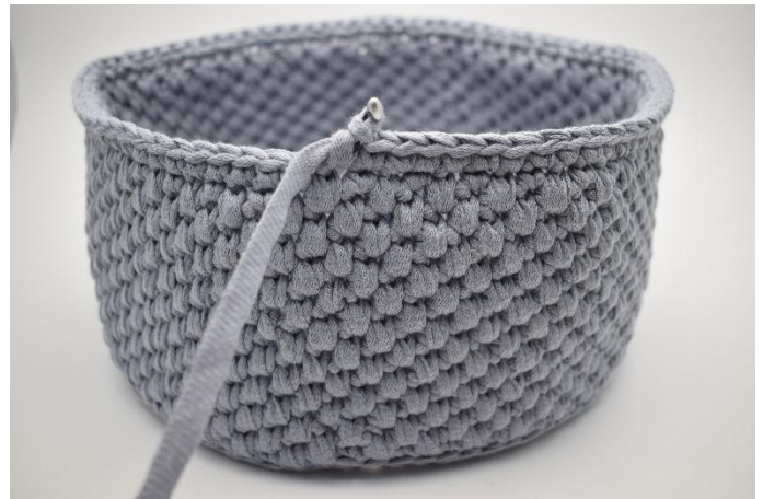
22. Virka 1 varv fm.