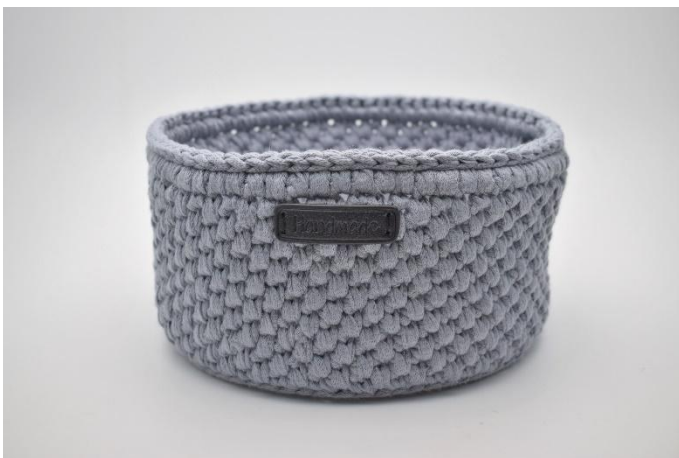
27. Sy fast "Handmade" märket med nål och tråd.