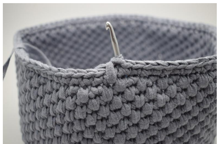
24. Så här.