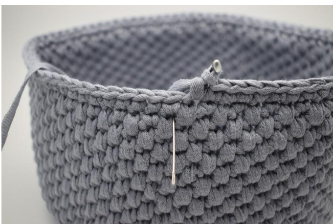
23. Virka 1 varv dfm. Nålen markerar var din dfm ska virkas..