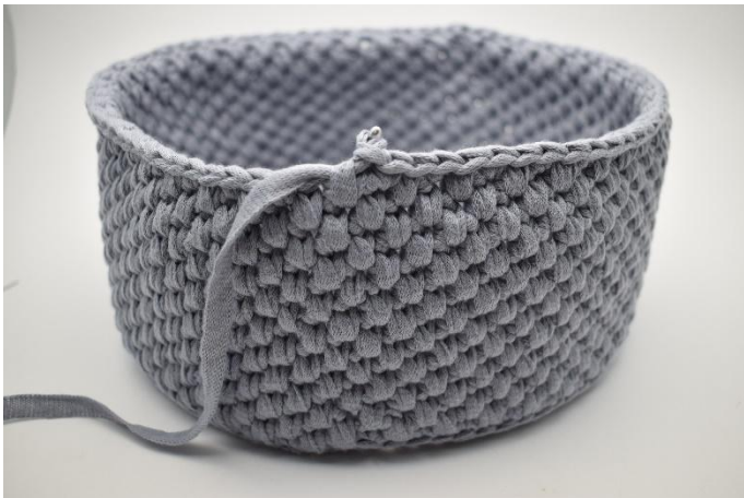
21. Upprepa dessa rader som beskrivits i mönstret.