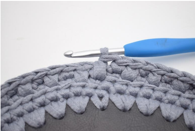
15. Så här.