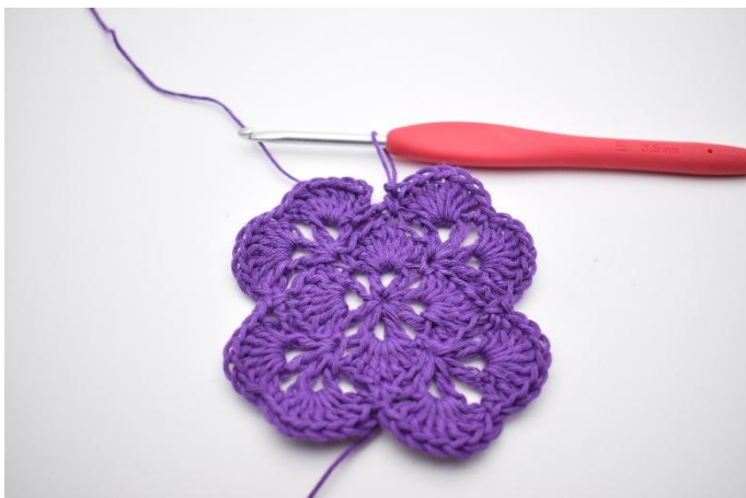
17. Upprepa detta varvet runt.