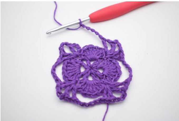
11. Upprepa varvet runt.