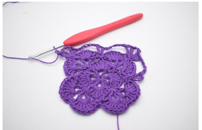
12. Så här. Det har nu bildats 2 V med 3 lm mellan dem, och ännu ett hörn är gjort.