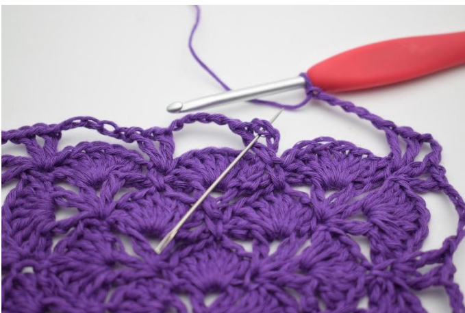
7. Gör 1 sm i lm-mellanrummet i första V.