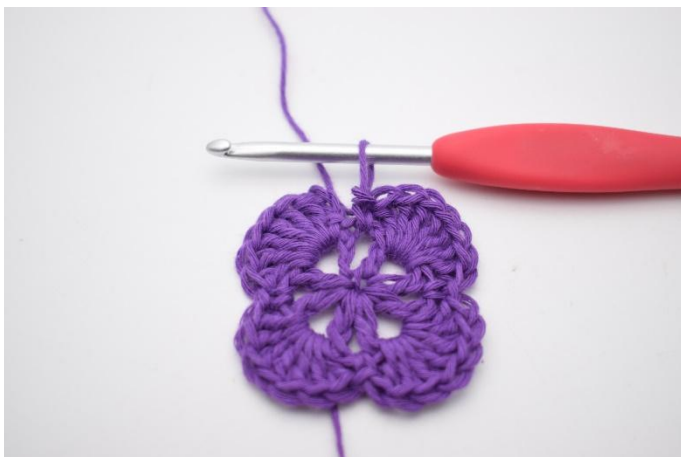
11. Upprepa varvet runt.