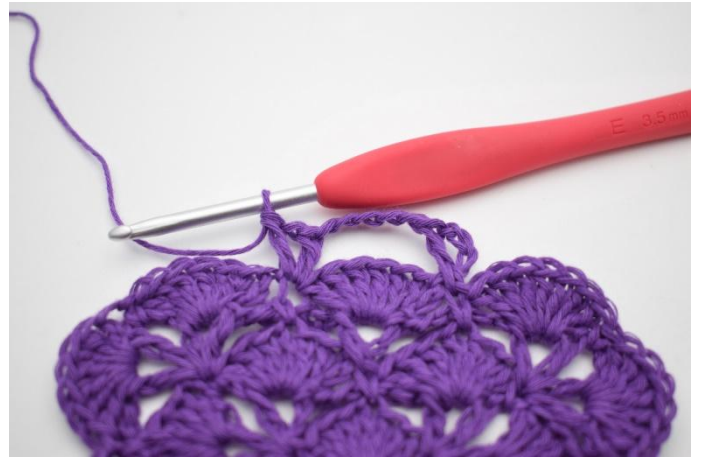
4. Gör 5 lm. Virka 1 st, 1 lm och 1 st i nästa fm. Det har nu bildats ytterligare ett V.