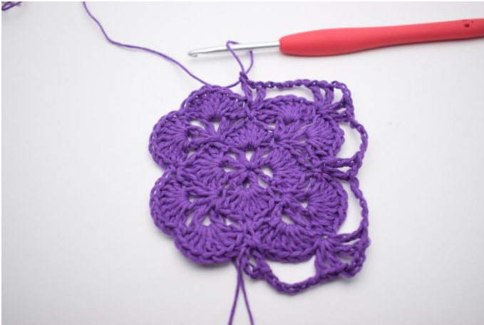
13. Gör 5 lm. I nästa fm virkas 1 st, 1 lm, 1 st. Det har nu bildats ytterligare ett V.