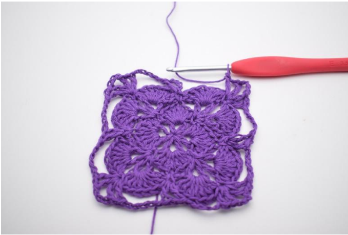
15. Upprepa varvet runt.