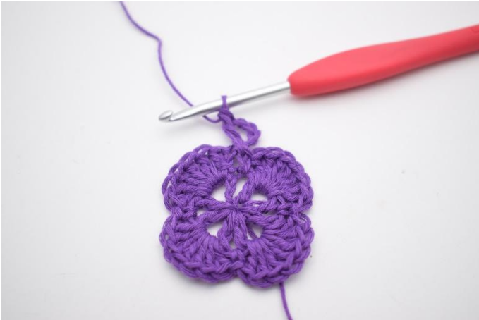
3. Så här. Det har nu bildats ett V.