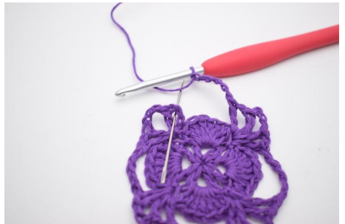
12. Avsluta med 1 sm i lm-mellanrummet i det första V.