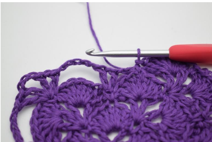
11. Så här.