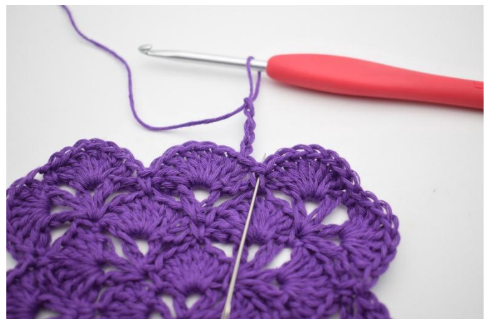
2. 1 fm bredvid virkas 1 st.