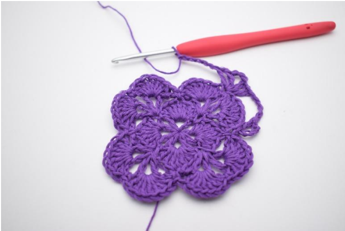
7. Gör 5 lm.