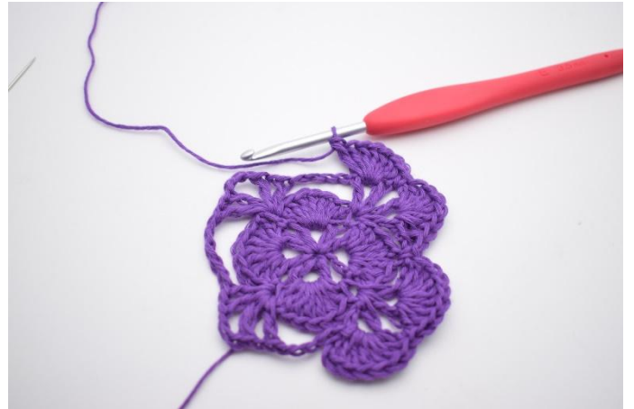
14. Så här.