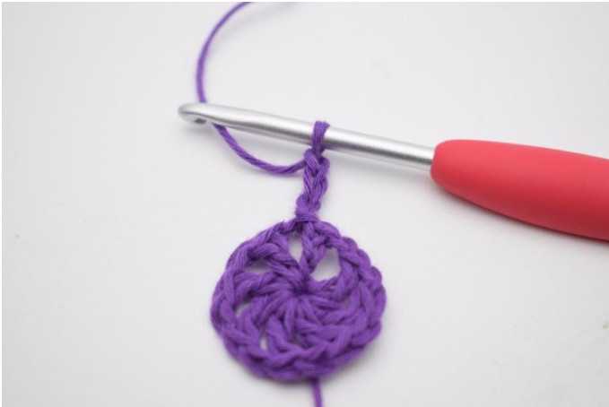
3. Gör 3 lm, virka 6 st ner i lm-mellanrummet.