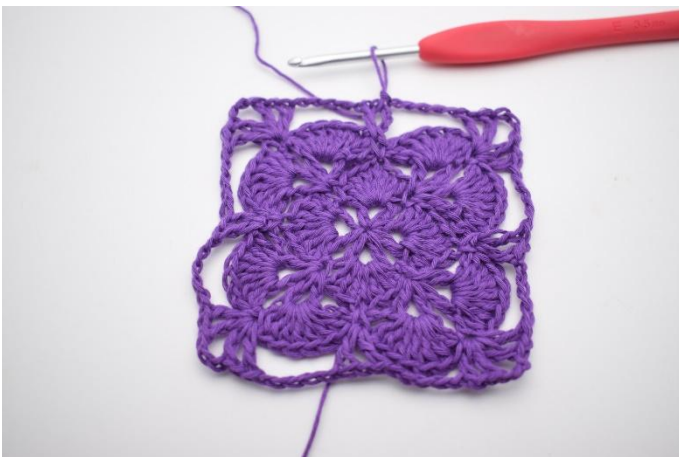
17. Så här.