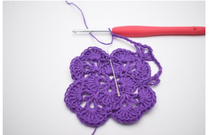
8. I nästa fm virkas 1 st, 1 lm, 1 st.