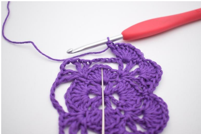
15. Nu ska nästa stora lm-båge länkas fast. Virka 1 fm i den 4.e st i stolp-maskgruppen på förra varvet.