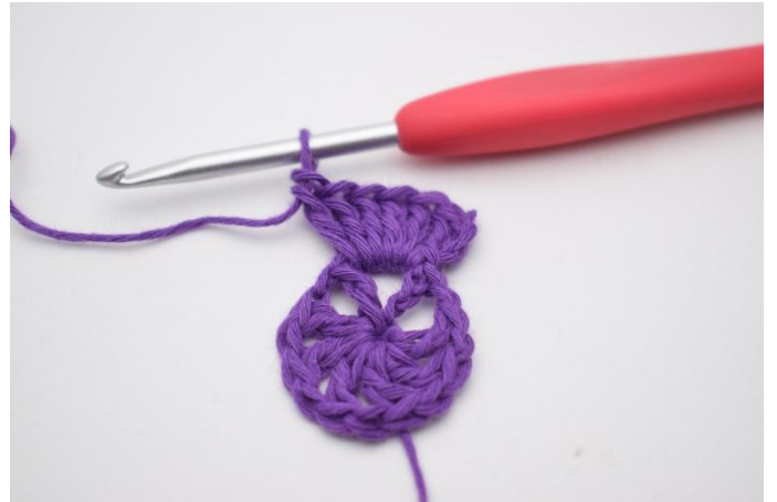
4. Så här.