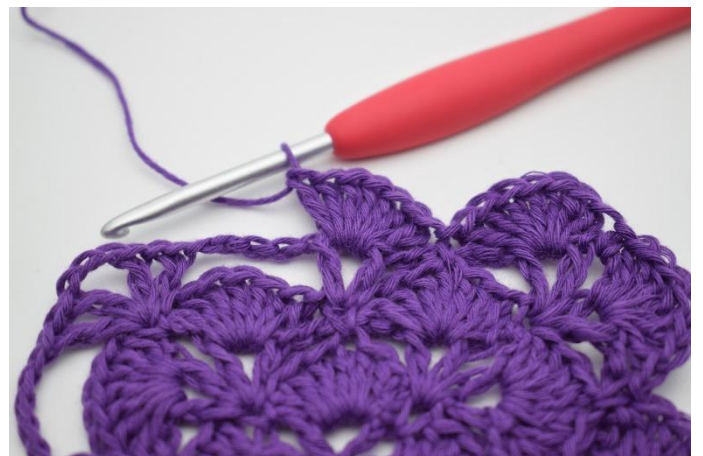
12. I nästa V virkas det 7 st.