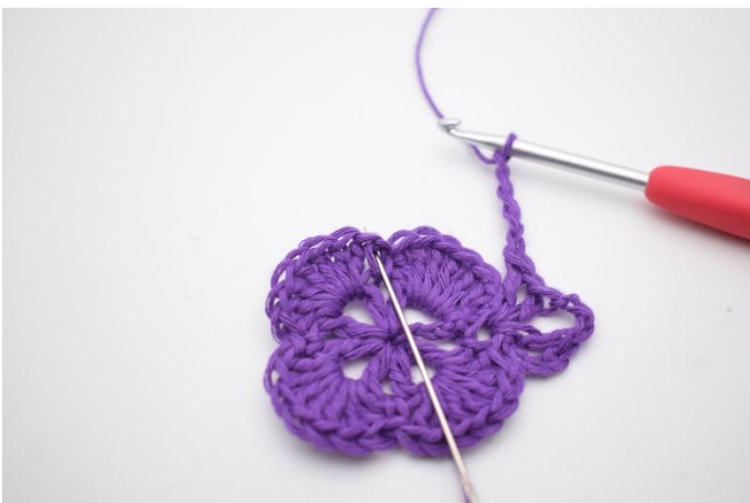
7. I nästa fm virkas 1 st, 1 lm, 1 st, 3 lm, 1 st, 1 lm och 1 st.