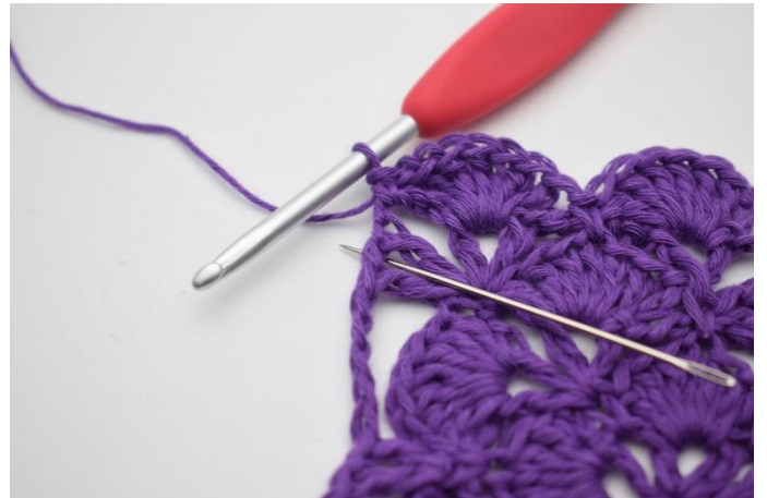
8. I nästa V virkas det 7 st.