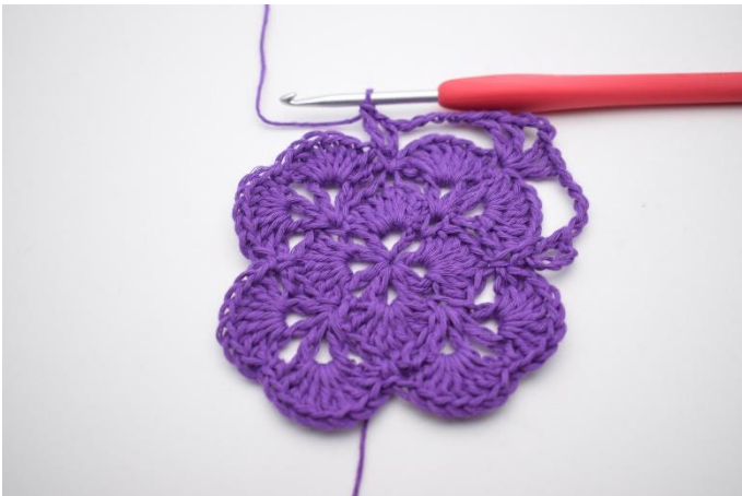
9. Det har nu bildats ett V.