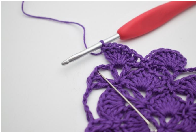
7. I lm-bågen virkas 1 fm.