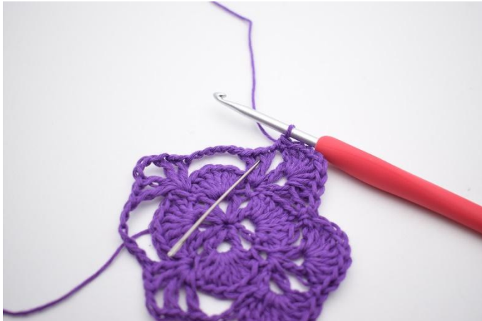
13. I nästa V virkas det 7 st.