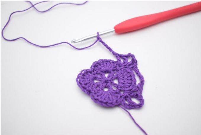
9. Gör 5 lm.