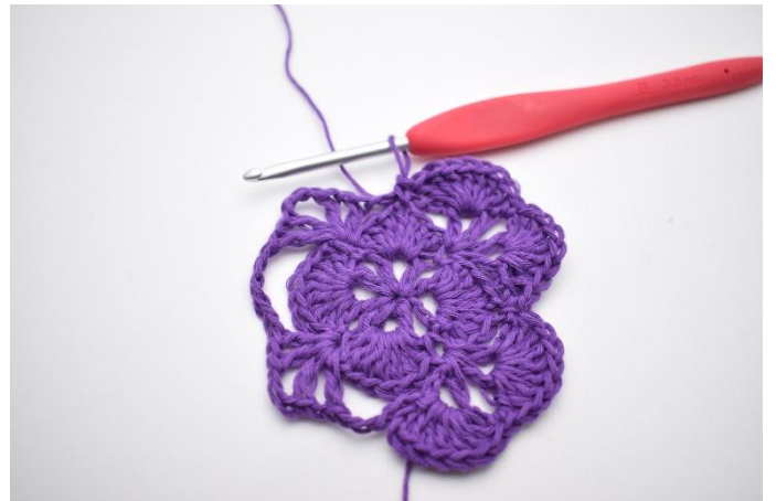
16. Så här.