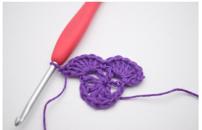
8. Så här.