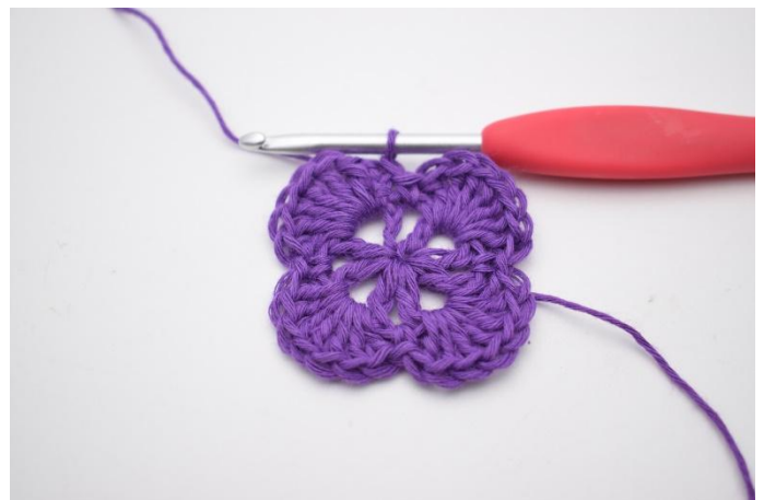
12. Avsluta med 1 sm i den översta av de 3 lm. 13.