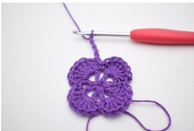
1. Gör 4 lm.