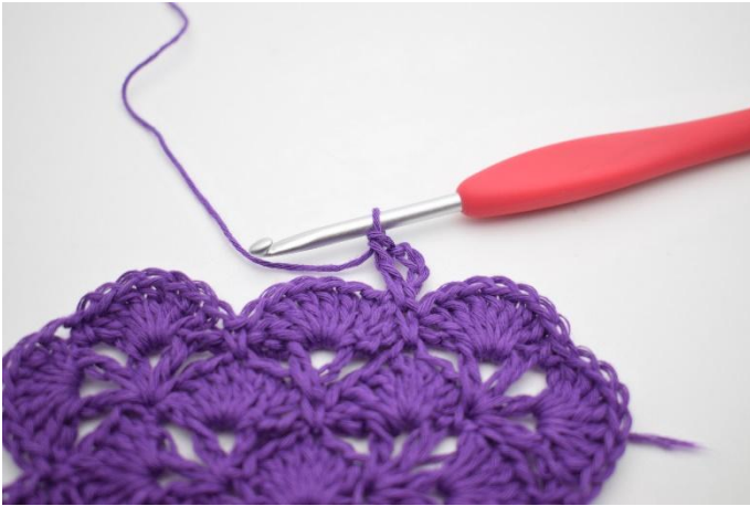
3. Så här. Det har nu bildats ett V.