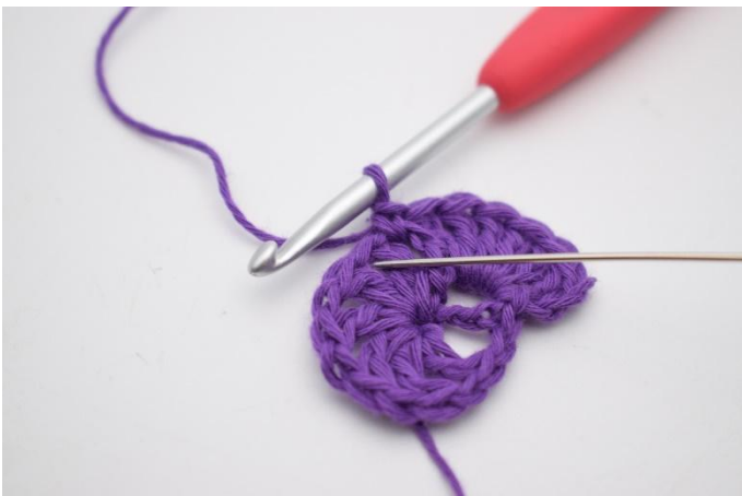
7. I nästa lm-mellanrum virkas 7 st.