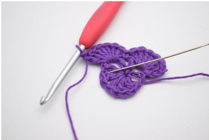
9. I nästa lm-mellanrum virkas 1 fm.