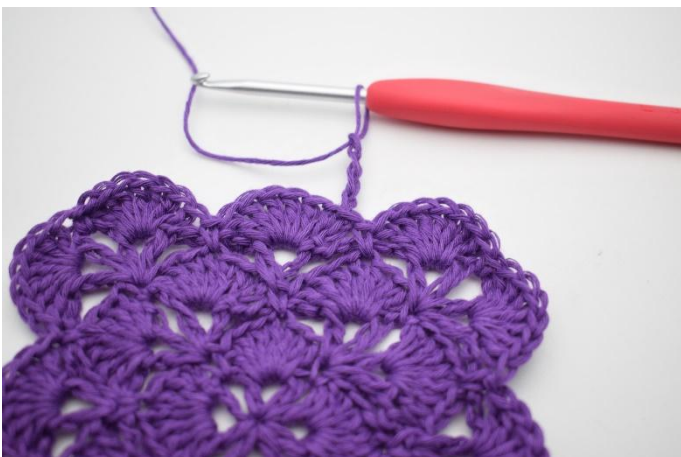
1. Gör 4 lm.