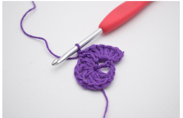
6. Så här.