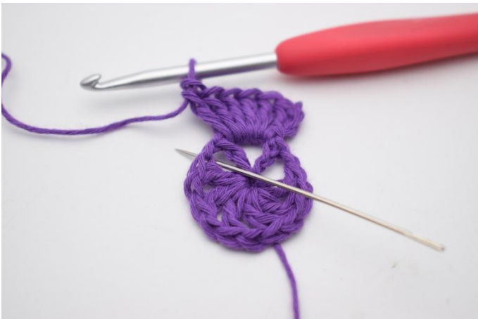
5. I nästa lm-mellanrum virkas 1 fm.