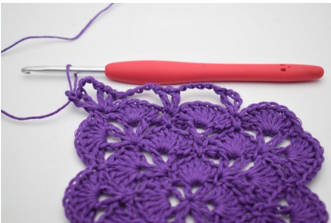
5. Gör 5 lm. Nu ska det virkas V i hörnet. Virka 1 st, 1 lm, 1 st, 3 lm, 1 st, 1 lm och 1 st och 1 st i nästa fm.