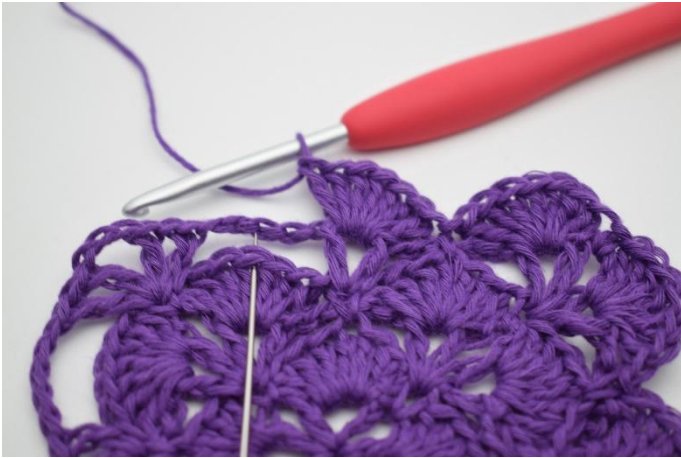
13. Den nästa stora lm-bågen länkas fast. Detta görs genom att virka 1 fm i den 4.e st i stolpmaskgruppen på förra varvet.