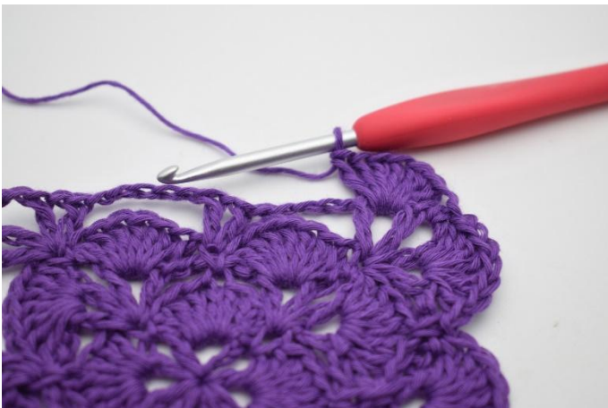
9. Så här. det har nu virkats 2 stolpmaskgrupper i det första hörnet.