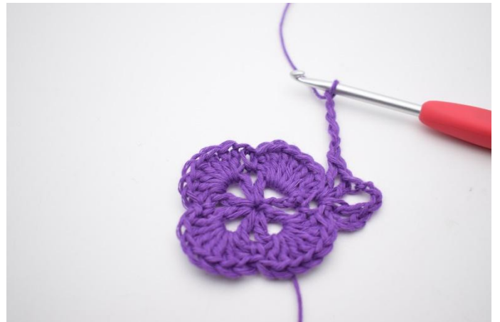
6. Gör 5 lm.