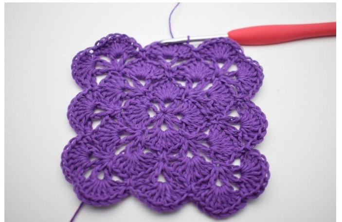
16. Avsluta med 1 sm i den översta av de 3 lm från varvets början.