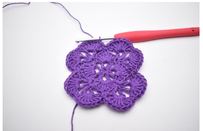
18. Avsluta med 1 sm i den översta av de 3 lm från varvets början.