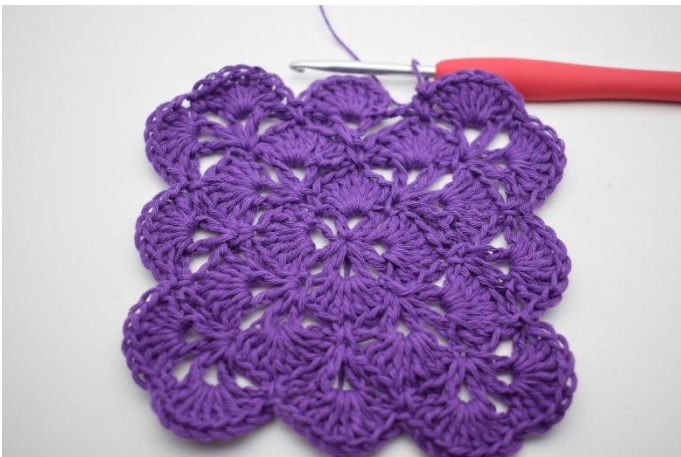
15. Upprepa varvet runt.