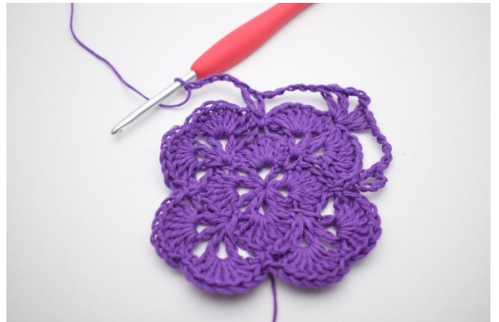
10. Gör 5 lm.