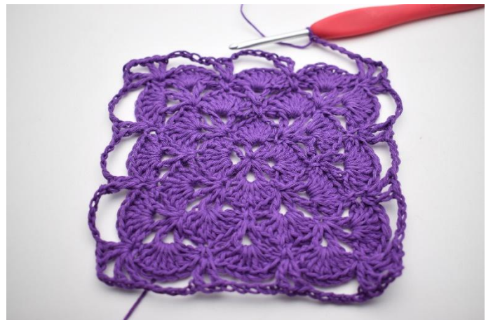
6. Upprepa detta varvet runt.