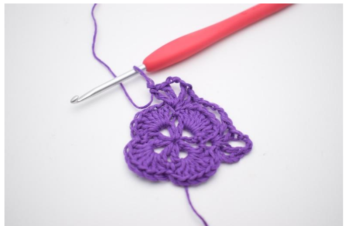
8. Så här. Det har nu bildats 2 V med 3 lm mellan dem, och ännu ett hörn är gjort.