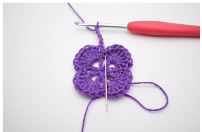
2. I fm bredvid virkas 1 st.