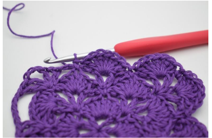
14. Så här. Det har nu virkats stolpmaskgruppen i V maskorna på sidorna.