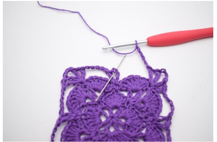
16. Gör 5 lm, och avsluta med 1 sm i lm-mellanrummet i det första V.