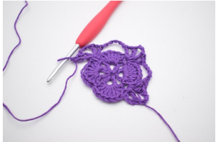
10. I nästa fm virkas 1 st, 1 lm, 1 st, 3 lm, 1 st, 1 lm och 1 st. Det har nu bildats 2 V med 3 lm mellan dem, och ännu ett hörn är gjort.