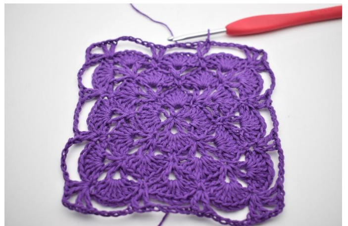
8. Så här.