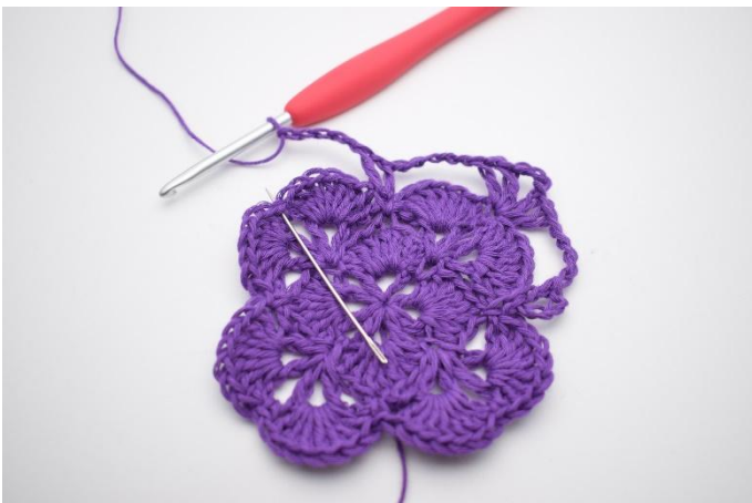
11. I nästa fm virkas 1 st, 1 lm, 1 st, 3 lm, 1 st, 1 lm och 1 st.