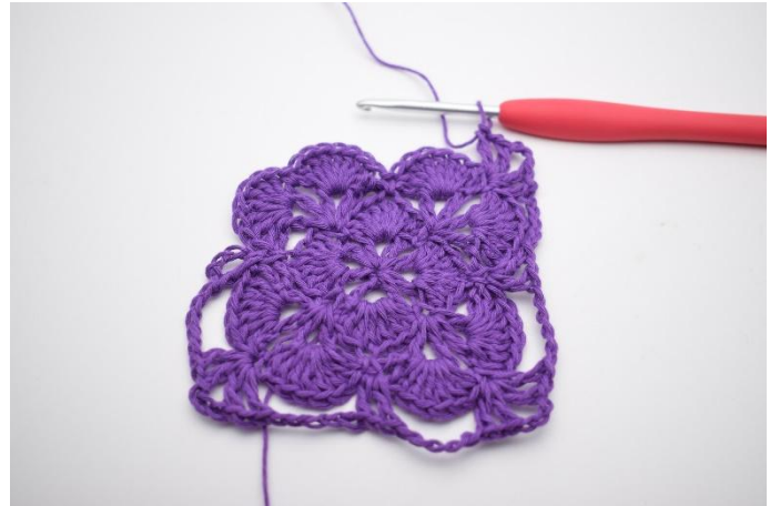
14. Gör 5 lm, i nästa fm virkas 1 st, 1 lm, 1 st, 3 lm, 1 st, 1 lm och 1 st. Det har nu bildats 2 V med 3 lm mellan dem, och ännu ett hörn är gjort.