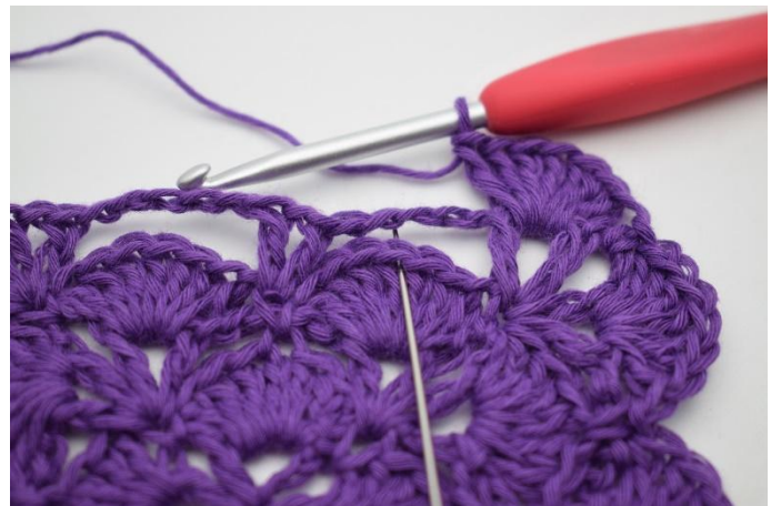
10. Den nästa stora lm-bågen ska nu länkas fast. Detta görs genom att virka 1 fm i den 4.e st i stolpmaskgruppen på förra varvet