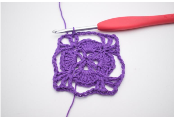
13. Så här.