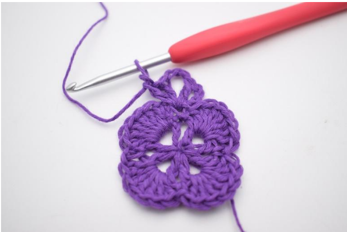
5. Virka 1 st, 1 lm och 1 st ner i samma maska. Det har nu bildats ytterligare ett V med 3 lm mellan. Detta är ett hörn.