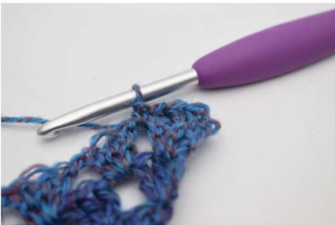
5. Så här.