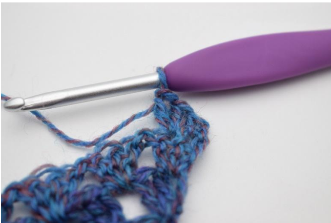
3. Så här.