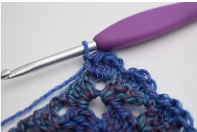
11. Virka virkas 1 fm, 3 st och 1 fm i lm-bågen.