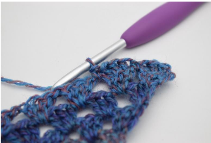
9. Så här.