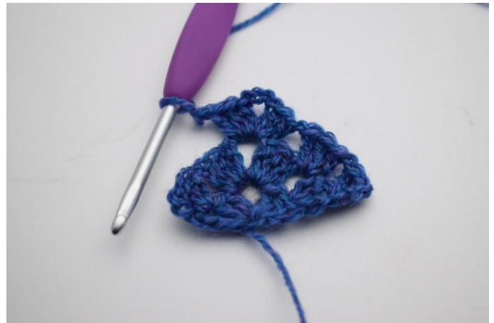
12. Virka "1 stgr, 3 lm, 1 stgr i lm-bågen".