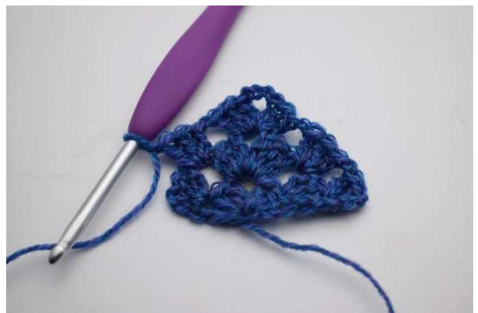
14. Virka 1 stgr.