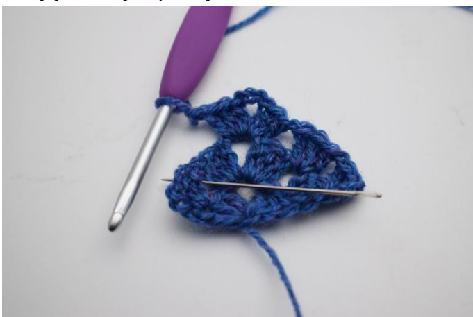
13. Gör 1 lm, nu virkas i nästa lm-mellanrum