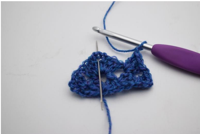
11. Gör 1 lm. Nu ska det virkas i lm-bågen (spetsen på sjalen).