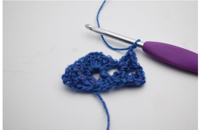
10. Virka 1 stgr i nästa lm-mellanrum.