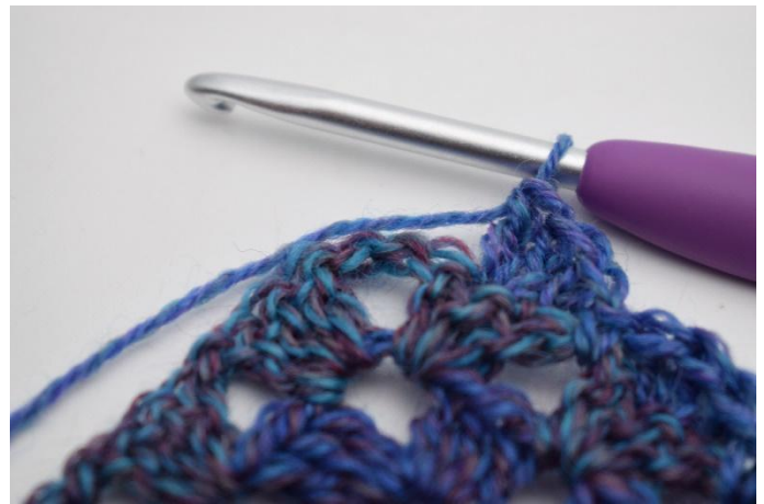
10. Upprepa fram till spetsen/lm-bågen.