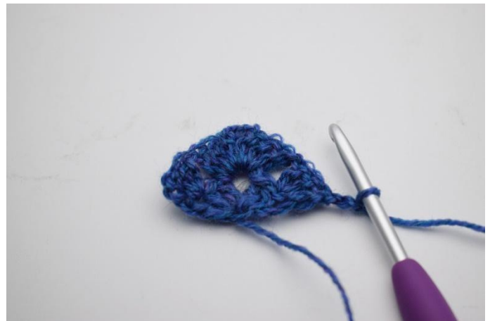
8. Vänd arbetet och gör 3 lm (ersätter 1.a st)