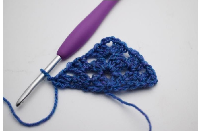
16. Virka 1 stgr.