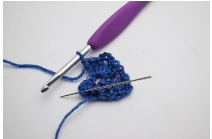
6. Gör 1 lm. Virka 1 stgr i 3.e lm från förra varvet.