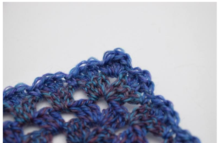
12. Upprepa nu "Hoppa över 1 m och virka 3 st i den mittersta m i stgr. Hoppa över 1 m och virka 1 fm i lm-mellanrummet" varvet runt. Klipp garnet och fäst trådarna.