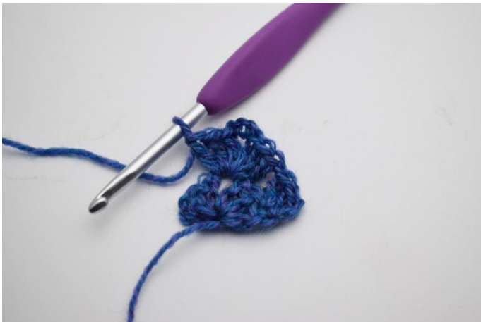
5. 3 lm, och 1 stgr i lm-bågen".