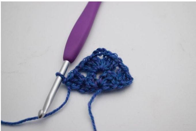
7. Virka 1 stgr.