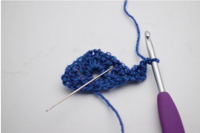
9. Virka 2 st i första maskan, nu har det bildats 1 st grupp med 3 st. Gör 1 lm.