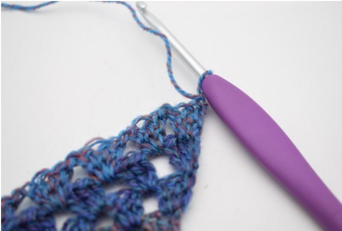
1. Vänd med 1 lm.