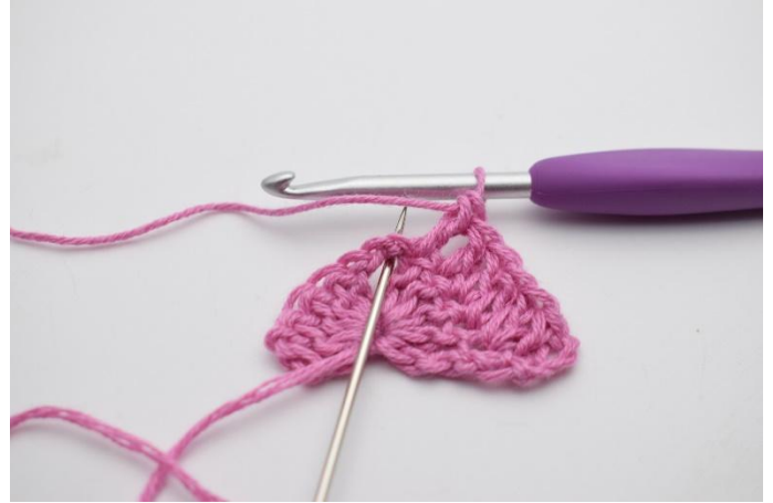
4. I lm-bågen virkas 2 st, 2 lm, 2 st.