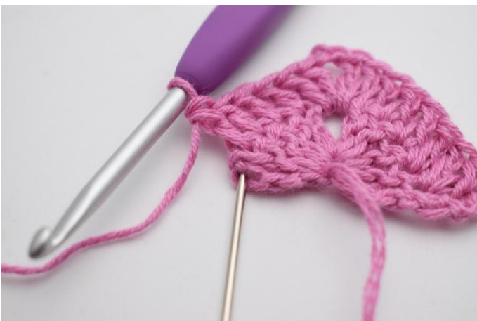
7. I sista m virkas 2 st och 1 dbst.