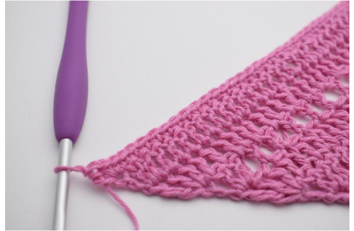
4. Virka fm i alla maskor varvet ut. I sista m virkas 2 fm och 1 hst.