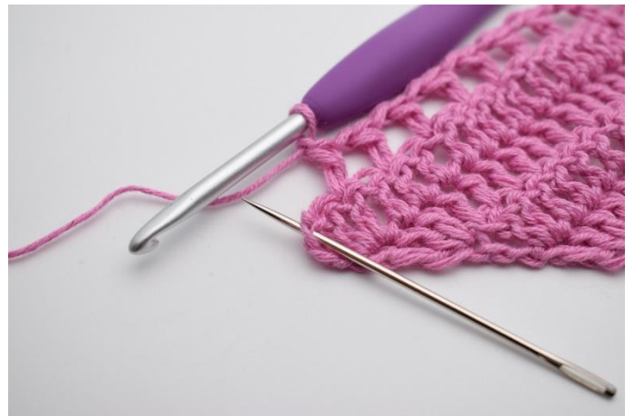
10. Gör 1 lm, hoppa över 1 m, virka 2 st och 1 dst i sista st.