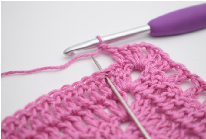
7. "Gör 1 lm, hoppa över 1 m, virka 1 st i nästa m".