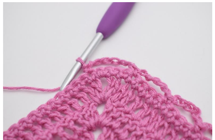
4. Upprepa "till" fram till spetsen. I spetsen görs 6 lm, hoppa över 5 m, virka 1 fm i nästa m.