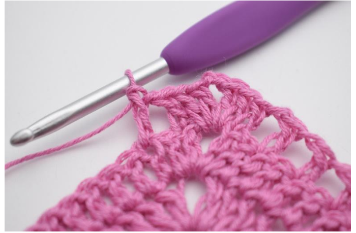
8. Så här.