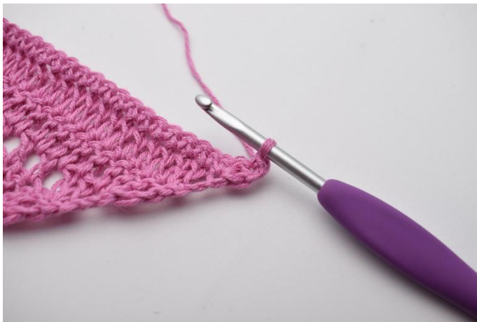
1. Vänd med 1 lm. Virka 1 fm i första m.