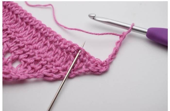
2. "Gör 5 lm, hoppa över 3 m och virka 1 fm i nästa m".