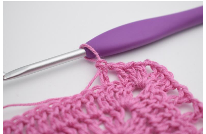
8. Så här.