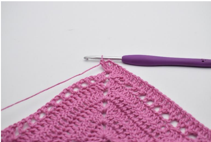
3. I lm-bågen virkas 2 st, 2 lm, 2 st.