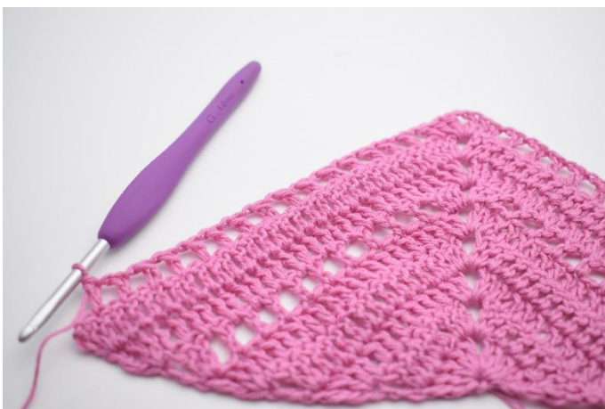
9. Upprepa "till" totalt 15 gånger.