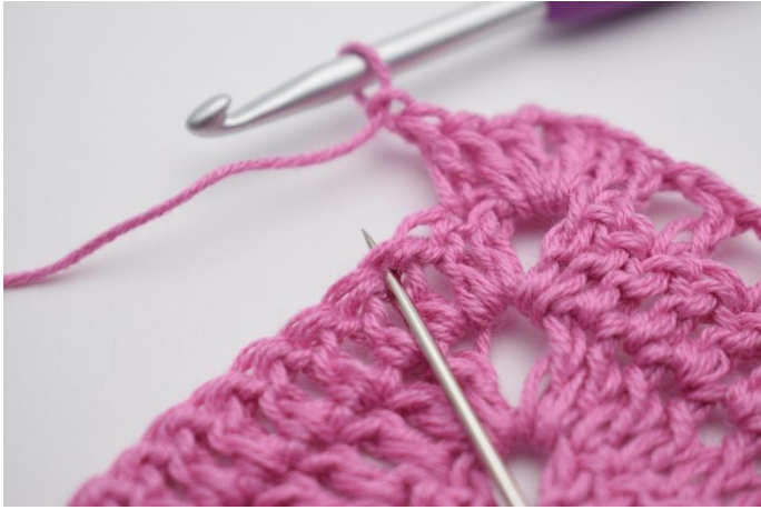
7. "Gör 1 lm, hoppa över 1 m, virka 1 st i nästa m".