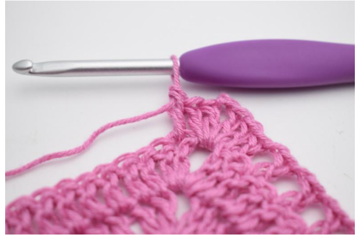
6. Virka 1 st i nästa m.