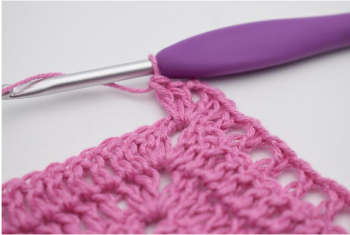
5. I lm-bågen virkas 2 st, 2 lm, 2 st.