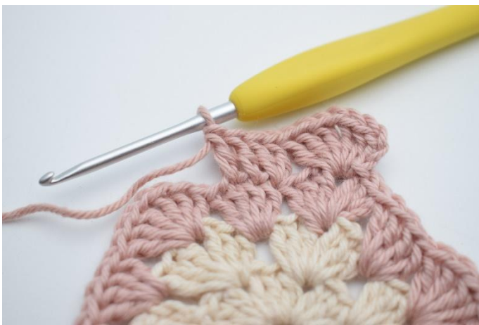
5. Virka 1 st i de nästa 2 m.