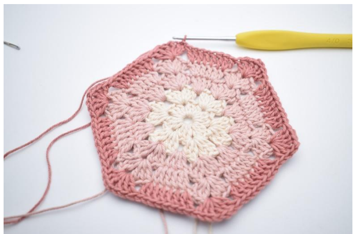
10. Upprepa "till" 5 gånger. Avsluta med 1 sm.