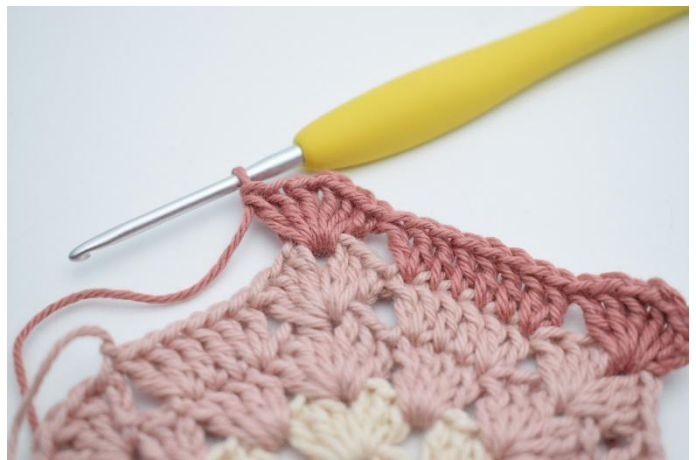
8. "Virka 3 st, 1 lm, 3 st i nästa lm-mellanrum,