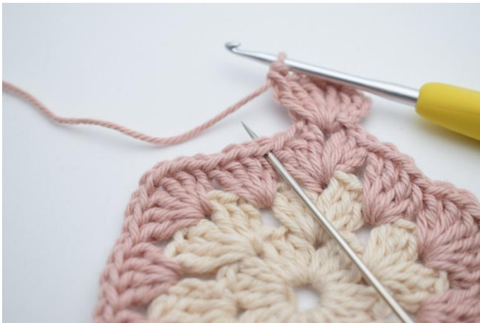
3. Hoppa över 3 m, virka 2 st i nästa m.