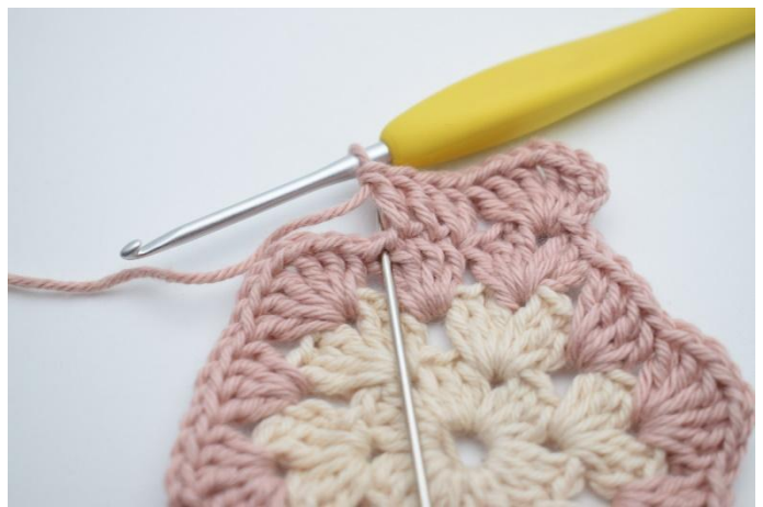
6. Virka 2 st i nästa m.