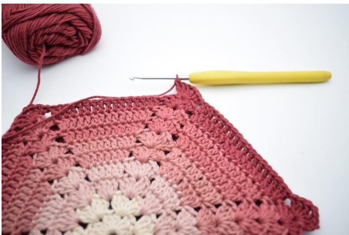
9. Gör 3 lm (ersätter 1 st). Virka 2 st, 1 lm, 3 st i mellanrummet.