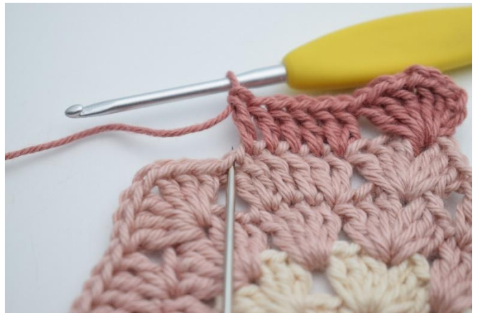
6. Virka 2 st i nästa m.