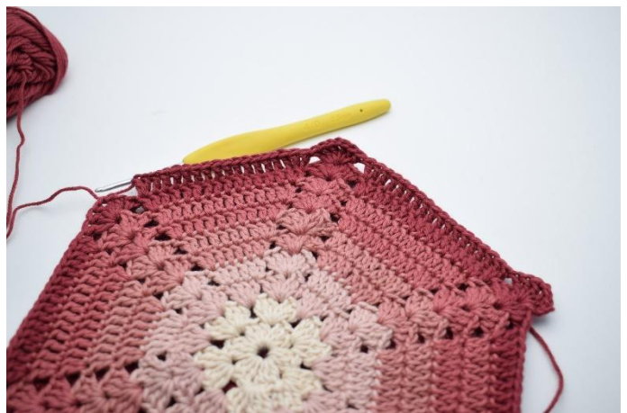
10. Hoppa över 3 m, virka 2 st i nästa m, 1 st i de nästa 14 m, 2 st i nästa m”.