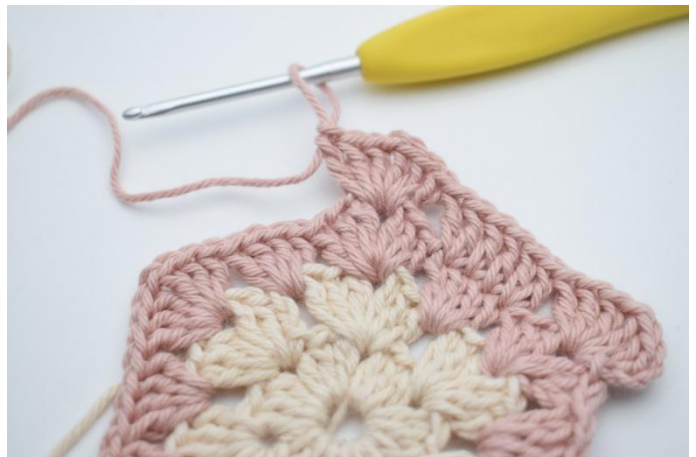
8. "Virka 3 st, 1 lm, 3 st i nästa lm-mellanrum,