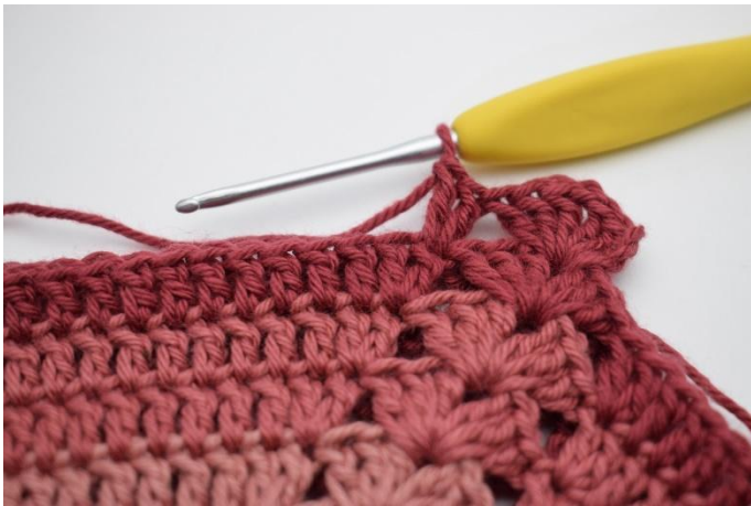
5. virka 2 st i nästa m,