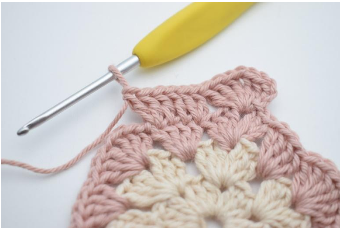
7. Så här.