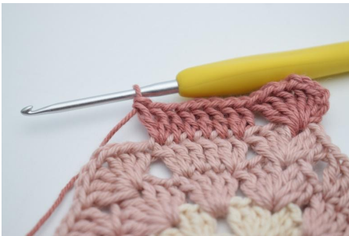
7. Så här.