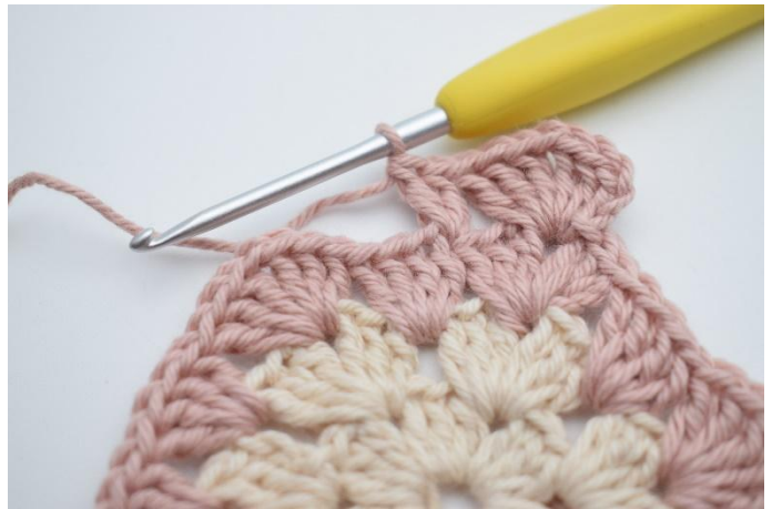
4. Så här.