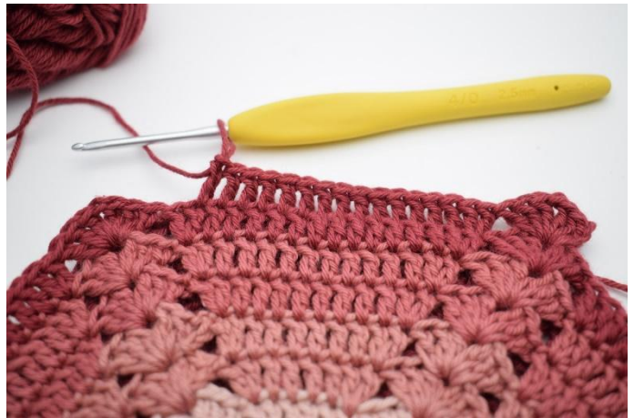
6. 1 st i de nästa 14 m,