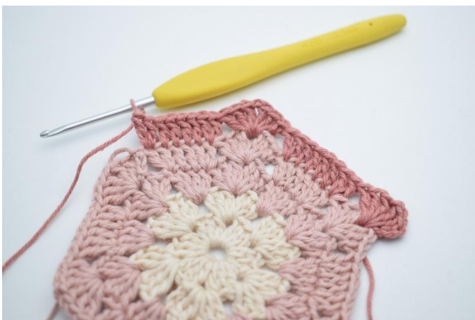
9. hoppa över 3 m, virka 2 st i nästa m, 1 st i de nästa 4 m, 2 st i nästa m".