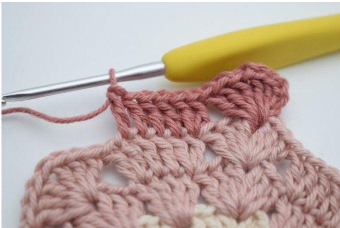
5. Virka 1st i de nästa 4 m.