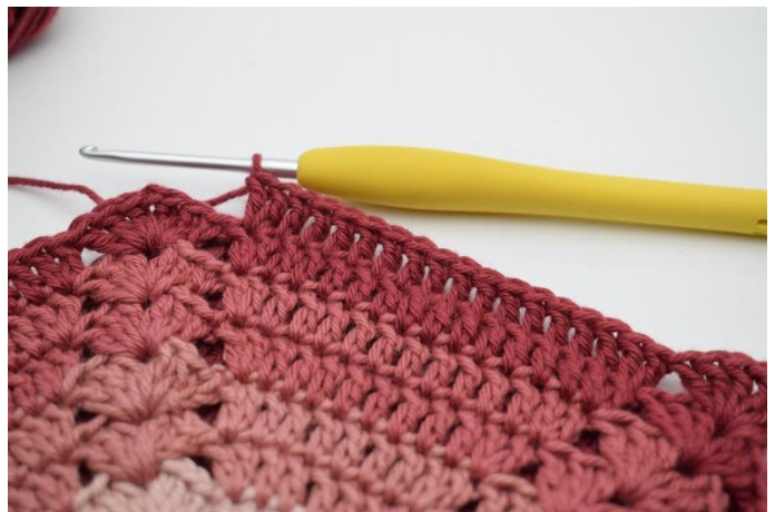
8. Så här.