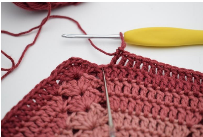
7. 2 st i nästa m.