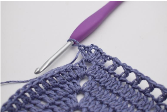
7. I lm-mellanrummet virkas "2 st, 2 lm, 2 st".