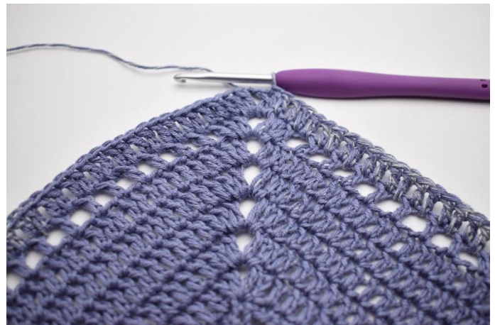
6. Så här.