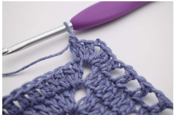
8. Gör 1 st i första m.