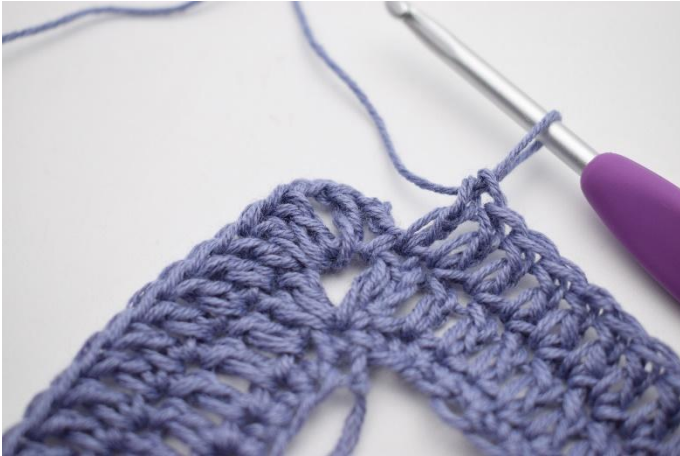
7. Virka 1 st i de sista 67 m.