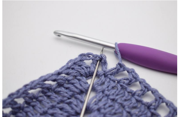
12. Avsluta med 1 sm