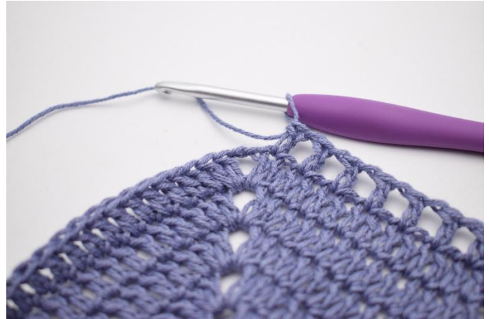
6. Upprepa "till" totalt 41 gånger.