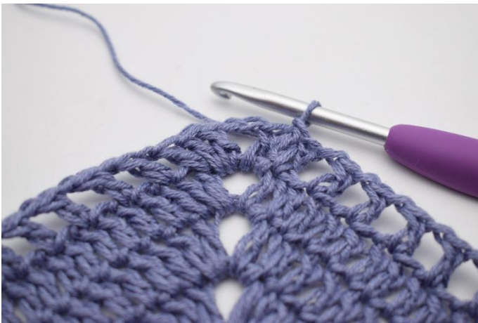
13. Så här.