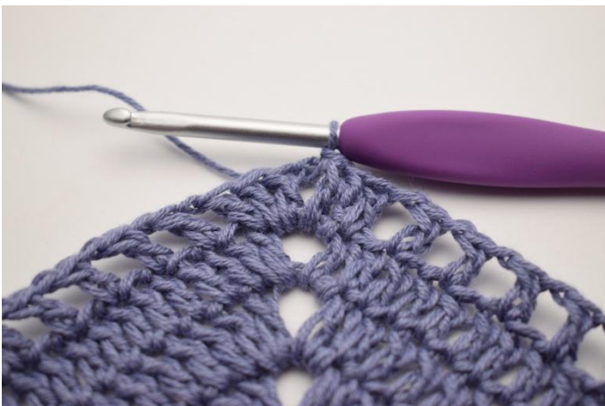
1. Gör sm fram till lm-mellanrummet.