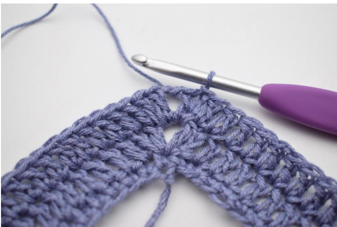
9. Så här.