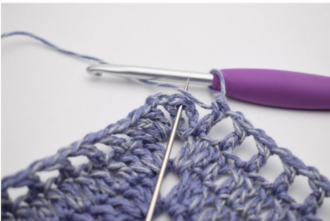
11. Avsluta med 1 sm.