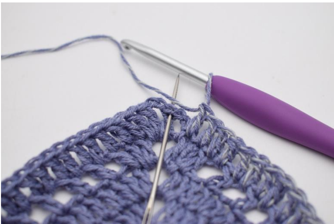
5. Virka 1 st i de sista 87 m. Avsluta med 1 sm.