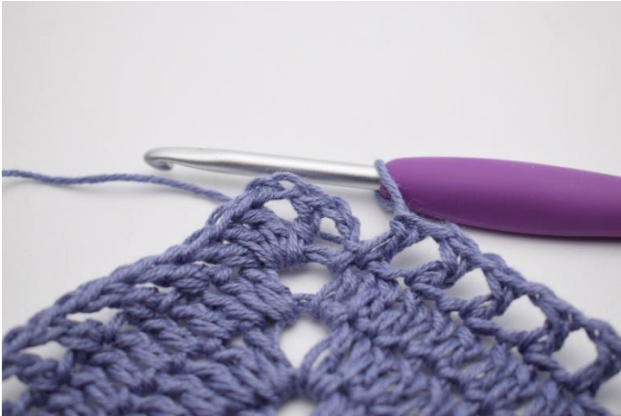
11. Upprepa "till" totalt 41 gånger.