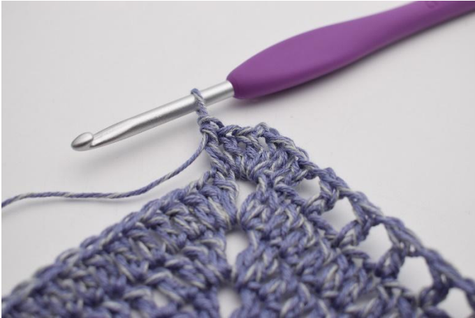
7. Gör 1 st i första m.