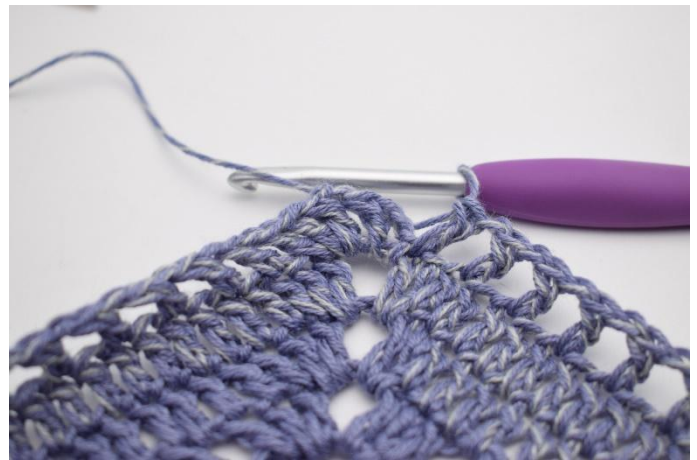
10. Upprepa "till" totalt 47 gånger.