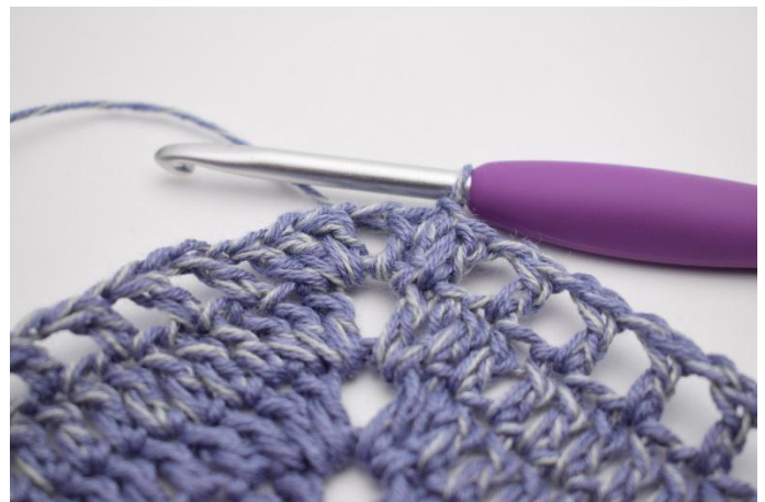
12. Så här.