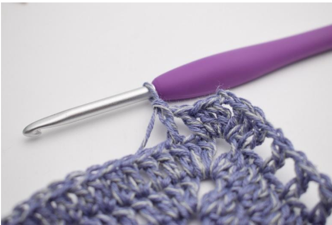
9. virka 1 st i nästa m".