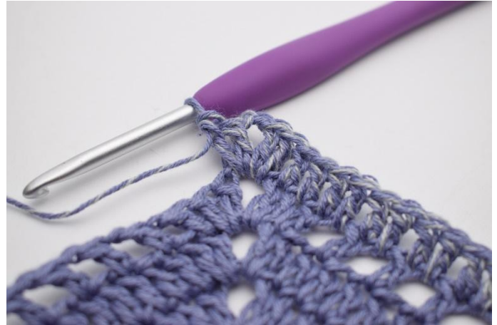
4. I 1m-mellanrummet virkas "2 st, 2 lm, 2 st".