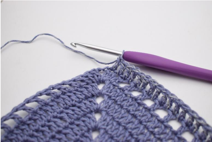
3. Virka 1 st i de följande 87 m och 1m håll.