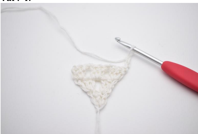
1. Vänd arbetet med 3 lm (ersätter 1.a st)