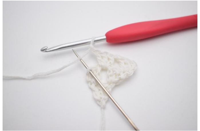
6. Gör 1 lm. Nu virkas det i sista m som nålen markerar här.