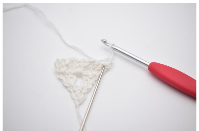
2. I första m, som nålen markerar här,