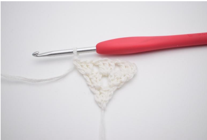
7. Virka 1 stgr i sista m.